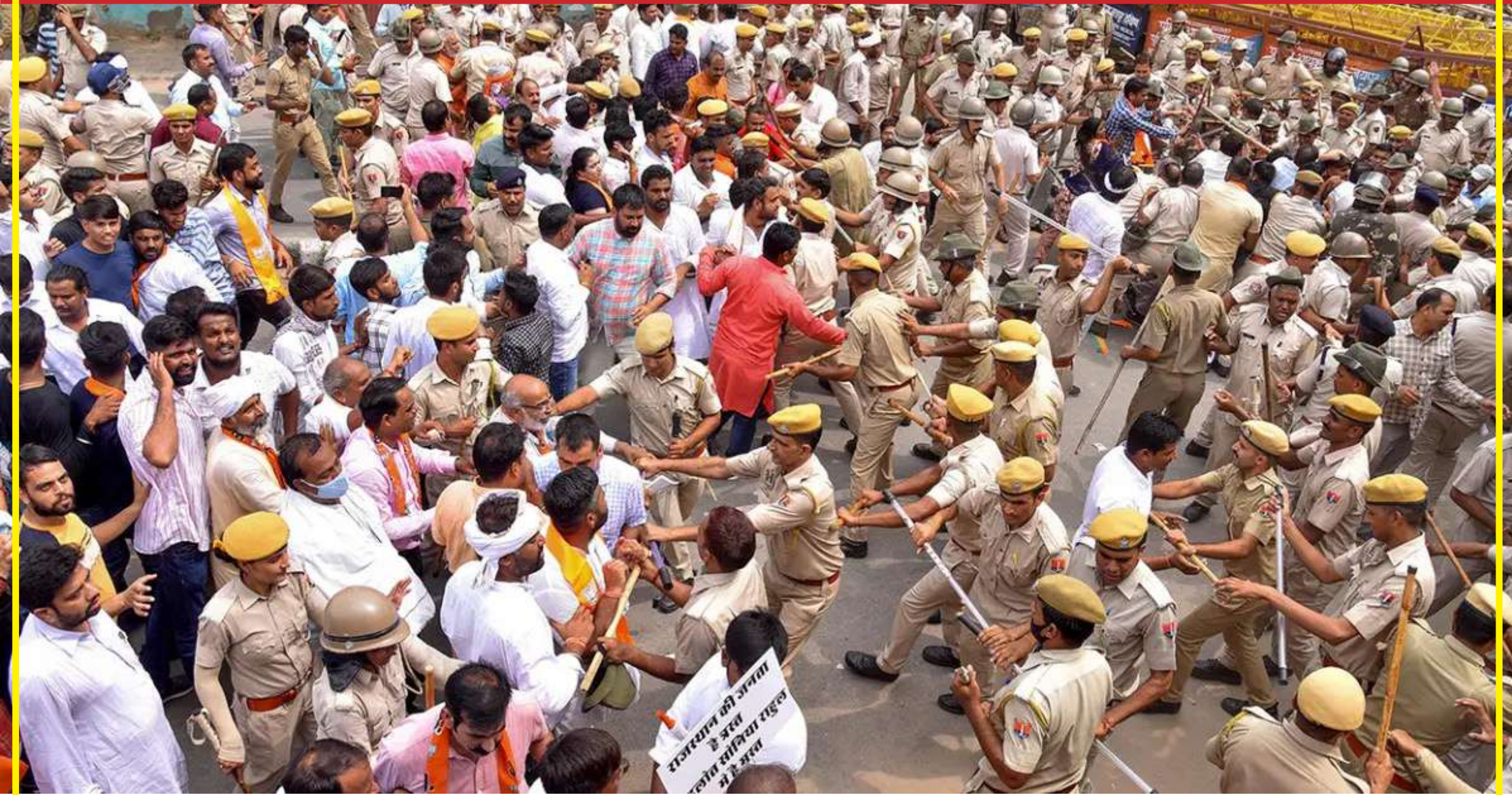
જયપુરની સિવિલ લાઈન્સ ખાતે રાજ્યમાં ઢોરની ચામડીના રોગથી થતા મૃત્યુ થવાના કારણે ભાજપના કાર્યકરો દ્વારા વિરોધ પ્રદર્શન કરવામાં આવ્યું હતું. તેમજ વિરોધ પ્રદર્શન રોકવા માટે પોલીસ કર્મી અને ભાજપના કાર્યકરો સંઘ જોવા મળ્યો હતો.