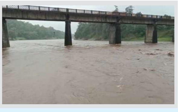
મહિલાઓ અને બાળકોને નદીમાં પાણી ઓસરે ત્યાં સુધી રાહ જોવી પડી

ડાંગ, તા. ૨૦ | જિલ્લામાં પડી રહેલા ધોધમાર વરસાદ સાથે ઉપરવાસમાં પણ ભારે વરસાદને કારણે ડાંગ જિલ્લાની મુખ્ય નદીઓમાં ઘોડાપૂર જોવા મળ્યા છે. ધસમસતા પાણીને કારણે જિલ્લામાં ૨૦થી વધુ નાના મોટા કોઝવે ઉપર પાણી ફરી વળતા અનેક ગામો સંપર્ક વિહોણા બન્યા હતા જ્યારે હજારો લોકો અટવાઈ પડ્યા હતા. ડાંગ જિલ્લામાં છેલ્લા બે દિવસથી ક્યાંક ધોધમાર તો ક્યાંક છૂટો છવાયો સાર્વત્રિક વરસાદ નોંધાયો છે. પાછોતરા વરસાદને પગલે ખેડૂતોને નુકસાન જવાની ભીતિ સેવાઈ રહી છે. જ્યારે સામાન્ય જનજીવન પણ પ્રભાવિત બન્યું છે. ગ્રામ્ય વિસ્તારોમાં ત્રણ પશુના પણ મૃત્યુ નોંધાયા છે. સતત વરસાદને લીધે જિલ્લાના અંતરિયાળ વિસ્તારોમાં માર્ગો ઉપર વરસાદી પાણી ફરી વળ્યાં હતા. આ વરસાદને પગલે જિલ્લાના ૨૦ જેટલા લો લેવલ કોઝ વે, અને નીચાણવાળા માર્ગો ઉપર વરસાદી પાણી ભરાઈ ગયા હતા. વહીવટી તંત્ર દ્વારા સુરક્ષાને ધ્યાનમાં રાખી આ તમામ માર્ગો વાહન વ્યવહાર માટે બંધ કરાયા છે. રાહદારીઓ, પશુપાલકો તથા વાહન ચાલકોને આ માર્ગો ન બંદલે, તંત્ર એ સૂચવેલા વૈકલ્પિક માર્ગોનો ઉપયોગ કરવાની અપીલ કરવામાં આવી છે.