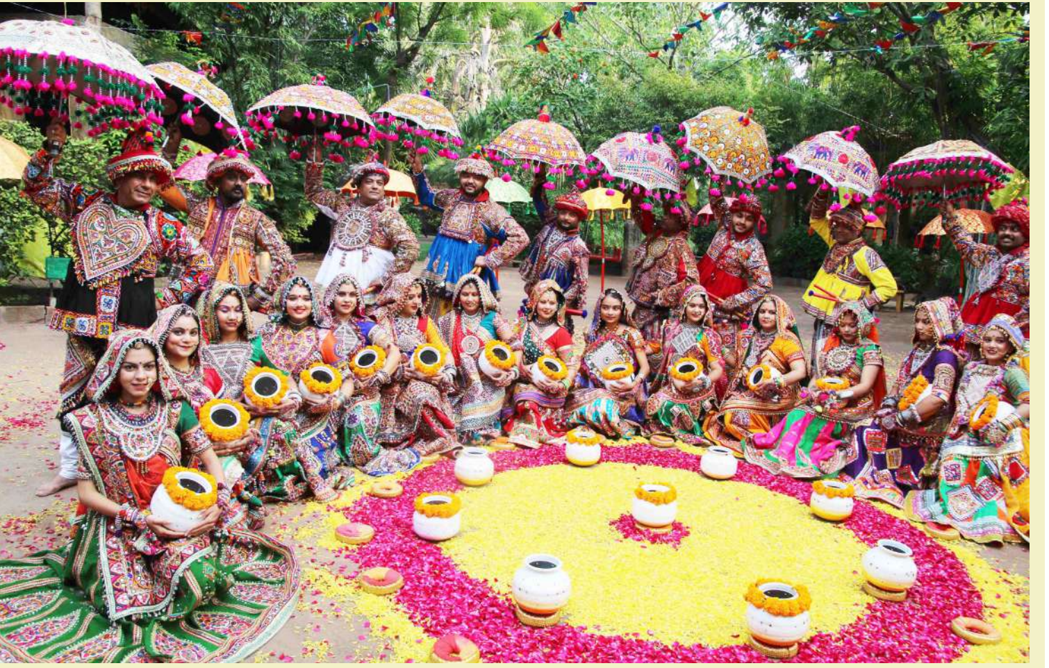
અમદાવાદ | નવરાત્રિ આવતા દરેક રાસ ગરબા રમનાર રસિકો દ્વારા ગરબા ની પ્રેક્ટિસ કરે છે તેવી રીતે પંચગત રાસ-ગરબા દ્વારા આજે ગરબાની પ્રેક્ટિસ કરાવવામાં આવી હતી. હાલ અમદાવાદ સહિત સમગ્ર ગુજરાતમાં નવરાત્રિની તૈયારીનો માહોલ જોવા મળી રહ્યો છે.