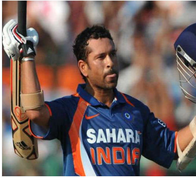
લોક પત્રિકા | નવી દિલ્હી

હાન બેટ્સમેન સચિન તેંડલકરે 12 વર્ષ અગાઉ ગ્વાલિયરમાં ઓતરરાષ્ટ્રીય વન-ડે ઈતિહાસમાં જે બોલથી પ્રથમ બેવડી સદી ફટકારી હતી, તે બોલ તેમને ઈન્દોરમાં ભેટ તરીકે આપવામાં આવ્યો છે. મધ્યપ્રદેશ ક્રિકેટ એસોસિએશન (MPCA) ના એક અધિકારીએ સોમવારના રોજ આ જાણકારી આપી હતી. ઉલ્લેખનીય છે કે, તેંડલકર હાલમાં 'રોડ સેફ્ટી વર્લ્ડ સીરિઝ ટૂર્નામેન્ટ-1'ના 20 મેચોના અનુસંધાને ઈન્દોરમાં છે. આ ઝડપી ગતિનું કોર્મટ ધરાવતી આ સ્પર્ધામાં પૂર્વ ભૂતપૂર્વ ઓતરરાષ્ટ્રીય ક્રિકેટરોથી સજ્જ વિવિધ દેશોની ટીમો વચ્ચે મેચ રમાઈ રહી છે. તેમાં તેંડલકર 'ઈન્ડિયા લિજેન્ડ્સ'નું નેતૃત્વ કરી રહ્યા છે. MPCA ના મુખ્ય કમ્યુનિટી સમંદર સિંહ