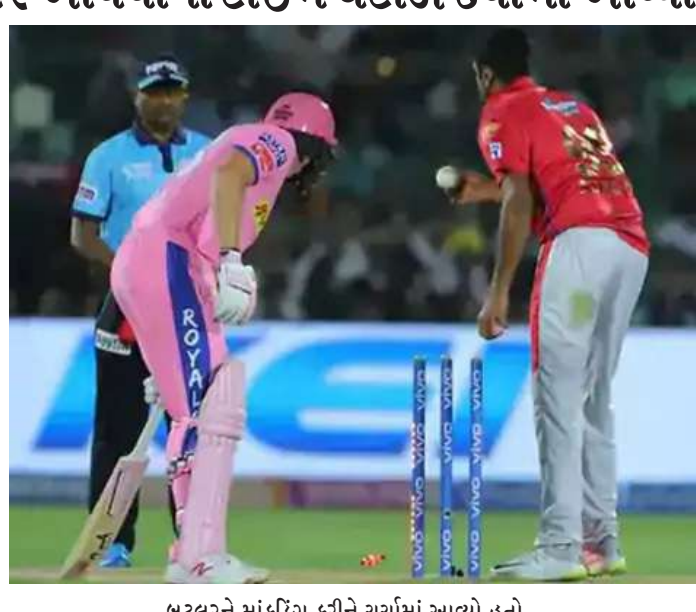
લોક પત્રિકા | નવી દિલ્હી

ઈન્ટરનેશનલ ક્રિકેટમાં હવે માંકડિંગ આઉટ નહિ ગણાય, પરંતુ ICCએ તેને રનઆઉટ તરીકે માન્ય રાખ્યું છે. ICCના ચીફ એક્ઝિક્યુટીવ કમિટીએ મંગળવારે નિયમોમાં બદલાવે મંજૂરી આપી દીધી છે. ICCએ બોલ ચમકાવવા માટે લાગુ ઉપર પ્રતિબંધ મૂકી દીધો છે. આટલું જ નહિ, બેટરનો ટાઈમ પિરિયડ પણ ઓછો કરી દીધો છે. ચીફ એક્ઝિક્યુટીવ કમિટીએ સૌરવ ગાંગુલીની આગેવાનીમાં બનેલી કમિટીના આ પ્રસ્તાવોને મંજૂરી આપી દીધી છે. ઈન્ટરનેશનલ ક્રિકેટમાં આ બદલાયેલા નિયમો 1 ઓક્ટોબરથી લાગુ થશે. એટલે કે 16 ઓક્ટોબરથી ઓસ્ટ્રેલિયામાં યોજાનારા T20 વર્લ્ડ કપ આ બદલાયેલા નિયમોની હેઠળ રમાશે.