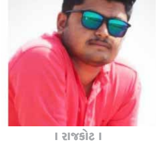
। રાજકોટ ।

જયપુરી ગોસ્વામી આપઘાત કેસમાં સિવિલ હોસ્પિટલ ખાતે સમાજના ટોળા એકત્ર થયાં