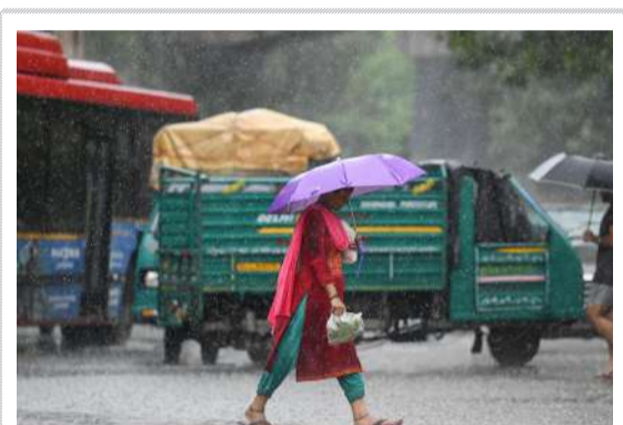
છોટાઉદેપુર, નર્મદામાં ભારે વરસાદની શક્યતા

આ હેતુસર કુલ ૮૬ કરોડ રૂપિયા માર્ગ અને મકાન વિભાગ દ્વારા ફાળવશે. મુખ્યમંત્રી ભૂપેન્દ્ર પટેલના આ શહેરીજન સુખાકારીની વૃદ્ધિ કરતા નિર્ણયને પરિણામે મહાનગરોમાં ચોમાસા દરમિયાન માર્ગોને થયેલા નુકસાનનું ત્વરાએ મરામત કાર્ય હાથ ધરી શકાશે. એટલું જ નહીં, માર્ગોની સુધારણા, મજબૂતીકરણને પરિણામે અર્બન મોબિલિટીમાં પણ સુગમતા રહેશે. મહાનગરપાલિકાઓએ સંબંધિત ધારાસભ્યશ્રીઓના પરામર્શમાં રહીને આ ગ્રાન્ટમાંથી કામો હાથ ધરવાના દિશાનિર્દેશો આપવામાં આવ્યા છે.