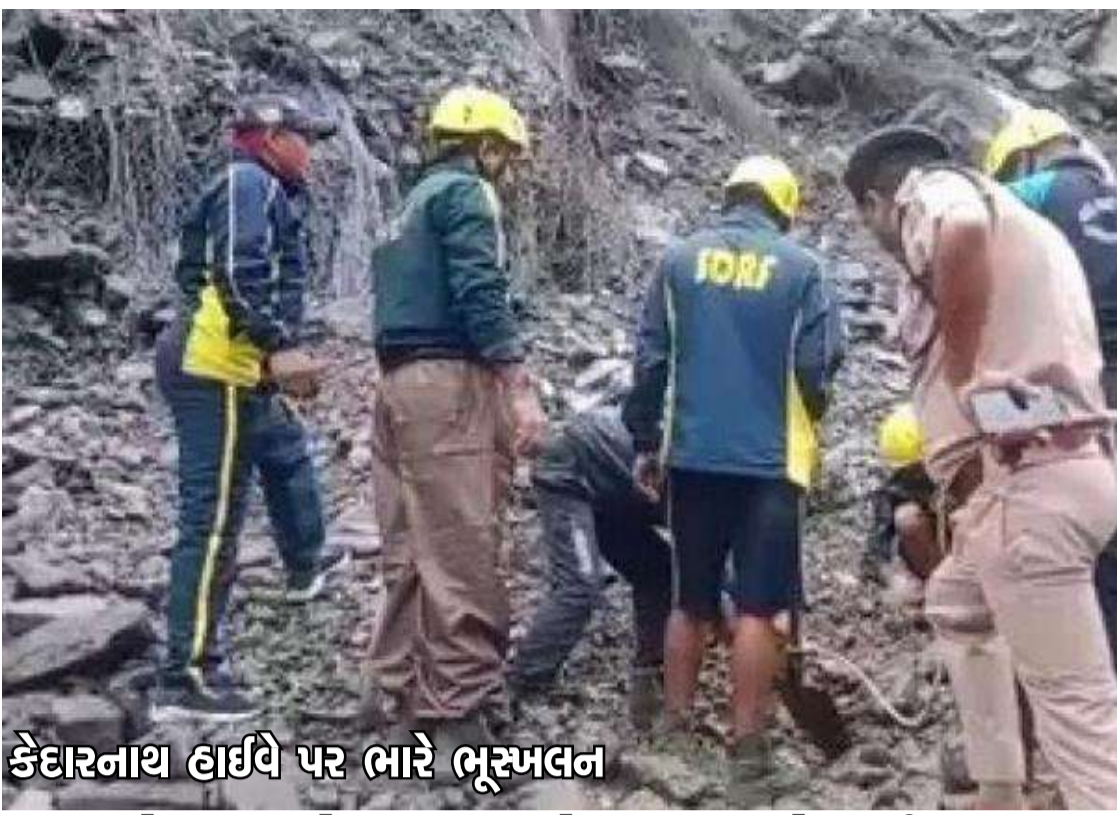
કેદારનાથ હાઈવે પર ભારે ભૂસ્ખલન