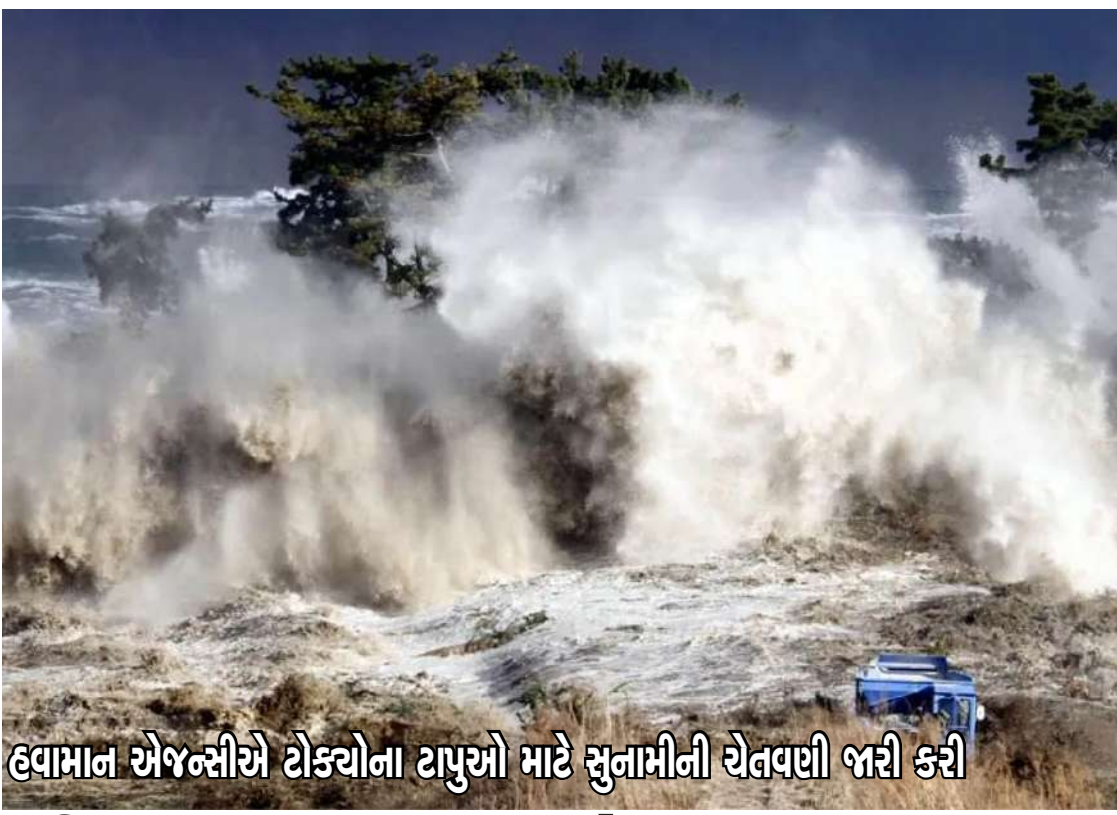
હવામાન એજન્સીએ ટોક્યોના ટાપુઓ માટે સુનામીની ચેલવણી જારી કરી