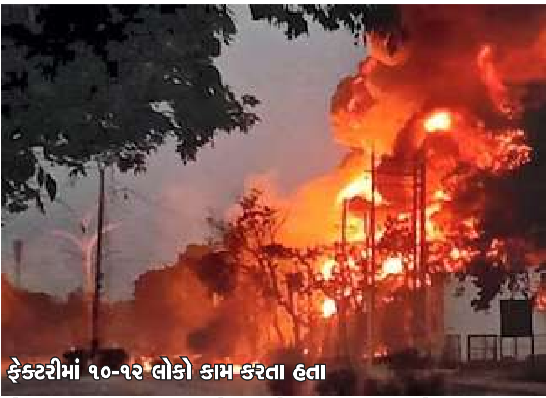
ફેક્ટરીમાં ૧૦-૧૨ લોકો કામ કરતા હતા