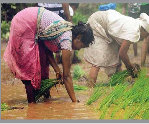
૧૦૦ ગણા ભાવથી વેચી દેવામાં આવે છે. કેન્દ્ર અને રાજ્ય સરકારો પણ સ્ટાર્ટ અપ શરૂ કરનાર ભણેલા યુવાનોને તો ખેડૂતો પ્રત્યે હમંશા ઉદાસીન રહે છે. જ્યાં સુધી ખેડૂતોની લોન માફીની વાત છે ત્યાં સુધી આ બાબત તો માત્ર દેખાવવા પુરતી નથી. સરકારને સમજ લેવાની જરૂર છે કે દેશના નાગરિક રાષ્ટ્રના વિકાસમાં એ વખતે જ જ ભરપૂર યોગદાન આપી શકે છે જ્યારે તે શરીરથી મજબુત હોઈ

દેશમાં ખેડૂતોની સ્થિતિને વધુ વધુ મજબુત કરવાની જરૂર ચોક્કસપણે દેખાઈ રહી છે. તમામ લોકો આ બાબત તો સ્વીકાર કરે છે કે આજે ખેડૂતોની તુલાનામાં કોર્પોરેટ જગત સાથે જોડાયેલા લોકોને વધારે રાહત મળી રહી છે. તેમને વધારે મજબુત કરવાના પ્રયાસ તમામ સ્તરે થઈ રહ્યા છે. ખેડૂતોને મજબુત કરવાના પ્રયાસ પણ થઈ રહ્યા છે પરંતુ તેની ગતિ જે પ્રકારની છે તે ખુબ ઉદાસીન કરનાર છે.