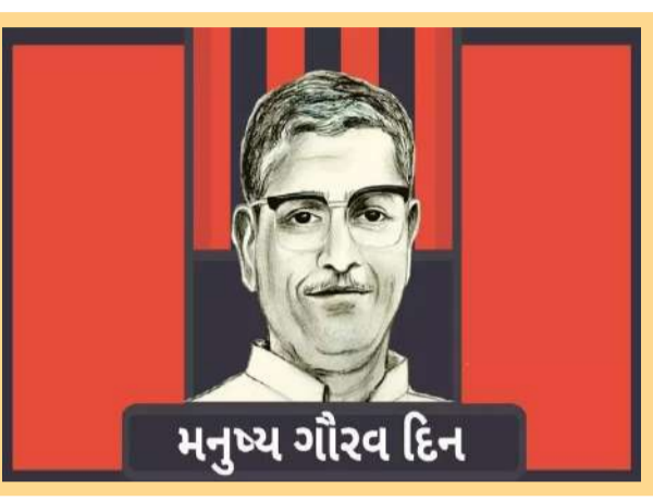
મનુષ્ય ગૌરવ દિન

મનુષ્ય ગૌરવદિનના પ્રણેતા એટલે પૂ. પાંડુરંગ શાસ્ત્રી આઠવલે દાદાનો જન્મદિવસ મનુષ્ય ગૌરવ દિવસ તરીકે ઉજવાય છે. દાદાનું કહેવું હતું કે ધર્મરત્ની પરમ શક્તિ મનુષ્યની અંદર છે. જે મનુષ્ય સારા કામો કરે છે તેનું ગૌરવ ગાન થાય જ છે. ૧૮મી ઓક્ટોબરે દર વર્ષે દાદાનો જન્મ દિવસ મનુષ્ય ગૌરવદિન તરીકે ઉજવાય છે.