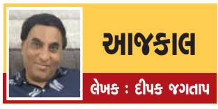
આજકાલ લેખક : દીપક જગતાપ