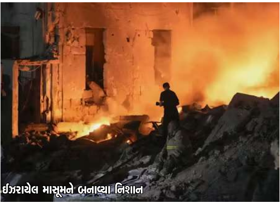
ઈઝરાયેલ માસૂમને બનાવ્યા નિશાન