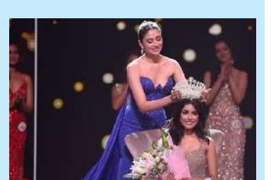
નિકિતા પોરવાલે ફેમિના મિસ ઈન્ડિયાનો ખિતાબ જીત્યો

પલટલા ટેન્કરમાંથી પેટ્રોલ રસ્તા પર ઢોળવા લાગ્યું હતું અને લોકો તેને ઉપાડી જવા માટે ભેગા થઈ ગયા હતાં. પરંતુ અચાનક ટેન્કરમાં તોલિંગ વિસ્ફોટ થયો હતો. સ્થાનિક લોકોના જણાવ્યા અનુસાર, સ્થળ પરનો કાબુ ગોટેગોટા ઊડી રહ્યા હતા. અત્યાર સુધીમાં લગભગ ૫૦ ઘાયલોને નજીકની જુદી જુદી હોસ્પિટલમાં દાખલ કરવામાં આવ્યા છે. સ્થળ પર ખરાબ રીતે ટાંકી ગયેલી લાશો પડી હતી. નાઈજીરિયાના જોગાવા સ્ટેટ એક્સપ્રેસવે પર એક ટેન્કરમાંથી પેટ્રોલ વૃંટવાનો પ્રયાસ કરવા જતાં તેમાં પ્રચંડ વિસ્ફોટ થયો હતો. તેના કારણે બાળકો સહિત લોકોના જણાવ્યા અનુસાર, સ્થળ પરનો કાબુ ગોટેગોટા ઊડી રહ્યા હતા. અત્યાર સુધીમાં લગભગ ૫૦ ઘાયલોને નજીકની જુદી જુદી હોસ્પિટલમાં દાખલ કરવામાં આવ્યા છે. સ્થળ પર ખરાબ રીતે ટાંકી ગયેલી