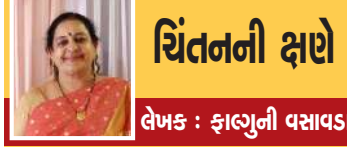
ચિંતનિકા ઢાઢે લેખક : ફાલ્ગુની વસાવડા

જિંદગીની સૌથી મોટી ફિલોસોફી દર્શાવતી કવિની આ રચના માનવી કઈ રીતે પોતાની આખી જિંદગી ફરિયાદમાં વિતાવે છે ક્યારેક જરૂરિયાતની માંગ, તો ક્યારેક અન્ય પણ માગણી રહે છે, વસ્તુની માગણી નહોય ત્યાં વ્યક્તિ વિશે ફરિયાદ થાય છે, એટલે કે સંબંધોમાં પણ એટલી જ ફરિયાદ આજકાલ વધી ગઈ છે, અને એને કારણે ગૃહસ્થાશ્રમ ખલાસ થઈ ગયા છે.