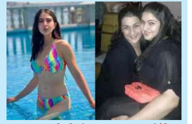
સારા અને તેની માતા અમૃતા સિંહે મુંબઈમાં વધુ બે નવી ઓફિસ ખરીદી

સારા અલી ખાન અને માતા કરોડોની બે પ્રોપર્ટી ખરીદી