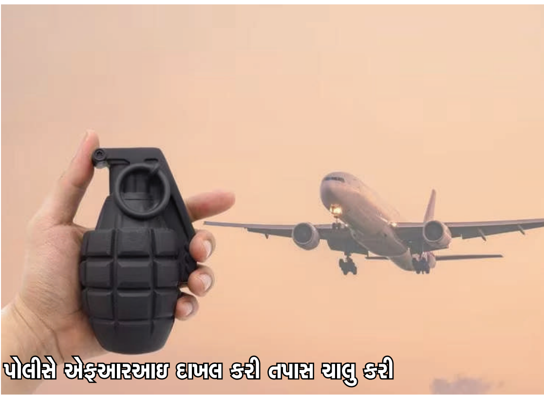
પોલીસે એફઆરઆઇ ઘાબલ કરી તપાસ ચાલુ કરી