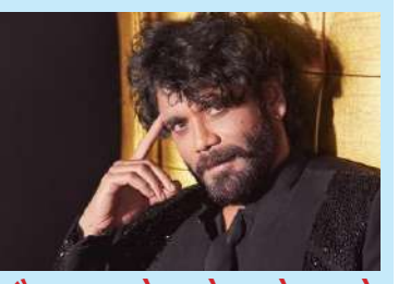
હેદરાબાદના એન કન્વેન્શન સેન્ટર સાથે સંબંધિત નાણાકીય ગેરરીતિનો આરોપ