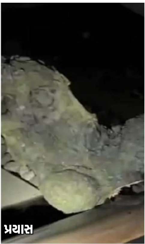
યુપીમાં ટ્રેનને ઊંચલાવી દેવાનો વધુ એક પ્રયાસ