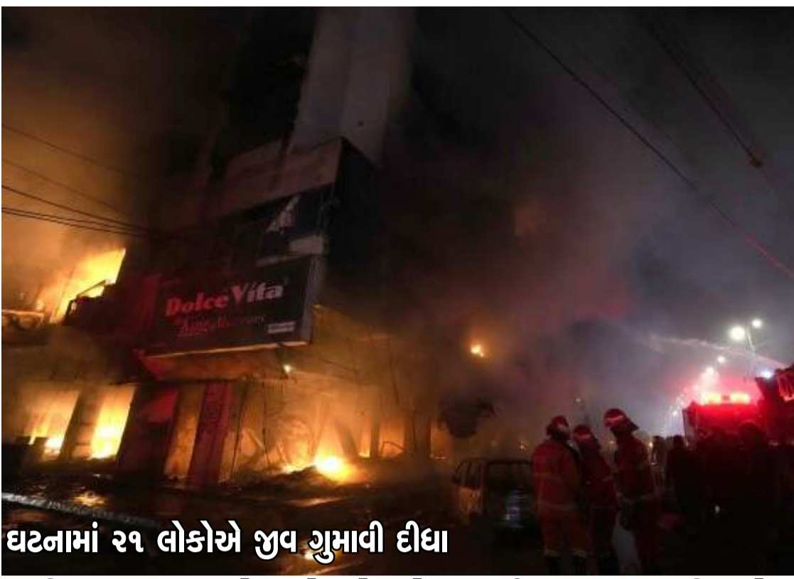
ઘટનામાં ૨૧ લોકોએ જીવ ગુમાવી દીધા