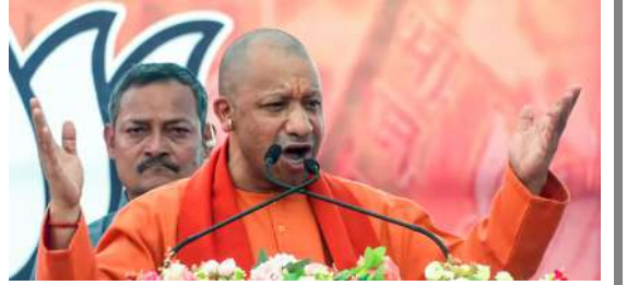
કમિશનના અહેવાલના આધારે એસસી-એસટી સમુદાયને અનામતની સુવિધા ઉપલબ્ધ છે, પરંતુ એએમયુમાં આ કરવામાં આવતું નથી. અલીગઢ મુસ્લિમ યુનિવર્સિટીમાં અનામત આપવામાં આવતી નથી. જ્યારે ભારત સરકારના પૈસા યુનિવર્સિટીઓમાં અનામત આપવામાં આવે છે, ત્યારે એસસી-એસટી અને પછાત જાતિના બાળકોને નોકરી અને શિક્ષણમાં અનામતનો લાભ મળવો જોઈએ. તેમણે કહ્યું કે કોંગ્રેસ, સમાજવાદી પ

લખનૌ, તા. ૧૦ । ઉત્તરપ્રદેશના મુખ્યપ્રધાન યોગી આદિત્યનાથે અલીગઢની ખેર વિધાનસભા બેઠક પર ચૂંટણી સભાને સંબોધિત કરતા વિપક્ષો પર મોટા પ્રહારો કર્યા હતા. આ દરમિયાન સીએમ યોગીએ કહ્યું કે અલીગઢ મુસ્લિમ યુનિવર્સિટી (એએમયુ) કેન્દ્રના પૈસાથી ચાલે છે, પરંતુ તેઓ વંચિત અને પછાત લોકોને અનામત આપી રહ્યા નથી. મુખ્યમંત્રીએ કહ્યું કે અલીગઢ કેવું હોવું જોઈએ તેમાં ખેરનો સોલ શું હોવો જોઈએ? હું તમારી વચ્ચે આ વિશે ચર્ચા કરવા આવ્યો છું. મુખ્યપ્રધાન યોગી આદિત્યનાથે કહ્યું કે કેન્દ્ર સરકારના પૈસાથી ચાલતી કેન્દ્રીય સંસ્થા મુસ્લિમોને ૫૦ ટકા અનામત આપે છે, પરંતુ એસસી, એસટી, ઓબીસી અને અન્ય જાતિઓને ત્યાં અનામત મળતી નથી. મંડલ