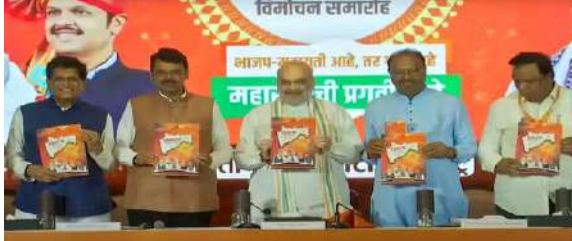
પ્રદેશ ભાજપ અધ્યક્ષ ચંદ્રશેખર ભાવનકુલે, મુંબઈ ભાજપ અધ્યક્ષ આશિષ શેલાર અને કેન્દ્રીય મંત્રી પીયૂષ ગોયલ અને અન્ય પાર્ટીના નેતાઓ હાજર હતા. ભાજપ એકનાથ શિંદેના નેતૃત્વવાળી શિવસેના અને અજિત પવારના નેતૃત્વવાળી રાષ્ટ્રવાદી કોંગ્રેસ પાર્ટી સાથે મહાગઠબંધન તરીકે ચૂંટણી લડી રહી છે. મેનિફેસ્ટો બહાર પાડતા શાહે કહ્યું કે, "મહાયુતિ સરકારે ખેડૂતોનું સન્માન કરવા, ગરીબોને મદદ કરવા અને મહિલાઓના સ્વાભિમાનને જાળવવાનું કામ કર્યું છે. આજે અહીં રિલીઝ થયેલું 'સંકલ્પ પત્ર' મહારાષ્ટ્રના લોકોની આકાંક્ષાઓનું પ્રતિબિંબ છે. " તેમણે કહ્યું, "એક રીતે જોઈએ તો, મહારાષ્ટ્ર અનેક યુગોથી દરેક ક્ષેત્રમાં દેશને અગ્રેસર કરી રહ્યું છે. એક સમયે જ્યારે જરૂરિયાત

લોભી થઈ ત્યારે ભક્તિ ચળવળ પણ મહારાષ્ટ્રમાંથી શરૂ થઈ હતી, ગુલામીમાંથી આઝાદીની ચળવળ પણ શિવાજી મહારાજે શરૂ કરી હતી. અહીંથી, સામાજિક ક્રાંતિની શરૂઆત પણ અહીંથી થઈ અને મહારાષ્ટ્રના લોકોની આકાંક્ષાઓ અમારા મેનિફેસ્ટોમાં પ્રતિબિંબિત થાય છે." ગૃહમંત્રીએ ૨૦૨૦ સુધીમાં ભારતને ત્રીજી સૌથી મોટી અર્થવ્યવસ્થા બનાવવાના ભાજપના વચનો પણ પૂરા નહોત્યા કર્યાં હતા. શાહે કહ્યું, "ભારત પાંચમી સૌથી મોટી અર્થવ્યવસ્થા બનાવવાના સ્થાને પહોંચી ગયું છે અને હું વચન આપું છું કે ૨૦૨૭ સુધીમાં આપણે ત્રીજી સૌથી મોટી અર્થવ્યવસ્થા બનાવવા જઈ રહ્યા છીએ. લોભી થઈ ત્યારે ભક્તિ ચળવળ પણ મહારાષ્ટ્રમાંથી શરૂ થઈ હતી, ગુલામીમાંથી આઝાદીની ચળવળ પણ શિવાજી મહારાજે શરૂ કરી હતી. અહીંથી, સામાજિક ક્રાંતિની શરૂઆત પણ અહીંથી થઈ અને મહારાષ્ટ્રના લોકોની આકાંક્ષાઓ અમારા મેનિફેસ્ટોમાં પ્રતિબિંબિત થાય છે." ગૃહમંત્રીએ ૨૦૨૦ સુધીમાં ભારતને ત્રીજી સૌથી મોટી અર્થવ્યવસ્થા બનાવવાના ભાજપના વચનો પણ પૂરા નહોત્યા કર્યાં હતા. શાહે કહ્યું, "ભારત પાંચમી સૌથી મોટી અર્થવ્યવસ્થા બનાવવાના સ્થાને પહોંચી ગયું છે અને હું વચન આપું છું કે ૨૦૨૭ સુધીમાં આપણે ત્રીજી સૌથી મોટી અર્થવ્યવસ્થા બનાવવા જઈ રહ્યા છીએ.