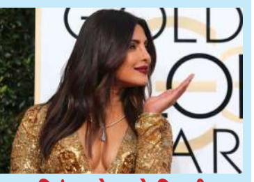
પ્રિયંકા ચોપરાએ દિવાળી સેલિબ્રેશનના ફોટો શેર કર્યાં પ્રિયંકા લંડનમાં બેસી ખમણ, ખાંડવી અને જલેબીનો સ્વાદ લીધો

પ્રિયંકા ચોપરા જોનસને સોશિયલ મીડિયા પર ટિકટી મેરીના બેલી ડાન્સની ઝલક ચાહકો સાથે શેર કરી છે. સાથે અભિનેત્રી લંડનમાં ખમણ, ખાંડવી અને જલેબીનો સ્વાદ માણી રહી છે. ગ્લોબલ સ્ટાર પ્રિયંકા ચોપરા જોનસે પોતાની લાડલી માલતી મેરીની એક ઝલક ચાહકો સાથે શેર કરી છે. પ્રિયંકાએ ઈન્સ્ટાગ્રામ સ્ટોરી પર માલતીના બેલી ડાન્સનો ફોટો શેર કર્યો છે. અભિનેત્રી પોતાની લાઈફ સાથે જોડાયેલી નાની મોટી પુણી ચાહકો સાથે શેર કરતી રહે છે. માલતી પોતાના માતા-પિતા પ્રિયંકા અને નિક સાથે ક્વોલિટી સમય પસાર કરતી રહે છે. દેશી ગર્લ બ્લે લંડનમાં રહે છે પરંતુ તે ભારતીય રેહણી કહેણી ક્યારે ભૂલતી નથી, કોઈ તહેવાર હોય કે પછી ધાર્મિક કાર્ય હોય વિદેશમાં રહીને પણ ભારતીય રીતિ રિવાજને ફોલો કરવાનું ભૂલતી નથી. પ્રિયંકા ચોપરાએ દિવાળી સેલિબ્રેશનના ફોટો શેર કર્યાં છે.