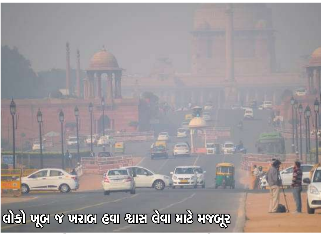
લોકો ખૂબ જ ખરાબ હવા શ્વાસ લેવા માટે મજબૂર