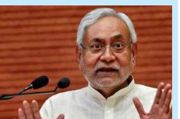
અટલ બિહારી વાજપેયી મને ખૂબ પસંદ કરતા હતા અને તેમણે મુખ્યમંત્રી બનાવ્યો

પટલા, તા. ૧૦ । બિહારના મુખ્યમંત્રી નીતિશ કુમારે પૂર્વ વડાપ્રધાન અટલ બિહારી વાજપેયી સાથેના સંબંધોને યાદ કર્યા અને એક મોટો પુલાસો પણ કર્યો. નીતિશ કુમારે કહ્યું કે ભારતીય જનતા પાર્ટીના દિગ્ગજ નેતા અટલજીએ ઈન્ડિયાનો પહેલા તેમને બિહારના મુખ્યમંત્રી બનાવ્યા હતા. બિહારના અરહમમાં એક રેલીને સંબોધતા નીતિશે કહ્યું, "હું સ્વર્ગસ્થ અટલ બિહારી વાજપેયીજીની સરકારમાં મંત્રી હતો." તે મને ખૂબ પસંદ કરતા હતાં તેમણે જ મને બિહારનો મુખ્યપ્રધાન બનાવ્યો હતો. મેં કેટલીક ભૂલો કરી હતી પરંતુ હવે અમે સાથે મળીને કામ કરીશું. નીતિશે કહ્યું, "અમે જોયું કે કોઈ કામ થઈ રહ્યું નથી. આરજેડી સરકાર દરમિયાન, ડરના કારણે સાંજ ૫ થી કોઈ ઘરની બહાર નીકળી શકતું ન હતું તેમના કારણે અથડામણ થતી હતી. તેઓ માત્ર મુસ્લિમ મતો ઈચ્છતા હતા પરંતુ હિન્દુ-મુસ્લિમ સંઘર્ષો વધી રહ્યા હતા પરંતુ આપણે સત્તામાં આવ્યા પછી કોઈ અથડામણ થઈ છે?