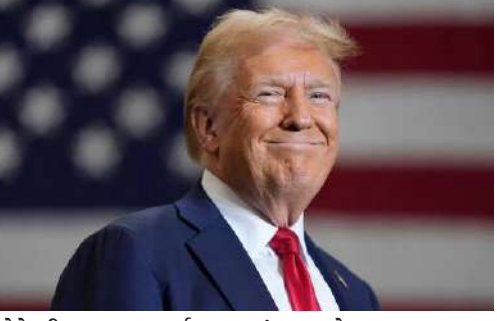
નાટોના સેક્રેટરી જનરલ માર્ક રુટે સહિત લગભગ ૫૦ યુરોપિયન નેતાઓ યુએસ પ્રમુખપદની ચૂંટણીમાં ડોનાલ્ડ ટ્રમ્પની જીત બાદ સંબંધો પર અસરનું મૂલ્યાંકન કરશે.

લુડાપેસ્ટ, તા. ૧૦ । ટ્રમ્પના અમેરિકા પાછા ફરવાથી યુરોપિયન યુનિયનના નેતાઓમાં ખળભળાટ મચી ગયો છે. યુરોપિયન યુનિયનને આરાંકા છે કે ટ્રમ્પનું વલણ ઘણી બાબતોમાં યુરોપ વિરુદ્ધ હોઈ શકે છે. આવી સ્થિતિમાં કાન્સ અને જર્મનીના એક થવાના આહ્વાન બાદ યુરોપના ૫૦ નેતાઓએ બેઠક યોજી હતી. આ પછી હવે ૨૭ દેશોએ ટૂંક સમયમાં શિખર મંત્રણા યોજવાની જાહેરાત કરી છે. યુકેનના રાષ્ટ્રપતિ ઝેલેન્સ્કી અને