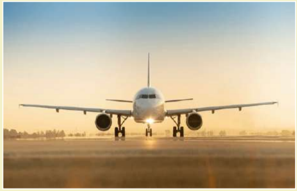
એનઆઈએની સાઇબર ટીમ અને તાલીમ પામેલા કમાન્ડો મહત્વના એરપોર્ટ પર તેના કરવામાં આવ્યા છે અને એનઆઈએની સાઈબર સેલ પણ ધમકી ભર્યા ફોન કોલ્સ અને ઈમેલ ની તપાસ કરવા માટે એફબીઆઈ સાથે પણ સંકલન કરી રહી છે.. પ્રાથમિક તપાસમાં પાલીસ્તાની યુવની શંકા વ્યક્ત કરવામાં આવી છે અને શીખ પર જસ્ટીસ ના ચીફ ગુરુવનસિંહ

કાર્મ સિપોર્ટર, અમદાવાદ, તા. ૧૨ | હાલ દેશભરમાં દિવાળીના તહેવારને લઈને ભારે ઉત્સાહ અને ઉમંગ લોકોમાં દેખાઈ રહ્યો છે ત્યારે માત્ર ઓક્ટોબર મહિનામાં જ ૫૦૦ થી વધારે ધમકી ભર્યા ફોન કોલ્સ અને ઈમેલ દેશના જુદા જુદા એરપોર્ટને મળતા બળભાગટ મચી ગયો છે માત્ર ૧૬ જ દિવસમાં ૪૦ થી વધારે ધમકી ભર્યા ફોન આવતા ની સાથે હવે પેસેન્જરો પણ ગભરાઈ ગયા છે ખાસ કરીને એર ઈન્ડિયા ને ટાર્ગેટ કરીને ડોમેસ્ટિક અને ઈન્ટરનેશનલ ફ્લાયટોને બોમથી ઉડાવી દેવાની ઉદ્દેશ્ય ધમકી ભર્યા ફોન ઈમેલ અને સોશિયલ મીડિયા મારફત ધમકાવવામાં આવ્યા છે ત્યારબાદ indigo ને પણ ૩૨ જેટલી ધમકીઓ મળી છે ધમકી ભર્યા ફોન કોલ આવતા ની સાથે મુંબઈ દિલ્લી છત્તીસગઢ માંથી કુલ પાંચ શખ્સોની ધરપકડ કરાઈ છે અને અત્યાર સુધીમાં ૨૧