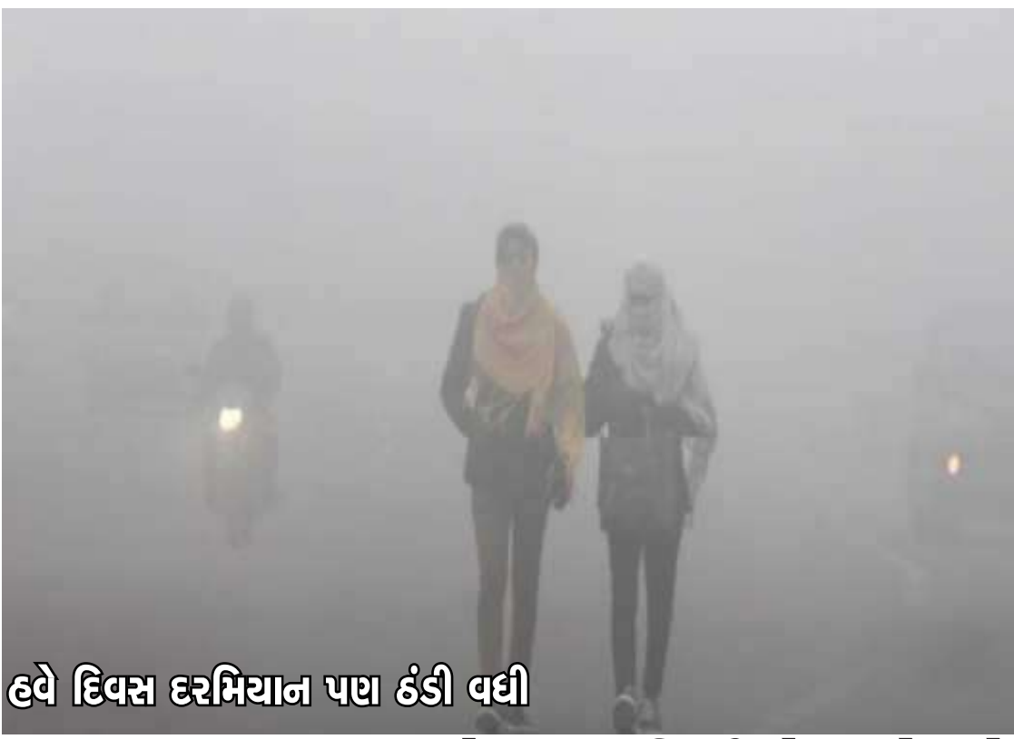
હવે દિવસ દરમિયાન પણ ઠંડી વધી