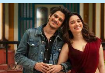
લસ્ટ સ્ટોરીઝ ૨'થી તમન્ના ભાટિયા અને વિજય વર્મા એકબીજાને ડેટ કરી રહ્યા