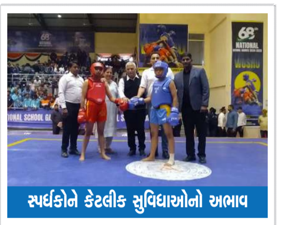
સ્પર્ધકોને કેટલીક સુવિધાઓનો અભાવ

રવિ પાક માટે ખેડૂતો ડીએપી ખાતરનો ઉપયોગ કરતા હોય છે ડીએપી ખાતરથી પાકમાં ઉતારો સારો આવે છે અને ફાલ પણ સારો આવે છે. ત્યારે હાલના સમયમાં ખેડૂતોને ડીએપી ખાતરની ખૂબ જ જરૂર છે. ખેડૂતો ખાતરના ડેપોમાં ડીએપી ખાતર લેવા જાય છે. પરંતુ હજુ સુધી ડીએપી ખાતર ખેડૂતને મળી રહ્યું નથી આથી ખેડૂતો સરકારને અપીલ કરી રહ્યા છે કે તાત્કાલિક ડીએપી ખાતર ખેડૂતોને આપવામાં આવે તો તેઓ રવિ પાક લઈ શકે.