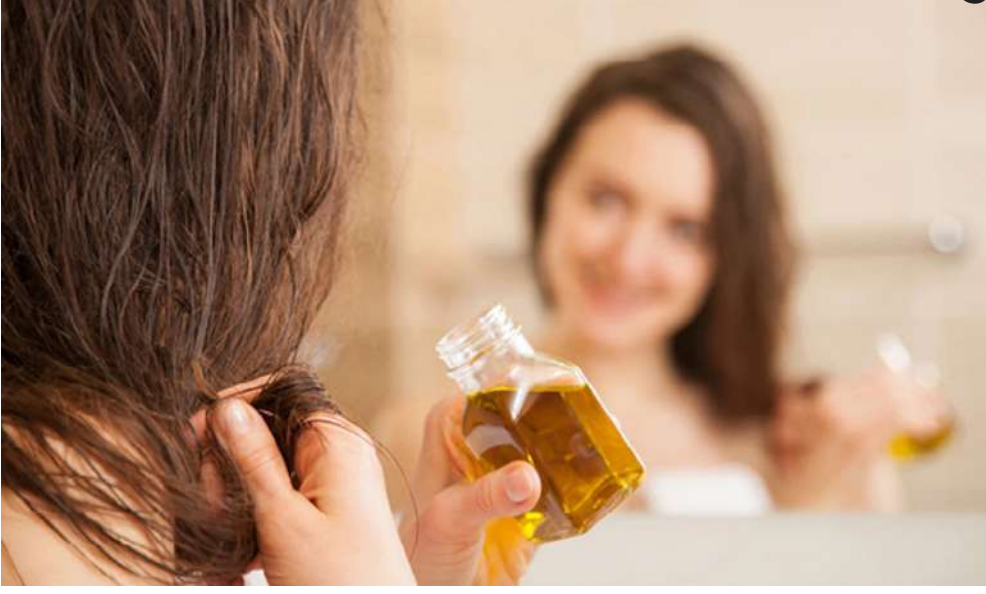
વાળ બળશે મજબૂત : એરંડાનું તેલ એન્ટી-ઈફ્લેમેટરી અને એન્ટી માઈક્રોબાયલ ગુણોથી ભરપૂર હોય છે.

વાળ બળશે સોફ્ટ : વાળને સોફ્ટ બનાવવા માટે કન્ડિશનરનો ઉપયોગ કરવાની સલાહ આપવામાં આવે છે, પરંતુ કેસ્ટર ઓઈલ એક સારું કન્ડિશનર પણ છે. તેને એલોવેરા જેલ, લીંબુ અને મધની સાથે વાળના મૂળિયામાં લગાવો અને એક કલાક રહેવા દો. ત્યારબાદ વાળને શેમ્પૂથી ધોઈ લો. આમ કરવાથી વાળ મજબૂત અને મુલાયમ થાય છે.