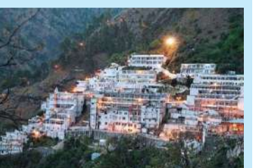
માર્ગ પર બનાવવામાં આવનાર રોપ-વે