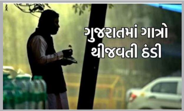
ગુજરાતમાં ગાત્રો થીજવતી ઠંડી

ગુજરાતમાં શિયાળાના વાતાવરણે લોકોને ધ્રૂજવા મજબૂર કરી દીધા છે. રાજ્યમાં ઠંડીનો કહેર સતત વધી રહ્યો છે. રાજ્યના સૌથી ગરમ શહેર અમદાવાદમાં પણ ઠંડીનો પ્રકોપ જોવા મળી રહ્યો છે, જ્યાં લઘુત્તમ તાપમાન ૨ ડિગ્રી સુધી ઘટી ગયું છે. આ ઉપરાંત રાજ્યના સૌથી ઠંડા શહેર નલિયાનું તાપમાન ૬.૫ ડિગ્રી નોંધાયું હતું. દરમિયાન, હવામાન વિભાગે જણાવ્યું હતું કે આગામી ૫ દિવસ સુધી રાજ્યના તાપમાનમાં કોઈ ફેરફાર થશે નહીં. હવામાન વિભાગની આગાહી મુજબ સૌરાષ્ટ્રમાં કડકડતી ઠંડી પડશે. આગામી ૫ દિવસમાં તાપમાનમાં ૧-૨ ડિગ્રીની વધઘટ થવાની સંભાવના છે. ઉત્તર-પૂર્વ દિશામાંથી ફૂંકાતા પૂર્વીય પવનોને કારણે ઠંડીમાં