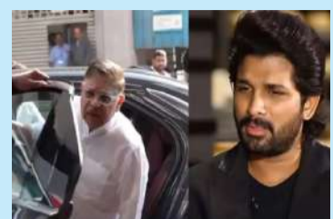
અલ્લુ અરવિંદ આજે ૪ ડિસેમ્બરે નાસભાગમાં ઘાયલ થયેલા બાળકને મળ્યા હતા

પુષ્પા ૨ સ્ટાર અલ્લુ અર્જુનના પિતા બાળકની હાલત ખાણવા હોસ્પિટલ પહોંચ્યા | મુંબઈ, તા. ૧૯ | પુષ્પા ૨ સ્ટાર અલ્લુ અર્જુનના પિતા અલ્લુ અરવિંદ આજે ૪ ડિસેમ્બરે નાસભાગમાં ઘાયલ થયેલા બાળકને મળ્યા હતા. અર્જુનના પિતા પીડિતાના પરિવારને મળ્યા હતા અને બાળકની સ્થિતિનો તાગ મેળવ્યો હતો. ૪ ડિસેમ્બરથી હોસ્પિટલમાં દાખલ બાળકની સ્થિતિ જણવા તેલંગાણાના આરોગ્ય સચિવ કિરિટીના ઝેડ યોગેશુ અને હેડરબાદના પોલીસ કમિશનર સી. આનંદ પણ તેમની સાથે હતા. બાદમાં તેણે મીડિયાને બાળકની હાલત વિશે જાણકારી આપી. પોલીસ કમિશનર સી.વી. આનંદે જણાવ્યું કે ઈજાના કારણે બાળકના મગજ પર પ્રભાવ અસર પડી છે. તેણે કહ્યું, જ્યારે તે નાસભાગમાં ઘાયલ થયો હતો, ત્યારે તેના મગજમાં ઓક્સિજન પહોંચી શક્યો ન હતો અને તેના કારણે તેની સ્થિતિ પર વિપરીત અસર થઈ હતી. ડોક્ટરોની ટીમ કહી રહી છે કે તેને સાજા થવામાં સમય લાગશે. બાળક હાલ વેન્ટિલેટર પર છે.