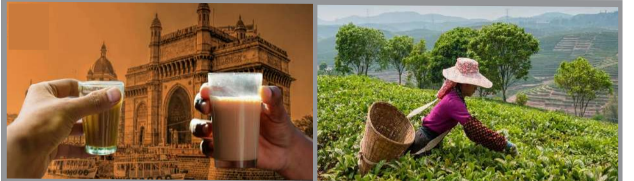
ભારતમાં ચા ના બગીચા ભારતના પૂર્વમુખે યા ના બગીચા એટલે કે ટી ગાર્ડન ખાસ કરીને આસામ, દાર્જિલિંગ, તમિલનાડુ અને કેરાલા મા વિશેષ થાય છે.

શિયાળાની ઠંડીમાં ચા અચૂક યાદ આવે. ઠંડીમાં ગરમાગરમ ચાની ચુસ્કીહોય તો મજા જ આવી જાય. આજે આપણે ચાની ગરમાગરમ વાતો કરીએ. દેશ અને દુનિયાભર મા સૌથી વધુ લોકો ચા પીવે છે. સદીઓથી સોના ધર ધરનું પીણું બની ગયેલ ચા આજે પણ લોકો મા અંટવી જ પ્રિય છે. પાણી પછી માનવીને પીણા તરીકે ઉપયોગમાં આવતું પીણું એટલે ‘ચા’ છે. ચા એટલે ચાનાં પ્રોસેસ કરેલાં પાન ગરમ પાણીમાં ઉકાળી જરૂર પ્રમાણે ઢૂંધ અને ખાંડ નાખી બનાવવામાં આવતું પીણું. પણ ચા ચા ની પૂર્ણ મોટી અદભૂત દુનિયા છે. ચા ના ફાયદા પણ ઘણા છે અને નુકશાન પણ ઘણા છે. સૌથી વધારે ચા ના શોખીન ભારતીયો છે. જેને કારણે ગલી ગલીએ ચાની લારીઓ થી માંડીનેમોટી મોટી મોટી હોટલો મા સ્પેશિયલ ચા નો કરોડો નો બિઝનેસ ચાલે છે.