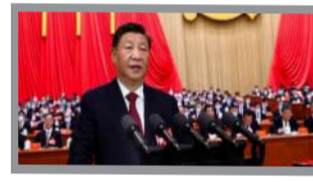
ચીનની સાખ નિરંતર વિવાદના દોરામાં છે ૨૦૧૩ પછીથી ચીનની આર્થિક ગતિ મંદ પડી છે

ચીનની સાખ નિરંતર વિવાદના દોરામાં છે ૨૦૧૩ પછીથી ચીનની આર્થિક ગતિ મંદ પડી છે રશિયાની યુદ્ધ નીતિના વિરોધ છતાંય ભારત-રશિયાના સંબંધો મજબૂત થતા ગયા આ બધુ ચીનની આંખોમાં કણાની માફક પૂંખી રહ્યું છે ચીન પોતાની આર્થિક જાળ દારા સામરિક સમીકરણની જાળ પાથરવામાં નિષ્ફળ થતું જોવા મળી રહ્યું છે