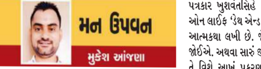
મન ઉપવન મુકેશ આંજણા

વર્તમાન માણસે પોતાના પરનો કાબુ ગુમાવી દીધો છે. છેલ્લા ઘાસ સુધી પધારીમાં પડ્યો હોવા છતાં કંઈક મેળવવાની ઝંખના માંથી છૂટી શકતો નથી. સાદા અર્થમાં કહીએ તો માણસની પાસે અપાર ઈચ્છાઓ છે. તેના લીધે જીવનમાં અંધકાર પ્રવેશતા વાર લાગતી નથી તે સૌથી મોટી પીડા છે, કેમ કે જીવનમાં ઘણું બધું મેળવવાની પાછળ માણસ અંધ બની જાય છે. માણસની ઘણું બધું મેળવવાની ઈચ્છાઓ પર લગામ નથી. જો માણસ સુખ મેળવવા માટે આંધળી દોટ મુકશે તો તેનું જીવન અંધકારમાં અટવાતું જશે. તેના લીધે ભવિષ્ય ધૂંધળું બની જાય છે. જીવનને પ્રકાશીત કરવું એટલે શાંતિસર સુખનાં ધામ તરફ પ્રયાણ કરવું. મહાન