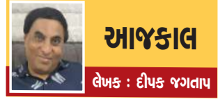
આજકાલ લેખક : દીપક જગતાપ