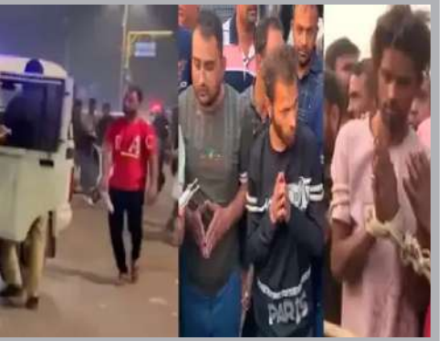
મંગાવી હતી અને કાયદાનું ભાન કરાવ્યું હતું. અમદાવાદમાં દિવસે ને દિવસે લુપ્તા તત્વોનો આતંક વધતો જાય છે. માથાભારે તત્વોને કાયદાનો ડર રહ્યો નથી હોય તેવું લાગી રહ્યું છે. હજુ તો રખિયાલ અને બાપુનગરમાં આતંક મચાવવાની ઘટનાને ચોવીસ કલાક પણ પુરા થયા ન હતા ત્યાં તો અમદાવાદના અસારવા બ્રીજ પાસે કેટલાક અસામાજિક તત્વો દ્વારા ખુલ્લેઆમ ઉઘાડી તલવારો લઈ સ્થાનિક રહીશોમાં ભય ફેલાવતાં હોવાનો વીડિયો વાયરલ થયો હતો. વીડિયોને જોતા લાગે છે કે તોફાની તત્વોને પોલીસનો પણ ભય રહ્યો નથી. વીડિયો વાયરલ થતાં શાહીબાગ પોલીસ હરકતમાં આવી ગઈ હતી અને ગણતરીના કલાકોમાં જ ઝડપી પાડી કાયદાનું ભાન કરાવ્યું હતું.