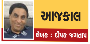
આજકાલ લેખક : દીપક જગતાપ