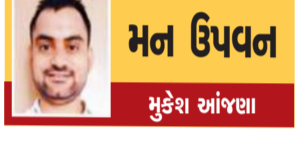
મન ઉપવન મુકેશ આંજણા

રસોલ કેરી અને કેસર જેવી જાતો ભારતમાં મુઘલ સમયગાળા દરમિયાન ઉગાડવામાં આવતી હતી. ૧૭૦૦ ઈસવીની આસપાસ કેરી બ્રાઝિલ પહોંચી અને અહીં કેરીના વૃક્ષો વાવવામાં આવ્યા અને ૧૭૪૦ ઈસવીમાં કેરી વેસ્ટ ઈન્ડિઝમાં લોકોની પસંદગી બની ગઈ. આજે કેરી સમગ્ર વિશ્વમાં એક પ્રિય ફળ બની ગઈ છે અને લોકો તેને ભેટ તરીકે એકબીજાને આપે છે.આજે વિશ્વમાં કેરીની ૧૫૦૦ થી વધુ જાતો છે. ભારતમાં ૨૫ મિલિયન ટન કેરીનું ઉત્પાદન થાય છે. કેરળના કચ્છ જિલ્લાના કચ્છપુરમને સ્વદેશી કેરી હેરિટેજ વિસ્તાર તરીકે જાહેર કરવામાં આવ્યો છે, જ્યાં કેરીની ૨૦૦ જાતો ઉગાડવામાં આવે છે. ભારત ઉપરાંત, કેરી પાકિસ્તાન અને ફિલિપાઈન્સના રાષ્ટ્રીય ફળ છે.કેરીમાં વિટામીન ઝ અને ઇ ભરપૂર માત્રામાં હોય છે. આ તથા માટે ખૂબ જ ફાયદાકારક છે. તે ભરપૂર ઊંચાઈના બહાર કાઢવામાં મદદ કરે છે. તે તથાના તેલના ઉત્પાદનને ઘટાડવામાં મદદ કરે છે. તે કચ્છલીઓ અને ફાઈન લાઈન જેવા વૃદ્ધવના ચિહ્નો ઘટાડે છે. કેરીમાં ટ્રાય ફાઈબર હોય છે. તેનાથી પ તે લોખંડ સમય સુધી ભરેવું રહે છે. તેનાથી ૮ મે ઓછું ખાણે. આમ તેનું સેવન કરવાથી વજન ઘટાડવામાં મદદ મળે છે.