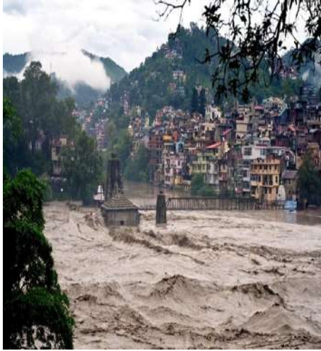
ઉત્તરાખંડ અને હિમાચલ પ્રદેશમાં ભારે વરસાદે ખૂબ તબાઈ મચાવી