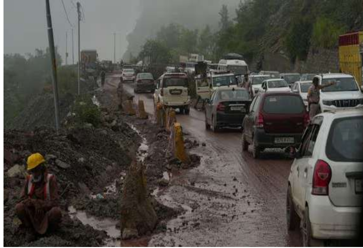
સવારે લગભગ ૩ વાગ્યે ગ્રામ પંચાયત સરપરાના સિક્કાસરી નાલા ગામમાં વાદળ ફાટવાની ઘટના બની હતી

ઉત્તરાખંડ, તા.૩૦ । ઉત્તરાખંડ અને હિમાચલ પ્રદેશમાં ભારે વરસાદ ખૂબ તબાઈ મચાવી છે. ઠેર-ઠેર નદીઓમાં પાણીની સપાટી વધતાં તે પુરપટ વેગે વહી રહી છે તો બીજી તરફ રસ્તાઓ પણ ભૂસ્ખલનનો ભોગ બન્યા છે. કેટલીક જગ્યાએ વાદળ ફાટવાની ઘટનાઓ પણ બની છે અને હવામાન વિભાગે ભારે વરસાદ માટે રેડ એલર્ટ જારી કર્યું છે. સોમવારે ઉત્તરાખંડ અને હિમાચલ પ્રદેશના ઘણા જિલ્લાઓમાં શૈક્ષણિક સંસ્થાઓમાં રજા જાહેર કરવાનો આદેશ જારી કરવામાં આવ્યો છે. ઉત્તરાખંડમાં સતત ત્રીજા દિવસે પણ હવામાનનો કહેર ચાલુ રહ્યો છે. હવામાન વિભાગે દેહરાદૂન, ઉત્તરકાશી, ટિહરી, પોરી, રૂદ્રપ્રયાગ, હરિદ્વાર, નૈનીતાલ, ચંપાવત અને ઉધમ સિંહ નગર સહિત કુલ ૯ જિલ્લાઓમાં રેડ એલર્ટ જાહેર કર્યું છે. ભારે વરસાદ અને ભૂસ્ખલનના ભયને ધ્યાનમાં રાખીને ચારધામ યાત્રા એક દિવસ માટે મુલતવી રાખવામાં આવી હતી. જે હવે પુનઃસ્થાપિત કરવામાં આવી છે. ભારે ભૂસ્ખલન અને કાટમાળને કારણે ગંગોત્રી અને યમુનોત્રી રાષ્ટ્રીય ધોરીમાર્ગના ઘણા ભાગો સંપૂર્ણપણે બંધ છે.