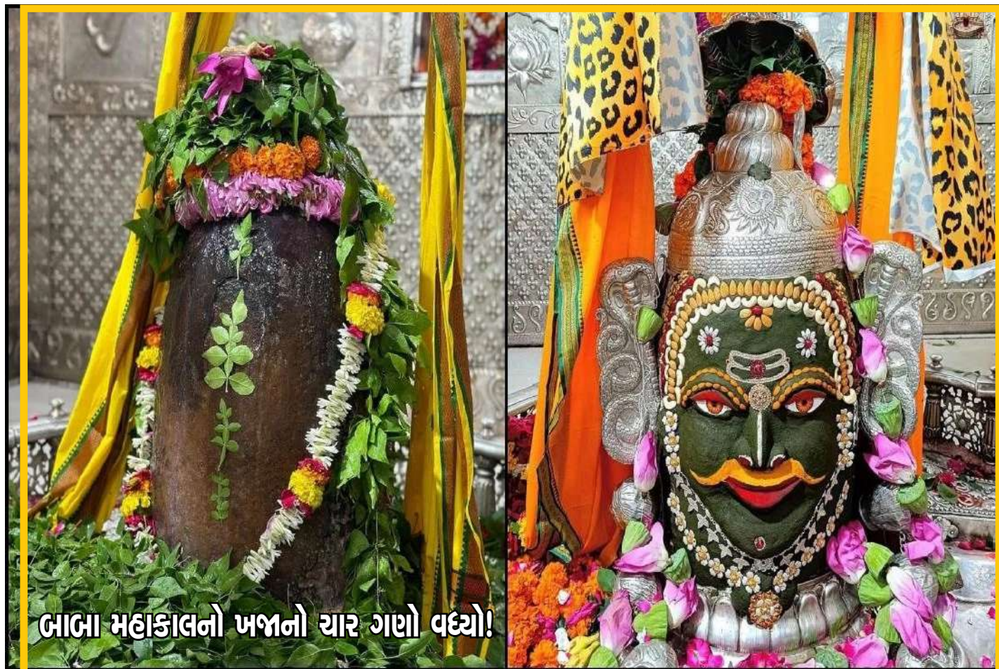
બાબા મહાકાલનો ખજાનો ચાર ગણો વધ્યો!