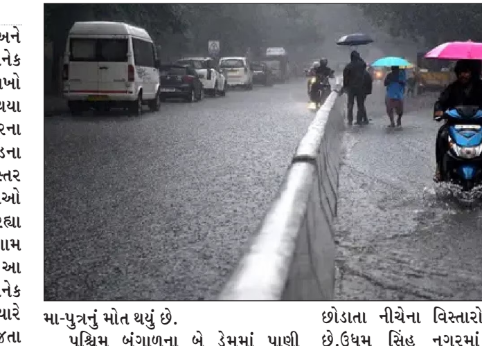
મા-પુત્રનું મોત થયું છે. પશ્ચિમ બંગાળના બે ઉંમમાં પાણી

। નવી દિલ્હી, તા.૩ । ઉત્તર ભારતના અનેક રાજ્યો પૂર અને વરસાદનો સામનો કરી રહ્યા છે. અનેક નદીઓના જળસ્તર વધવાના કારણે લાખો લોકો પોતાના ઘર છોડવા મજબૂત થયા છે. સૌથી વધુ યુપી અને રાજસ્થાન પૂરના ખતરાનો સામનો કરી રહ્યા છે. ઉત્તરાખંડના ઉદમ સિંહ નગરમાં રેલડા નદીનું જળસ્તર વધ્યું છે, તો ઉત્તર પ્રદેશમાં અનેક જિલ્લાઓ વરસાદ, પૂરના ખતરા સામે ઝઘમ્મી રહ્યા છે, જ્યારે મધ્યપ્રદેશના હમીપુરા ગામ પૂરની ઝપેટમાં આવી ગયું છે. આ ઉપરાંત રાજસ્થાનના ભરતપુરમાં અનેક ગામો જળમગન થઈ ગયા છે. જ્યારે બિહારના બગહામાં ટ્રેક્ટર પલટી જતા