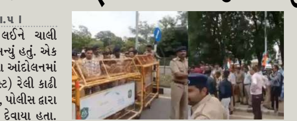
માંગણીઓને લઈને લડત ચલાવી રહ્યા છે. તેમનો મુદ્દો હતો કે, તેમના માટે અનામત રાખવામાં આવેલી

। પ્રતિનિધિ, ગાંધીનગર, તા.૫ । ગાંધીનગરમાં પડતર માંગણીને લઈને ચાલી રહેલું માજુ સૈનિકોનું આંદોલન ઉગ્ર બન્યું હતું. એક અઠવાડિયાથી વધુ સમયથી ચાલતા આ આંદોલનમાં માજુ સૈનિકોએ મંગળવારે (૫ ઓગસ્ટ) રેલી કાઢી વિધાનસભા ચરફ ક્લબ કરી હતી. પરંતુ, પોલીસ દ્વારા તેમને બસ સ્ટેશન પાસે જ અટકાવી દેવાયા હતા. નોંધનીય છે કે, માજુ સૈનિકો લાંબા સમયથી સરકારી ભરતીમાં અનામત બેઠક સહિતની વિવિધ પડતર