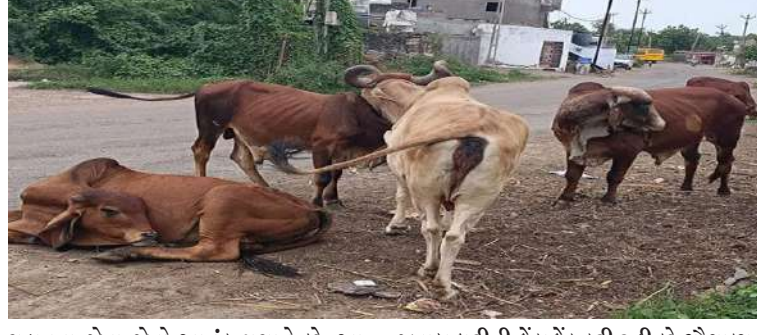
ચડાવવા જેવો આતંક મચાવે છે. આ બાબતે વહેલીતકે યોગ્ય નિરાકરણ લાવવું જરૂરી છે. કારણ કે, સરકારથી માંડીને ગ્રામ એ અપુરતા છે. આજે ઘાસચારા સહિતના જવાબદારીની ફેરફાર કરી રહી છે. ગૌશાળા સંચાલકોની ફરિયાદ છે કે, પશુદીઠ સરકાર દ્વારા ફક્ત રૂ. ૩૦ આપવામાં આવે છે એ અપુરતા છે. આજે ઘાસચારા સહિતના

પશુ ગણતરી કરવામાં આવી હતી ત્યારે ૧૧ તાલુકામાં ૨૪,૬૭૫ ખૂંટિયા નોંધાયા હતા. જે સંખ્યા આજે ૭૦,૦૦૦ સુધી પહોંચી ગઈ હોવાનો અંદાજ લગાવીને નાયબ પશુપાલન નિયામકને રજૂઆત કરી છે. તેમણે જણાવ્યું છે કે, આજે રાજકોટ જિલ્લામાં પલટ ગામડાં છે, એ દરેકમાં ૨૫થી લઈને ૭૫ જેટલા ખૂંખાર ખૂંટિયા દિવસ-રાત નધણિયાતા ખૂલ્લા ફરી રહ્યા છે. આ આખલા રાત્રે ખેડૂતોના ખેતરોમાં ત્રાટકે છે અને ઉભા પાકનો સોંધ વાળી દે માંડીને ગ્રામ પંચાયત સુધી જવાબદારીની ફેરફાર થઈ રહી છે. રાજકોટ જિલ્લા પંચાયતનાં આંકડા પ્રમાણે, વર્ષ ૨૦૧૯માં