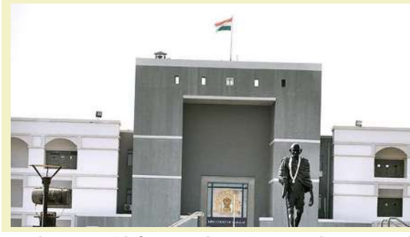
પતિને પણ હાઈકોર્ટ સમક્ષ એક સોગંદનામું ફાઇલ કરીને પતિ સામે ફરિયાદ રદ થાય તો કોર્ટ વાંધો ન હોવાનું જણાવ્યું હતું. ફરિયાદી પત્ની જાને પણ કોર્ટ સમક્ષ હાજર થઈ હતી. આ કેસની હકીકતમાં એવું સામે આવ્યું હતું કે, પત્ની તેના પતિ સાથે વેવાહિક જીવન નિભાવવા તેયાર નહોતી. તે

। પ્રતિનિધિ, અમદાવાદ, તા.પ । પત્નીના અંગત પળોના વીડિયો વાયરલ કરનારા પતિને હાઈકોર્ટે રૂ. ૨૫ હજારનો દંડ ફટકાર્યો છે. આ રૂપિયા ગુજરાત સ્ટેટ લીગલ ઓથોરિટી સમક્ષ એક અઠવાડિયામાં જમા કરાવવાનો હુકમ કરવામાં આવ્યો છે. આ રૂપિયા જમા થયા બાદ જ સંબંધિત મામલે થયેલી ફરિયાદ રદ કરવામાં આવશે. વડોદરા રહેતા એક પતિએ હાઈકોર્ટમાં ક્વોશિંગ પિટિશન કરી હતી અને તેની સામે તેના જ પત્નીએ કરેલી ફરિયાદ રદ કરવાની દાદ માગી હતી. જેમાં એવો દાવો કરવામાં આવ્યો હતો કે, ફરિયાદી પત્ની અને આરોપી પતિ વચ્ચે સંમતિપૂર્વક સમાધાન થઈ ગયું હોવાથી ફરિયાદ રદ કરવામાં આવે. આ મામલે