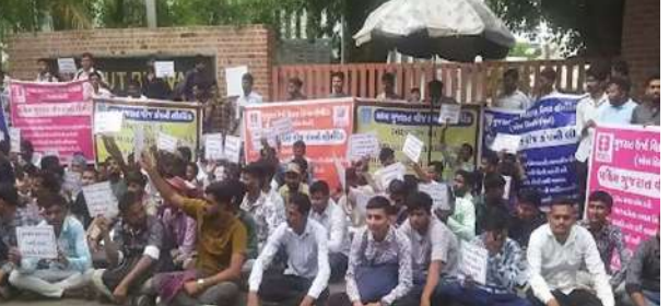
કહેવું હતું કે, અમે પહેલાં તો બે વર્ષ આઉટીઆઈમાં કોર્સ કર્યાં હતાં અને એ પછી વીજ કંપનીમાં એક વર્ષ માટે એપ્રિન્ટિસશિપ કરી હતી. એ પછી પરીક્ષાની તૈયારી કરી હતી અને ૬ મહિના પહેલાં વિદ્યુત સહાયકો માટે મધ્ય ગુજરાત વીજ કંપનીની પરીક્ષા આપી હતી. ૧૪૦૦થી ૨૦૦૦ જેટલા ઉમેદવારો આ પરીક્ષા પાસ કરી ચૂક્યા છે પરંતુ હવે વીજ કંપનીના સત્તાધીશો ભરતી કરવાની જગ્યાએ જેમ જેમ જગ્યા થશે તેમ ભરતી કરીશું તેવો જવાબ આપી રહ્યા છે. બીજી તરફ વીજ કંપનીના સત્તાધીશો આઉટસોર્સિંગ કર્યું છે અને તેમાં ૧૨૦૦ જેટલા કર્મચારીઓ કામ કરી રહ્યા છે.

। પ્રતિનિધિ, વડોદરા, તા.૫ । રાજ્ય સરકારની તમામ વીજ કંપનીઓમાં ભરતી પ્રક્રિયામાં થઈ રહેલા ધાંધિયાને લઈને ઉમેદવારોમાં ભારે રોષ જોવા મળી રહ્યો છે. સરકારી વીજ કંપનીઓમાં વિવિધ કામગીરીનું આઉટસોર્સિંગ કરીને ભરતી બંધ કરી દેવાની અધોપિત નીતિ વીજ કંપનીના સત્તાધીશોએ અમલમાં મૂકી છે. જેના કારણે વીજ કંપની દ્વારા લેવાતી પરીક્ષાઓ પાસ કરનારા ઉમેદવારો પણ નોકરીથી વંચિત છે. મળતી વિગતો પ્રમાણે આજે મધ્ય ગુજરાત વીજ કંપનીની સામે ઉમેદવારોએ વીજ કંપનીના રેસકોર્સ સ્થિત હેડ ક્વાર્ટરની બહાર દેખાવો કર્યા હતા. ઉમેદવારોનું