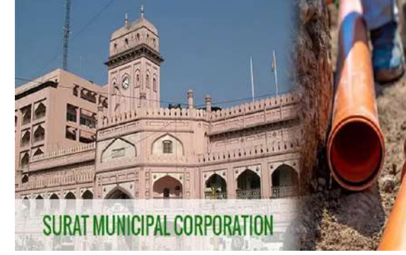
ચોક પાસે, મોટા વરાછા સુએઝ પંખીંગ સ્ટેશનની ચોવીસ કલાક કાર્યરત એવી ૬૦ મોટાવરાછા-અણામા વિસ્તારનું ડ્રેનેજ એકત્રિત કરી ઉત્તર સુએઝ પંખીંગ સ્ટેશન કેમ્પેટ એરીયામાં લેવામાં આવતી મેઈન લાઇન ૦ મી.મી. વ્યાસની રાઈઝિંગ મેઈન લાઈન મહત્વની છે તેમાં ડ્રેનેજ થતાં સુએઝ પંખીંગ સ્ટેશન બંધ કરવા માટેની ફરજ પડી હતી. આ લાઈન ઉમેજ થતાં અનેક મુશ્કેલી પડી હતી અને લોકોના આરોગ્ય સામે પણ ખતરો ઉભો થયો હતો. લોકોના આરોગ્યની જાળવણી માટે પાલિકાએ આ મેઈન લાઈનની કામગીરી તાત્કાલિક પૂરી કરી પૂર્વવત કરી દેવામાં આવી હતી. એજન્સીએ બે લાખ રૂપિયાનો દંડ પાલિકામાં જમા કરાવ્યો હતો.

। પ્રતિનિધિ, સુરત, તા.૫ । સુરત પાલિકાના વરાછા ઝોનમાં સુદામા ચોક ખાતે ખાનગી કોન્ટ્રાક્ટર દ્વારા કામગીરી દરમિયાન પાલિકાની ડ્રેનેજ લાઇનમાં ભંગાણ પડ્યું હતું. આ મુખ્ય લાઇન હતી અને તેમાં ભંગાણ પડતા લાઇન બંધ કરવાની ફરજ પડી હતી. પાલિકા લાઇનમાં ભંગાણ બદલ એજન્સીને નોટિસ ફટકારવામાં આવી હતી. ત્યાર બાદ પોલીસ કેસ કરવા માટે પણ કવાયત શરૂ કરવામાં આવી હતી. આ સાથે એજન્સી પાસે પાલિકાને થયેલી નુકસાની બદલ બે લાખ રૂપિયાનો દંડ વસુલ કરવામાં આવ્યો છે. સુરત પાલિકાના કંટારગામ ઝોન વિસ્તારમાં મોટા વરાછા વિસ્તારમાં ઓરેજન્સ બીસ્ટ. પ્રા.લિ. દ્વારા એચ.ડી લાઇન ૦ મી.મી. વ્યાસની રાઈઝિંગ મેઈન કરવામાં આવતી હતી. આ કામગીરી દરમિયાન ડિસેમ્બર ૨૦૨૪ માં સુદામા