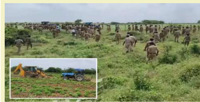
આ કાર્યવાહીમાં પશ્ચિમ કચ્છ, પૂર્વ કચ્છ, અને કચ્છ વિસ્તારના વન વિભાગના કુલ ૧૫૦ થી વધુ કર્મચારીઓ જોડાયા હતા. આ ઉપરાંત, પશ્ચિમ કચ્છ પોલીસના ૧૩૫ થી વધુ પોલીસ જવાનો પણ આ દબાણો દૂર કરવાની કાર્યવાહીમાં સામેલ થયા હતા. આ રીતે મોટા પાયે સંયુક્ત ઓપરેશન હાથ ધરીને ગેરકાયદેસર દબાણો પર જેસીબી મશીન અને ટ્રેક્ટરો ફેરવી દેવામાં આવ્યા હતા. આ કાર્યવાહીથી તંત્ર દ્વારા સ્પષ્ટ સંદેશો આપવામાં આવ્યો છે કે સરકારી જમીનો પર કોઈપણ પ્રકારનું ગેરકાયદેસર દબાણ ચલાવી લેવામાં આવશે નહીં અને તંત્ર દ્વારા આવા

કચ્છના અબડાસા તાલુકામાં સરકારી જમીન પરના દબાણો હટાવવા માટે તંત્ર દ્વારા મોટી કાર્યવાહી હાથ ધરવામાં આવી છે. આ કાર્યવાહીમાં કુષાઠીયા અને ભાચુંડા ગામોની સીમમાં વન વિભાગની આશરે ૩૫૦ હેક્ટર જેટલી જમીન પર થયેલા દબાણો દૂર કરવામાં આવ્યા છે. વન વિભાગની કુલ ૬૯૮ હેક્ટર જમીન પૈકી, ૩૫૦ હેક્ટર જમીન પર કેટલાક સ્થાનિક લોકો દ્વારા ગેરકાયદેસર રીતે વાવણી કરીને દબાણ કરવામાં આવ્યું હતું, જે કુલ ૮૬૪ એકર જેટલી જમીન થાય છે. આ દબાણ દૂર કરવા માટે વન વિભાગ અને પોલીસ વિભાગ દ્વારા યુસ્ત બંદોબસ્ત ગોઠવવામાં આવ્યો હતો.