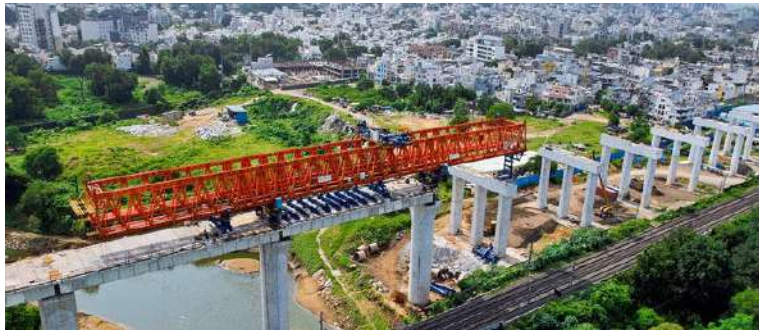
કુલ ૨૫ નદીના બ્રિજ છે, જેમાંથી ૨૧ બ્રિજ ગુજરાતમાં અને ૪ મહારાષ્ટ્રમાં છે. જેમાં ૨૧ નદીના બ્રિજમાંથી ૧૭ બ્રિજનું નિર્માણ થઈ ચૂક્યું છે. જેમાં પાર (વલસાડ જિલ્લો), પુર્ણા (નવસારી જિલ્લો), મીઠોળા (નવસારી જિલ્લો), અંબિકા (નવસારી જિલ્લો), ઐરંગ (વલસાડ જિલ્લો), વેંગણિયા (નવસારી જિલ્લો), મોહર (બેડા

વિસ્તારમાં અને આસપાસમાં ૯ અલગ અલગ સ્થળોએ પસાર થાય છે. મુખ્ય નદીના પુલ ઉપરાંત, બાકી આવેલા ૮ કોસિંગમાંથી ૩ કોસિંગ પહેલેથી જ પૂર્ણ થઈ ચુક્યાં છે અને અન્ય સ્થળોએ તાત્કાલિક નિર્માણ કાર્ય ચાલુ છે. બ્રિજની મુખ્ય એ છે કે, તેમાં ૨૬ થી ૨૮.૫ મીટર ઊંચાઈના અને ૫.૫ મીટર ગોળાકાર વ્યાસના ૪૦ મીટરના બે સ્પાન છે, જે જમ્બુ (સ્પાન બાય સ્પાન) પદ્ધતિનો ઉપયોગ કરીને બનાવવામાં આવ્યા છે. દરેક થાંભલા પર ૧.૮ મીટર વ્યાસ અને ૫૩ મીટરની લંબાઈવાળા ૧૨ પાઈલ્સ મૂકવામાં આવ્યા છે. એમએચએસઆર કોર્પોરેશન