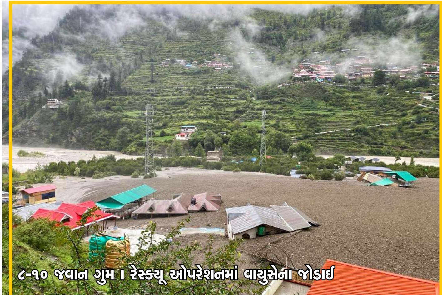
૮-૧૦ જવાન ગુમ । રેસ્ક્યુ ઓપરેશનમાં વાયુસેના જોડાઈ