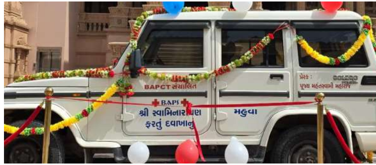
પહોંચાય છે. BAPS સ્વામિનારાયણ સંસ્થા દ્વારા વિવિધ પ્રવૃત્તિઓનું આયોજન થાય છે, જેમાં BAPS ચેરિટીઝની વિશેષતા છે. આ સંસ્થા પાંચ ખંડોના નવ દેશોમાં કાર્યરત છે. BAPS ચેરિટીઝનો મુખ્ય ઉદ્દેશ આરોગ્ય જાગૃતિ, શૈક્ષણિક સેવાઓ, માનવતાવાદી રાહત, પર્યાવરણીય સંરક્ષણ અને જાળવણી તેમજ સમુદાય સશક્તિકરણ દ્વારા નિઃસ્વાર્થ

અને 'મમતા યોજના' જેવી અનેક યોજનાઓ મારફતે લોકોને આરોગ્ય સેવાઓ પૂરી પાડી રહી છે. મહુવા બીએપીએસ સ્વામિનારાયણ મંદિર દ્વારા તથા બીએપીએસ ચેરિટીઝ સંચાલિત મેડિકલ મોબાઇલ વાન અપ ષ કરવામાં આવી છે. જેમાં હવે મહુવા તથા તેની આસપાસના ૯૦ જેટલા ગ્રામ્ય વિસ્તારમાં સામાન્ય જન પરિવારને આ આરોગ્યની સુલભ સેવા નિઃશુલ્ક રીતે પ્રાપ્ત થનાર છે જેમાં નિષ્ણાંત ડોક્ટર તથા તેમના સહાયકો દ્વારા રોગોની તપાસ તથા દવા પૂણ નિઃશુલ્ક આપવામાં આવશે. મોબાઇલ મેડિકલ ક્લિનિક અનેક વ્યક્તિઓ અને પરિવારોને ગુણવત્તાયુક્ત પ્રાથમિક સારવાર