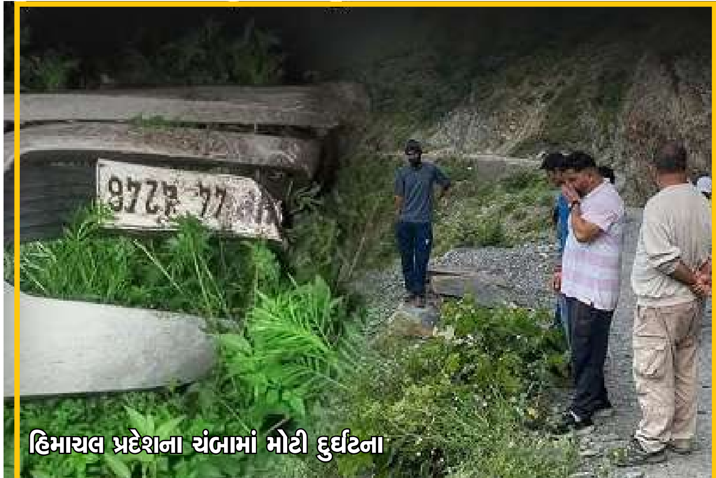
હિમાચલ પ્રદેશના ચંબામાં મોટી દુર્ઘટના