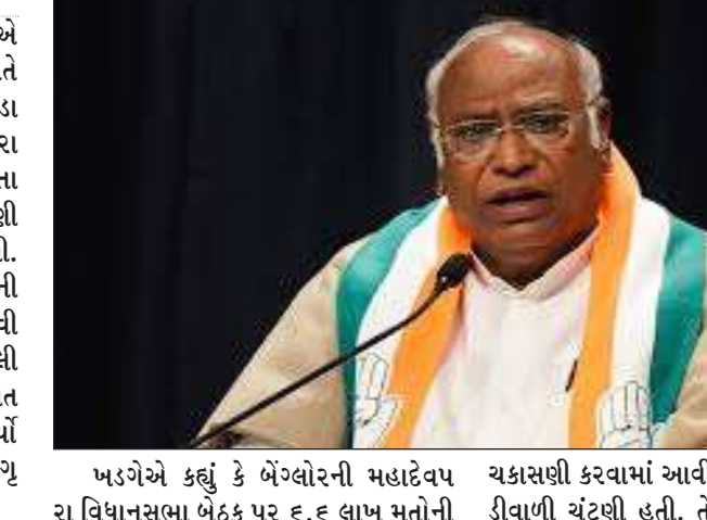
ખડગેએ કહ્યું કે ભેંગલોરની મહાદેવપુરા વિધાનસભા બેઠક પર દ. દ લાખ મતોની ચકાસણી કરવામાં આવી છે અને તે છત્તરણિ ડીવાળી ચૂંટણી હતી. તેમનો આરોપ છે કે

૧ બેંગલુરુ, તા.૮ । કોંગ્રેસ પ્રમુખ મલ્લિકાર્જુન ખડગેએ શુક્રવારે ભેંગલોરના ફ્રીડમ પાર્ક ખાતે આયોજિત વોટ અધિકાર રેલીમાં વડા પ્રધાન નરેન્દ્ર મોદી અને ભાજપ પર આકરા પ્રહારો કર્યા. મત ચોરીનો આરોપ લગાવતા તેમણે કહ્યું કે ૨૦૧૯ ની લોકસભા ચૂંટણી પણ નકલી મતોના કારણે હારી ગઈ હતી. ખડગેએ કહ્યું કે મોદી સરકાર ચોરીની સરકાર છે. તે નકલી મતોથી દેશને રડાવી રહી છે. મેં ૨૦૧૯ માં કહ્યું હતું કે નકલી મતોના કારણે કોંગ્રેસ હારી ગઈ. હવે તે વાત સાચી સાબિત થઈ રહી છે. તેમણે ઠાવો કર્યો હતો કે ચૂંટણી પંચ પીએમ મોદી અને ગૃહમંત્રી અમિત શાહના ઈશારે કામ કરે છે.