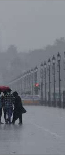
પૂરને કારણે રાજ્યમાં અરાજકતા છે અને ૨૨ જિલ્લાઓમાં સ્થિતિ ખૂબ જ ખરાબ

દિલ્હી-એનસીઆરના ઘણા ભાગોમાં વરસાદને કારણે એઈમ્સ નજીક ટ્રાફિક ઠપ થઈ ગયો છે. રાજધાનીમાં ભારે વરસાદ પછી ભારાપુલ્લા પુલ પાસે વાહનોની ધીમી ગતિ અને જામ જોવા મળ્યો. મુશળધાર વરસાદ પછી દિલ્હીના ઘણા વિસ્તારોમાં પાણી ભરાયા છે. રક્ષાબંધન પર દિલ્હી એનસીઆરમાં ભારે વરસાદ શહેરના ઘણા ભાગોમાં પાણી ભરાયા છે હવામાન નિષ્ણાતો કહે છે કે ૧૧-૧૨ ઓગસ્ટ, ૨૦૨૫ ના રોજ ઉત્તર પશ્ચિમ બંગાળની ખાડીમાં ચક્રવાતી પરિભ્રમણ બનવાની સંભાવના છે, જે આગામી ૨૪ કલાકમાં મજબૂત બનશે અને દેશના આંતરિક ભાગમાં જશે. આ ચોમાસાના પ્રવાહને દક્ષિણ તરફ ખસેડશે, જેનાથી ચોમાસાની સ્થિતિનો અંત આવશે અને દિલ્હી-એનસીઆરમાં વરસાદ થશે. શનિવારે સવારે તાપમાન ૨૩.૮ ડિગ્રી સેલ્સિયસ નોંધાયું હતું, જે સરેરાશ કરતા ૩.૨ ડિગ્રી ઓછું હતું.