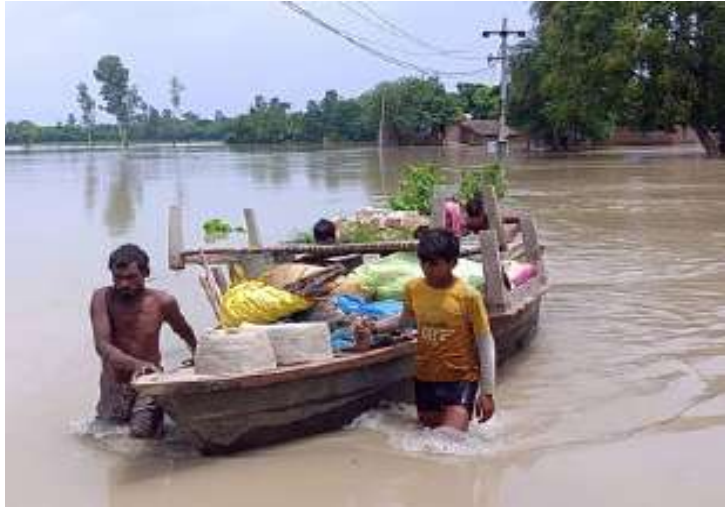
દિલ્હી-એનસીઆરના ઘણા ભાગોમાં વરસાદને કારણે એઈમ્સ નજીક ટ્રાફિક

નવીદિલ્હી, તા.૯ । રાત્રિભરમાં રાષ્ટ્રીય રાજધાની સહિત એનસીઆરમાં ભારે વરસાદ પડ્યો. આને કારણે રક્ષાબંધનની સવારે ઘણા વિસ્તારો પાણી ભરાઈ ગયા હતા. હવામાન વિભાગે દિવસ દરમિયાન વધુ વરસાદની આગાહી કરી છે. શનિવારે સવારે, ભારતીય હવામાન વિભાગે ઉત્તર, પશ્ચિમ, દક્ષિણ, દક્ષિણ-પૂર્વ અને મધ્ય દિલ્હીના કેટલાક ભાગોમાં વીજળી અને ગાજવીજ સાથે ભારે વરસાદનું રેડ એલર્ટ જારી કર્યું હતું, પરંતુ બાદમાં તેને પીળા એલર્ટમાં ઘટાડી દીધું હતું. હવામાન વિભાગે લોકોને સતર્ક રહેવાની સલાહ આપી છે. હવામાન વિભાગ દ્વારા શેર કરાયેલા ડેટા અનુસાર, શનિવારે સવારે ૮.૩૦ વાગ્યા સુધી, દિલ્હીના પ્રાથમિક હવામાન મથક સફદરજંગમાં ૭૮.૭ મીમી, પ્રગતિ મેદાનમાં ૧૦૦ મીમી, લોધી રોડ પર ૮૦ મીમી, પુસામાં ૬૮ મીમી અને પાલમમાં ૩૧.૮ મીમી વરસાદ નોંધાયો હતો. શુક્રવારે રાત્રે ૧૧ વાગ્યે શરૂ થયેલા વરસાદથી લોકોને ગરમીથી રાહત મળી. આ દરમિયાન, દિલ્હી-દ્રજીઠ ના ઘણા ભાગોમાં ભારે વરસાદ પડ્યો. પંચકુઈયા માર્ગ, મથુરા રોડ, શાસ્ત્રી ભવન, આરકે પુરમ, મોતી બાગ, ડિલ્હી-વૉર્થ નગર અને અન્ય ઘણા વિસ્તારોમાં વરસાદને કારણે ભારે પાણી ભરાયા.