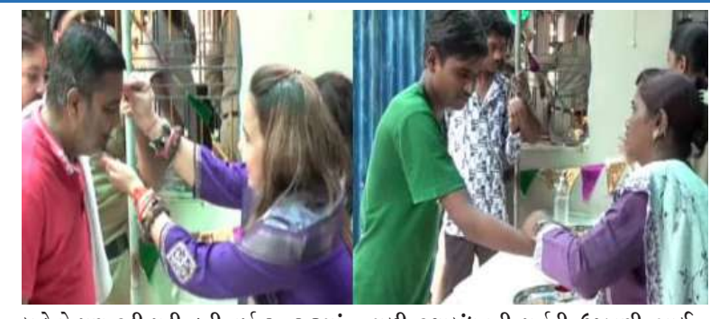
બહેનો પણ રડી પડી હતી. વર્ષ ૨૦૨૩માં સુરતની લાજપોર મધ્યસ્થ જેલ દ્વારા સરકાર પાસેથી વિશેષ પરવાનગી મેળવી પ્રથમ વખત જેલમાં બંધ કેદીઓને રૂબરૂમાં મળી રક્ષાબંધનની પર્વની ઉજવણી ભાઈ બહેન કરી શકે તે પ્રકારનું આયોજન ગોઠવ્યું હતું. એવા જ પ્રકારનું આયોજન આ વર્ષ પણ કરવામાં આવ્યું હતું. જેમાં કાચા-પાકા

। પ્રતિનિધિ, અમદાવાદ, તા.૯ । ભાઈ-બહેનના પવિત્ર તહેવાર એવા રક્ષાબંધનનું હિંદુ ધર્મમાં ખાસ મહત્ત્વ રહેલું છે. આ તહેવાર ભાઈ-બહેનોના પ્રેમનું પ્રતિક છે. ત્યારે આજે (૯મી ઓગસ્ટ) રક્ષાબંધન પર્વની ઉત્સાહભરે ઉજવણી થઈ હતી. તો બીજી તરફ અમદાવાદની સાબરમતી મધ્યસ્થ જેલ, સુરત લાજપોર મધ્યસ્થ જેલ, રાજકોટ મધ્યસ્થ જેલ અને વડોદરા મધ્યસ્થ જેલમાં ભાઈ બેનના પવિત્ર તહેવારની ઉજવણી કરવામાં આવી હતી. આ દરમિયાન બહેનોએ કેદીઓને રાખડી બાંધીને જેલોમાં ભાવુક દ્રશ્યો જોવા મળ્યા હતા. અમદાવાદની સાબરમતી