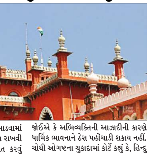
કે, ધાર્મિક ચિત્રોને કેવી રીતે દેખાડવામાં આવી શકે છે, એમાં સંવેદનશીલતા રાખવી જોઈએ. સરકારે એ પણ સુનિશ્ચિત કરવું

ચેન્નઈ, તા.૯ । હિન્દુ દેવતાઓના અપમાન સંબંધિત કેસ મામલે મદ્રાસ હાઈકોર્ટે તમિલનાડુ પોલીસની ઝાટકણી કાઢી છે. હાઈકોર્ટે કહ્યું છે કે હિન્દુ દેવી-દેવતાઓને અપમાનજનક રીતે રજૂ કરવા દ્વારા (બહાવલપુર - જેશ-એ-મોહમ્મદના મુખ્યાલય પર) થયેલા નુકસાન પહેલા અને પછીના ચિત્રો છે. અહીં લગભગ કોઈ અવશેષો બાકી નથી. આસપાસની ઈમારતો લગભગ સંપૂર્ણપણે સુરક્ષિત છે. અમારી પાસે ફક્ત સેટેલાઈટ છબીઓ જ નહીં, પરંતુ સ્થાનિક મીડિયામાંથી પ્રાપ્ત ચિત્રો પણ હતા, જેના દ્વારા અમે અંદરના ચિત્રો મેળવી શકીએ છીએ.