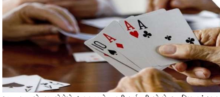
ગયા હતા એ જ લોકોએ ધારાસભ્યને ખોટી માહિતી આપી હતી, જેથી પોલીસની વાત કરી ધારાસભ્યને ગેરમાર્ગે દોર્યા છે," એમ પીએસઆઈએ કહ્યું હતું. ધારાસભ્યના રહી કાર્યવાહી કરે છે. આ કિસ્સામાં ફરાર જુગારીઓએ વાસ્તવિકતા કરતાં વિપરીત વાત કરી ધારાસભ્યને ગેરમાર્ગે દોર્યા છે," એમ પીએસઆઈએ કહ્યું હતું. ધારાસભ્યના

ખાનગી રીતે જુગારની ક્લબો ચાલી રહી છે અને પોલીસ નાના માણસો પર ખોટા કેસ કરી માત્ર આંકડા બતાવતી રહે છે. આ સમગ્ર મામલે બાટવાના પીએસઆઈ આર. એમ. વાળાએ સ્પષ્ટતા કરતા જણાવ્યું હતું કે, ધારાસભ્યના આક્ષેપો પાયા વિહોણા છે. તેમણે કહ્યું કે, બાટવા શહેરના યુનારાવાડ વિસ્તારમાં ગઈકાલે જ પોલીસ દ્વારા રેડ પ ડાવામાં આવી હતી, જ્યાં અંદાજે ૧૫ જેટલા જુગારીઓ પાત્ર રમતા હતા. રેડની ખબર પડતા મોટા ભાગના જુગારીઓ ભાગી છૂટ્યા હતા, જેમાંથી માત્ર ત્રણથી ચાર વ્યક્તિઓ પકડાઈ હતી. પીએસઆઈના જણાવ્યા મુજબ, જે જુગારીઓ પોલીસની કાર્યવાહીથી બચી