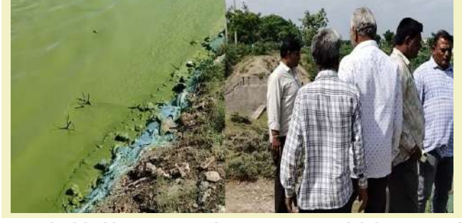
આથી, સ્થાનિક લોકોએ સમગ્ર મામલે ઊંડાણપૂર્વક તપાસ કરીને દોષિતો સામે કડક કાર્યવાહી કરવા માટે માંગ કરી છે. હાલમાં પાણીમાં નાખવામાં આવેલો પદાર્થ કેમિકલ છે કે કેમ, તે સ્પષ્ટ થયું નથી. પાણીના સેમ્પલનો રિપોર્ટ આવ્યા બાદ જ આ અંગેનો

1 પ્રતિનિધિ, અમરેલી, તા.૯ | અમરેલી રોડ પર આવેલા મોટા લીલિયાના પ્રખ્યાત નિલકંઠ સરોવરમાં કોઈ અજાણ્યા પદાર્થ ઠાલવવામાં આવ્યો હોવાની આશંકા સેવાઈ રહી છે, જેના કારણે સરોવરનું પાણી લીલું થઈ ગયું છે. આ ઘટનાને પ ગલે સ્થાનિક લોકો અને તંત્રમાં ચિંતાનું મોજું ફરી વળ્યું છે. સ્થાનિકોના જણાવ્યા અનુસાર, નિલકંઠ સરોવરના પાણીનો રંગ અચાનક બદલાઈને લીલો થઈ ગયો હતો. આ બાબતની જાણ થતાં લીલિયાના સરપંચ દ્વારા તાત્કાલિક મામલતદાર સહિતના વહીવટી તંત્રને જાણ કરવામાં આવી હતી. ઘટનાની ગંભીરતાને ધ્યાનમાં રાખીને તંત્ર દ્વારા સરોવરના પાણીના સેમ્પલ લેવામાં