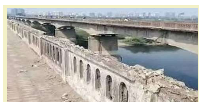
પીરાણા સુધીનો બ્રિજ ૮ ફેબ્રુઆરી ૨૦૨૬ સુધી બંધ રહેશે. જર્જરિત હાલતમાં રહેલા વિશાલા બ્રિજનું આ વર્ષની શરૂઆતમાં સમારકામ અને નવીનીકરણ કરવામાં આવ્યું હતું. જોકે, બ્રિજના બેરિંગ્સ અને પેડેસ્ટલ હજુ પણ જર્જરિત હાલતમાં છે. પોલીસ વિભાગે આ અંગે એક જાહેરનામું બહાર પાડ્યું છે અને વૈકલ્પિક માર્ગોની જાહેરાત કરી છે. વિશાલાથી નારોલ સુધીનો ૪૩ વર્ષ જૂનો બ્રિજ એક્સપ્રેસ અને રાષ્ટ્રીય ધોરીમાર્ગ ૮ ને જોડે છે. આ બ્રિજના બદલે નવો બ્રિજ અને નારોલથી સરખેજ સુધીના એલિવેટેડ કોરિડોર માટે ટેન્ડર જાહેર કરવામાં આવ્યું છે. આ પ્રસ્તાવિત કોરિડોર ૮-લેનનો બનશે. જેની માટે ૧,૨૯૫ કરોડનો ખર્ચ થવાનો અંદાજ છે. અમદાવાદ શહેરના વિશાલા બ્રિજ પરથી ભારે વાહનોની અવરજવર પર પ્રતિબંધ મૂકવામાં આવ્યો છે. શહેરના પોલીસ કમિશનરે જાહેરનામું પ્રસિદ્ધ કરીને આ નિર્દેશ આપ્યો છે. જેમાં બ્રિજના ડાબા ભાગના બેરિંગ અને અન્ય ભાગો જર્જરિત સ્થિતિમાં હોવાને કારણે આ નિર્ણય લેવામાં આવ્યો છે. જેમાં એસ.ટી. બસ પણ આ બ્રિજના ડાબા ભાગ પરથી પસાર નહી થઈ શકે. જેથી લોકોને હાલાકીનો સામનો કરવો પડશે. અમદાવાદ શહેરના વિશાલા બ્રિજ પરથી ભારે વાહનોની અવરજવર પર પ્રતિબંધ મૂકવામાં આવ્યો છે.

। પ્રતિનિધિ, અમદાવાદ, તા.૧૧ । અમદાવાદ શહેરના વિશાલા બ્રિજ પરથી ભારે વાહનોની અવરજવર પર પ્રતિબંધ મૂકવામાં આવ્યો છે. શહેરના પોલીસ કમિશનરે જાહેરનામું પ્રસિદ્ધ કરીને આ નિર્દેશ આપ્યો છે. જેમાં બ્રિજના ડાબા ભાગના બેરિંગ અને અન્ય ભાગો જર્જરિત સ્થિતિમાં હોવાને કારણે આ નિર્ણય લેવામાં આવ્યો છે. જેમાં એસ.ટી. બસ પણ આ બ્રિજના ડાબા ભાગ પરથી પસાર નહી થઈ શકે. જેથી લોકોને હાલાકીનો સામનો કરવો પડશે. આ અંગે નેશનલ હાઈવે ઓથોરિટી અમદાવાદ દ્વારા જાહેરાત કરવામાં આવી છે કે શુક્રવારથી શાસ્ત્રી બ્રિજના ડાબી બાજુથી મધ્યમ અને ભારે મુસાફર અને કોમર્શિયલ વાહનો માટે બંધ રહેશે. વિશાલા સર્કલથી