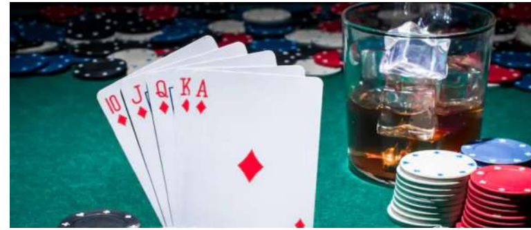
અને તેમની ટીમે મહત્વની ભૂમિકા ભજવી હતી. ભાતમીના આધારે ઝડપી કાર્યવાહી કરીને પોલીસે આરોપીઓને રંગે હાથ ઝડપી લીધા. ઝડપાયેલા ૧૩ આરોપીઓ

સ્થળેથી રૂ. ૧૨,૦૦૦નો મુદામાલ, જેમાં રોકડ અને જુગારના સાધનોનો સમાવેશ થાય છે, જપ્ત કર્યો હતો. આ ઓપરેશન દરમિયાન પોલીસે ઝડપી કાર્યવાહી કરીને આરોપીઓને કસ્ટડીમાં લીધા. બોરડીગેટ ઉપરાંત, ખેડૂતવાસ વિસ્તારમાં પણ પોલીસે બીજા દરોડો પાડ્યો હતો. અહીંથી ૪ પુરુષ અને ૩ મહિલા જુગાર રમતા ઝડપાયા હતા. આ સ્થળેથી રૂ. ૧૧,૦૦૦નો મુદામાલ જપ્ત કરવામાં આવ્યો. પોલીસે આ બંને સ્થળોએથી જુગારની પ્રવૃત્તિનો ભંગ કરીને ગેરકાયદેસર પ્રવૃત્તિઓ પર અંકુશ લગાવવાનો પ્રયાસ કર્યો છે. આ બંને દરોડામાં પીએસઆઈ મનીષ મકવાણા