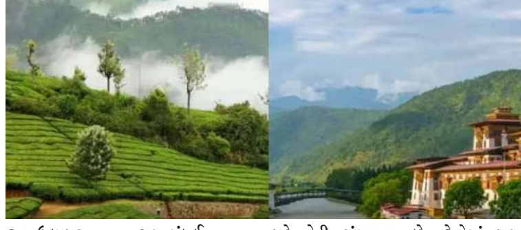
ઉદયપુર ૧૦૨, ગોવા ૨૧, સુંબઈ રિઝોર્ટ ૨૧, મુસાફરોના ધસારાને પગલે દ્રારકા સોમનાથ જવા માટે વધારાની બસ દોડાવવી પડે તેવી સંભાવના છે. ટ્રેનોમાં પણ અમદાવાદથી સોમનાથ જવા માટે વેરાવળ સુધી જવા માટેની ટ્રેનમાં વેઈટિંગ ૧૫૦ જેટલું છે. આ સિવાય દ્રારકા માટે ૬૪,

। પ્રતિનિધિ, અમદાવાદ, તા.૧૨ । આગામી ૧૫ ઓગસ્ટ સ્વાતંત્ર્ય દિવસ, ૧૬ ઓગસ્ટ જન્માષ્ટમી અને ત્યારબાદ રવિવાર એમ ૩ દિવસ રજાને પગલે બહાર ફરવા જવા માટેનો ધસારો વધ્યો છે. અમદાવાદથી સોમનાથ જવા માટેની ટ્રેનનું વેઈટિંગ ૧૫૦ જેટલું થઈ ગયું છે, જ્યારે દ્રારકા માટે એસટીની ૧૬માંથી ૧૩ બસ પેક થઈ ગઈ છે. બીજી બાજુ અમદાવાદથી સોમનાથ અને જયપુર જવા માટેના એરફેર ૧૮ હજાર સુધી પહોંચી ગયા છે. આ સિવાય પ્રાઈવેટ એકમાં પણ સામાન્ય દિવસો કરતાં ભાડામાં વધારો કરી દેવાયો છે. મળતી માહિતી મુજબ, ઢાલ ખાસ કરીને સોમનાથ, દ્રારકા જવા માટે સૌથી વધુ ધસારો છે. અમદાવાદથી દ્રારકા માટેની એસટી બસ પેક થઈ ગઈ છે. એસટી બસોમાં ટિકિટ નહીં મળતાં દ્રારકા જવા માગતા આ તકનો લાભ લઈને ખાનગી બસોએ પણ ભાડામાં સામાન્ય દિવસો કરતાં વધારો કરી દીધો છે. અમદાવાદથી દ્રારકા માટેનું ખાનગી બસનું ભાડું ૧૬૦૦ જેટલું થઈ ગયું છે. અમદાવાદથી સોમનાથ માટે પણ આવી જ સ્થિતિ છે. ૧૪ ઓગસ્ટે અમદાવાદથી સોમનાથ જતી ૧૪માંથી ૧૨ બસ પેક થઈ ગઈ છે. સ્થળ વેઈટિંગ દ્રારકા ૭૪, સોમનાથ ૧૪૮, જૂનાગઢ ૨૧, સુંબઈ રિઝોર્ટ, આબુ