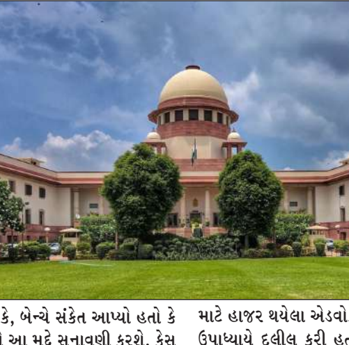
આવ્યો છે. જોકે, બેન્ચે સંકેત આપ્યો હતો કે તે અન્ય દિવસે આ મુદ્દો સુનાવણી કરશે. કેસ માટે હાજર થયેલા એડવોકેટ અચિની કુમારે ઉપાધ્યાયે દલીલ કરી હતી કે, જે વ્યક્તિને

૧૩ નવી દિલ્હી, તા. ૧૩ | કોઈ વ્યક્તિને દોષિત ઠેરવવામાં આવ્યો હોય તે તેનો અર્થ એ નથી કે તેને રાજકીય પક્ષ બનાવવાની રોકી શકાય છે. સુપ્રીમ કોર્ટે એક કેસમાં ટિપ્પણી કરતા કહ્યું હતું કે, જો કોઈ વ્યક્તિને વૈધાનિક અધિકારોથી વંચિત રાખવામાં આવ્યો હોય તો તેનો મતલબ એ નથી કે તેના બંધારણીય અધિકારો પણ ઈનીવેલી લેવા જોઈએ. ૨૦૧૭માં દાખલ એક પીઆઈએલમાં દોષિત ગુનેગારોને રાજકીય પક્ષો બનાવવા અને ટિકિટ વહેંચવાથી અટકાવવામાં આવે તેવી માંગ કરવામાં આવી હતી. જસ્ટિસ સુર્યકાંત અને જસ્ટિસ જોયમાલ્યા બાગચીની બેન્ચે કહ્યું હતું કે, પીઆઈએલમાં રસપદ મુદ્દો ઉઠાવવામાં