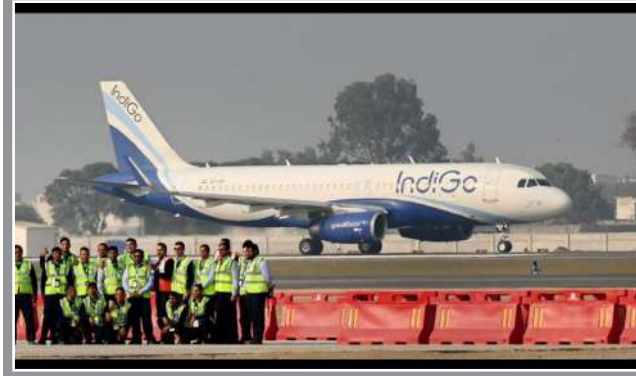
નોટિસ આપી છે. આ નોટિસ એટલા માટે આપવામાં આવી છે, કારણ કે ઈન્ડિગો એરલાઈન્સ દ્વારા લગભગ ૧૭૦૦ પાયલટોની ટ્રેઈનિંગમાં ક્ષિત રીતે કેટલીક ચૂક થઈ છે, તેમ સૂત્રોએ મંગળવારે જણાવ્યું હતું. સૂત્રોના જણાવ્યા મુજબ, આ નોટિસ તાજેતરના મહિનાઓમાં એરલાઈન્સ પાસેથી મળેલા દસ્તાવેજો અને જવાબોની તપાસ પછી આપવામાં આવી છે. ડીજીસીએને જણાવા મળ્યું કે લગભગ ૧૭૦૦ પાયલટોને ‘સી’ શ્રેણી કે મહત્વપૂર્ણ એરપોર્ટોની ટ્રેઈનિંગ એવા સિમ્યુલેટર પર આપવામાં આવી, જે પ્રમાણિત હતા નહીં. એમાં મુખ્ય પાયલટ અને સહાયક પાયલટ સામેલ છે. એટલે ટ્રેઈનિંગ માટે ઉપયોગમાં લેવાયેલા ઉપકરણ નક્કી કરાયેલા સ્ટાન્ડર્ડ પ્રમાણેના હતા નહીં.

સુરક્ષા વ્યવસ્થાની જરૂરિયાત હોય તરફ, ઈન્ડિગોના પ્રવક્તાએ કહ્યું કે અમને કેટલાક પાયલટોની સિમ્યુલેટર ટ્રેઈનિંગ સંબંધિત ડીજીસીએની કારણદર્શક નોટિસ મળી છે. ડાયરેક્ટોરેટ જનરલ ઓફ સિવિલ એવિએશન(ડીજીસીએ)એ ઈન્ડિગો એરલાઈન્સને કારણે નોટિસ આપી છે.