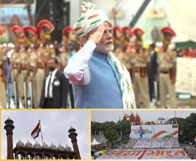
1 નવીદિલ્હી, તા. ૧૪ ।

વડા પ્રધાન પ્રતિષ્ઠિત સ્મારકના પ્રાગટ્ય પરથી રાષ્ટ્રવજ ફરકાવશે અને સમગ્ર રાષ્ટ્રને સંબોધિત કરશે । વર્ષના સ્વતંત્રતા દિવસની ઉજવણીની થીમ “નવું ભારત” છે