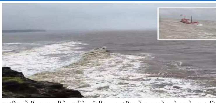
માછીમારોની સલામતીને લઈને ગંભીર સવાલો ઊભા કર્યા છે. જાફરાબાદની બોટો ડૂબ્યાની જાણ થતાં જ અમરેલી જિલ્લા અને અન્ય જહાજોની મદદ લેવામાં આવી

તૂટી જતાં માછીમાર પરિવારોમાં ચિંતાનું મોજું ફેરી વળ્યું છે. નોંધનીય છે કે, આ ઘટના એક દિવસ પહેલાં બનેલી બીજી એક ઘટના બાદ સામે આવી છે. થોડા દિવસો પહેલાં જાફરાબાદની બે અને રાજપરા ગામની એક બોટ દરિયામાં જળસમાપ્તિ થઈ ગઈ હતી. તે ઘટનામાં સવાર ૧૧ માછીમારો હજુ પણ લાપતા છે. જાફરાબાદની બે બોટ અને ગીર સોમનાથના રાજપરાની એક બોટમાં ૨૮ માછીમારો હતા. જેમાંથી ૧૭ માછીમારોનું રેસ્ક્યુ કરવામાં આવ્યું છે, જ્યારે ૧૧ માછીમારોનો હજુ આજે પણ કોઈ પત્તો લાગ્યો નહોતો. આ ઉપરાંત પરી કલેક્ટર, ધારાસભ્ય અને અધિકારીઓએ