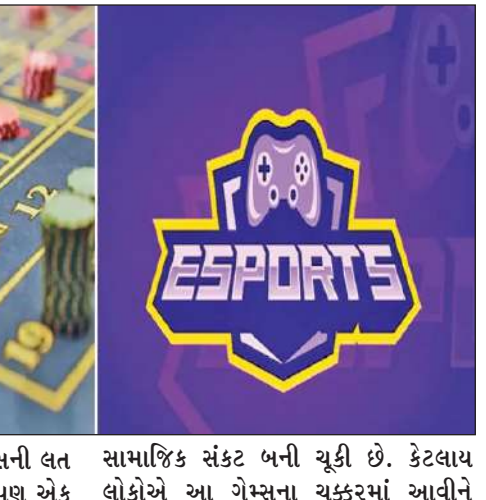
ગેમિંગ બિલ ૨૦૨૫ છે. આ ગેમ્સની લત ફક્ત નાણાકીય નુકસાન જ નહીં પણ એક સામાજિક સંકટ બની ચૂકી છે. કેટલાય લોકોએ આ ગેમ્સના ચક્કરમાં આવીને

। નવી દિલ્હી, તા. ૨૧ । કેન્દ્ર સરકારે ઓનલાઇન ગેમિંગને નિયંત્રિત કરતું મહત્વનું બિલ લોકસભામાં પસાર કરી દીધું છે. તેનો હેતુ ઓનલાઇન મની ગેમ્સ અને સહાધારીને સંપૂર્ણપણે રોકવાનો છે અને ઈ-સ્પોર્ટ્સ તેમજ સાંશયિક ગેમ્સને પ્રોત્સાહન આપવાનો છે. એક અંદાજ મુજબ દર વર્ષે ૪૫ કરોડ લોકો આ ઓનલાઇન મની ગેમ્સના ચક્કરમાં ફસાઈને ૨૦ હજાર કરોડથી વધારે રકમ ગુમાવે છે. કેન્દ્ર સરકારે દાવો કર્યો છે કે ઓનલાઇન ગેમ્સથી લોકોને થઈ રહેલા નાણાકીય અને સામાજિક નુકસાનને રોકવા માટે તે આ બિલ લાવી છે. આ બિલનું નામ પ્રમોશન એન્ડ રેગ્યુલેશન ઓફ ઓનલાઇન