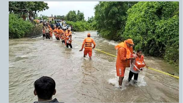
અત્યાર સુધીમાં રાજ્યમાં સરેરાશ ૭૫ ટકાથી વધુ વરસાદ નોંધાયો

ગુજરાતમાં છેલ્લા ત્રણ-ચાર દિવસથી ભારેથી અતિભારે વરસાદી માહોલ જામ્યો છે, ત્યારે હવામાન વિભાગે આગામી ૨૭ ઓગસ્ટ સુધી ભારે વરસાદને લઈને એલર્ટ જાહેર કર્યું છે. જેમાં આવતીકાલે (૨૨ ઓગસ્ટ) ૧૯ જિલ્લામાં ભારેથી અતિભારે વરસાદને લઈને ઓરેન્જ અને યલો એલર્ટ જાહેર કર્યું છે. ચાલો જાણીએ ક્યાં-કેવો રહેશે વરસાદી માહોલ. હવામાન વિભાગ મુજબ, આવતીકાલે શુક્રવારે (૨૨ ઓગસ્ટ) કચ્છ, સાબરકાંઠા, અરવલ્લી, મહીસાગર જિલ્લામાં ઓરેન્જ એલર્ટ અને બનાસકાંઠા, પાટણ, મહેસાણા, ગાંધીનગર, મોરબી, સુરેન્દ્રનગર, ખેડા, પંચમહાલ, દાહોલ, ભરૂચ, સુરત, તાપી, નવસારી, ખેડા, વલસાડ જિલ્લામાં ભારે વરસાદને લઈને યલો એલર્ટ જાહેર કર્યું છે. રાજ્યમાં આગામી ૨૩-૨૪ ઓગસ્ટ દરમિયાન ૧ થી વધુ જિલ્લામાં ઓરેન્જ-યલો એલર્ટ જાહેર કર્યું છે. જેમાં કચ્છ, પાટણ, બનાસકાંઠા, સાબરકાંઠા, મહેસાણા, ગાંધીનગર, મહેસાણા, સાબરકાંઠા, અરવલ્લી, મહીસાગર, દાહોલ, છોટા ઉદેપુર, પંચમહાલ, વડોદરા, આણંદ, નર્મદા, અમરેલી, ભાવનગર, ગીર સોમનાથ, વલસાડ, નવસારી, ડાંગ, તાપી, સુરત, ભરૂચ જિલ્લામાં ગાવવીજ સાથે ભારે વરસાદનું એલર્ટ છે.