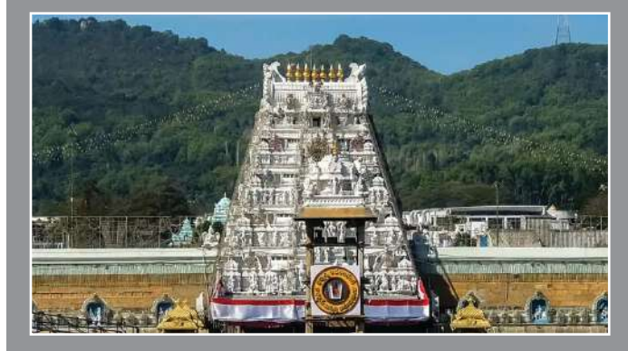
૬૦૦૦થી ૭૦૦૦ કરોડ રૂપિયાની કમાણી કરી છે.

ભક્તે પોતાની શ્રદ્ધા અનુસાર જે રીતે અટળક સંપત્તિનું દાન કર્યું છે, તેનાથી સૌ કોઈ આશ્ચર્યચકિત થઈ ગયા છે । આ માહિતી આંધ્ર પ્રદેશના મુખ્યમંત્રી ચંદ્રબાબુ નાયડુએ એક બહેર કાર્યક્રમમાં આપી હતી