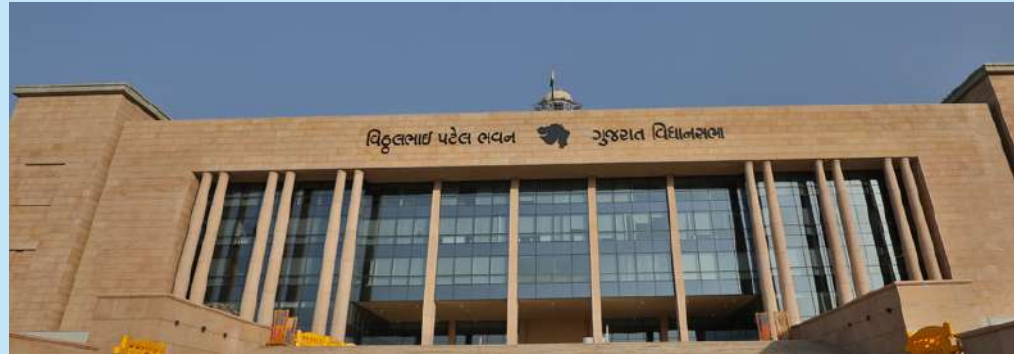
રાજકીય નિરીક્ષકો કહે છે કે ભાજપના ટોચના નેતૃત્વએ જે રીતે અન્ય રાજ્યોમાં મંત્રીમંડળમાં ફેરફારને લીલી ઝંડી આપી છે. સ્થાનિક સ્વરાજ્યની ચૂંટણીને ધ્યાનમાં રાખીને ભાજપ મંત્રીમંડળમાં નવા સમીકરણો સ્થાપિત કરી શકે છે તેવી આશા જાગી છે. ૨૦૨૨ની ચૂંટણીમાં ભાજપે ૧૮૨ બેઠકોમાંથી ૧૫૬ બેઠકો જીતી હતી, પરંતુ હવે આ સંખ્યા ૧૬૨ પર પહોંચી ગઈ છે. ભાજપના પાંચ ધારાસભ્યો વધ્યા છે. આમાંથી પાંચ કોંગ્રેસના નેતાઓ છે જે હવે ભાજપના પ્રતીક પર ફરીથી ધારાસભ્ય બન્યા છે. એવી ચર્ચા છે કે તેમાંથી બેને મંત્રી બનાવી શકાય છે.