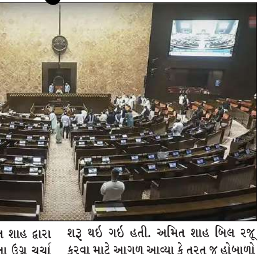
ધરાવતું બિલ ગૃહ પ્રધાન અમિત શાહ દ્વારા શરૂ થઈ ગઈ હતી. અમિત શાહ બિલ રજૂ લોકસભામાં રજૂ કરવામાં આવતા ઉગ્ર ચર્ચા કરવા માટે આગળ આવ્યા કે તરત જ હોબાળો

૧ નવી દિલ્હી, તા. ૨૨ । આજે સમાપ્ત થયેલા અને એક મહિના સુધી ચાલેલા સંસદના ચોમાસુ સત્રમાં બિહારમાં મતદાર યાદીઓની ચાલી રહેલી બાસ સઘન સુધારા (એસઆઈઆર) અંગે બંને ગૃહોમાં દરરોજ વિશેષ જોવા મળ્યો હતો. ચોમાસુ સત્રમાં વિપક્ષના હોબાળા અને વોકઆઉટ છતાં લોકસભામાં ૧૨ અને રાજ્યસભામાં ૧૫ બિલો પસાર કરવામાં આવ્યા હતાં. અમેરિકાના ધરપકડ કરાયેલા વડાપ્રધાન, મુખ્યપ્રધાનો અને પ્રધાનોને હટાવવાની જોગવાઈ