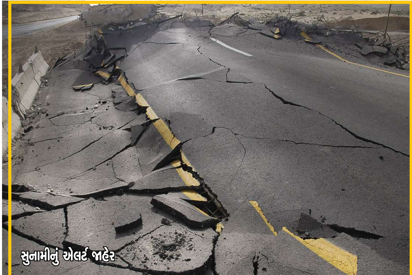
સુનામીનું એલર્ટ જાહેર