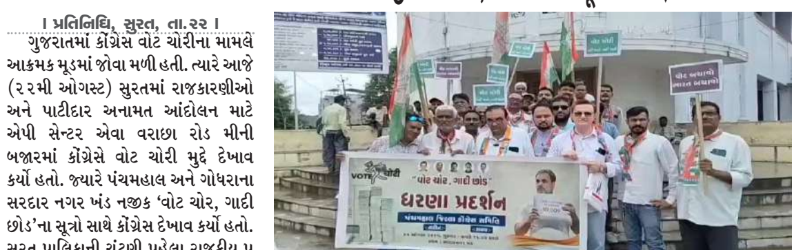
। પ્રતિનિધિ, સુરત, તા.૨૨ । ગુજરાતમાં કોંગ્રેસે વોટ ચોરીના મામલે આક્રમક મૂડમાં જોવા મળી હતી. ત્યારે આજે (૨૨મી ઓગસ્ટ) સુરતમાં રાજકારણીઓ અને પાર્ટીદાર અનામત આંદોલન માટે એપી સેન્ટર એવા વરાછા રોડ મીની બજારમાં કોંગ્રેસે વોટ ચોરી મુદ્દે દેખાવ કર્યો હતો. જ્યારે પંચમહાલ અને ગોધરાના સરદાર નગર ખંડ નજીક 'વોટ ચોર, ગાદી છોડ'ના નારા સાથે કોંગ્રેસ દેખાવ કર્યો હતો. અચાનક જ બધા પક્ષના નેતા, કોર્પોરેટરો અને કાર્યકરો સક્રિય થઈ ગયાં છે. અત્યાર સુધી બે ચાર નેતાઓને બાદ કરતા સુસ્ત કોંગ્રેસ પણ સક્રિય થઈ ગઈ છે. સુરત પલિકાની ચૂંટણી માટે કાઉન્સિલ ડાઉન થઈ રહ્યું છે, ત્યારે કોંગ્રેસ અચાનક સક્રિય થઈ ગઈ છે. કોંગ્રેસે જાહેર કરેલા 'વોટ ચોર, ગાદી છોડ'નો કાર્યક્રમ અંતર્ગત શુક્રવારે સુરતના વરાછા વિસ્તારમાં દેખાવ કર્યો હતો. કોંગ્રેસે દેખાવ કરવા માટે જે સમય આપ્યો હતો તે સમયે ધોધમાર વરસાદ પડ્યો હતો તેમ છતાં કોંગ્રેસીઓ વરસાદ વરસાદમાં દેખાવ કરતા નજરે પડ્યાં હતા. કોંગ્રેસના કાર્યકરોએ દેખાવ માટે પાર્ટીદાર અનામત આંદોલન અને ભાજપ-આપ અને કોંગ્રેસ માટે એપી સેન્ટર બનેલા મીની બજાર સરદાર પ્રતિમા પાસેના માનગઢ ચોકની પસંદગી કરવામાં આવી હતી. પંચમહાલમાં વોટ ચોરી મામલે કોંગ્રેસ દ્વારા દેખાવ કર્યો હતો. ગોધરાના સરદાર નગર ખંડ પાસે જિલ્લા કોંગ્રેસ સમિતિ દ્વારા 'વોટ ચોર, ગાદી છોડ'ના સૂત્રો સાથે દેખાવ કર્યો હતો.

સુરતમાં રાજકારણીઓ અને પાર્ટીદાર અનામત આંદોલન માટે એપી સેન્ટર એવા વરાછા રોડ મીની બજારમાં કોંગ્રેસે વોટ ચોરી મુદ્દે દેખાવ કર્યો હતો. જ્યારે પંચમહાલ અને ગોધરાના સરદાર નગર ખંડ નજીક 'વોટ ચોર, ગાદી છોડ'ના નારા સાથે કોંગ્રેસ દેખાવ કર્યો હતો