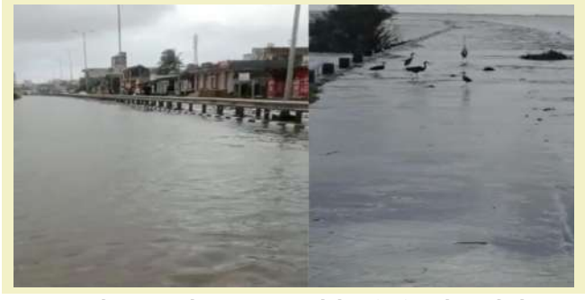
વળ્યા હતા તો કડછથી ઘેડ બગસરા જતો રસ્તો પણ વરસાદી પાણીને લીધે બંધ થઈ ગયો છે. ગરેજ, મૈયારી, ચીકાસા, નવાગામ, લુશાળા, એરડા, મીઝાળા, ભડ સહિત ઘેડના આંતરિક ગામડાઓમાં વરસાદી પાણીને લીધે જનજીવન અસ્તવ્યસ્ત બની ગયું છે. ઘેડ પંથકમાં દર વર્ષે ચોમાસા દરમિયાન લોકોની સ્થિતિ કફોડી બને છે. સાંસદ દ્વારા એવા દાવાઓ કરવામાં આવે છે કે, ઘેડ વિસ્તારમાં ભરાતા વરસાદી પાણીના કાયમી નિરાકરણ માટે ૧૫૦૦ કરોડ રૂપિયાનો પ્રોજેક્ટ પ્રગટિમાં છે, પરંતુ ગમે તેવી યોજનાઓ અને પ્રોજેક્ટ હોય તો પણ ઘેડવાસીઓની પરિસ્થિતિમાં કોઈ ફરક પડ્યો નથી

। પ્રતિનિધિ, પોરબંદર, તા.૨૨ । પોરબંદર અને ગિર સોમનાથ જિલ્લાને જોડતા ઘેડ પંથકનો આકાર રકાબી જેવો છે અને ચોમાસામાં વરસાદી પાણી ભરાઈ જવાના લીધે લોકો મુશ્કેલીમાં મુકાય જાય છે. ત્યારે આ વર્ષે પણ પોરબંદરના ઘેડ પંથકમાં અનેક વિસ્તારો જળબંધાકાર બની ગયા છે અને પોરબંદર - માધવપુર હાઈવે પર પણ પાણી ફરી વળ્યા હતા. પોરબંદર જિલ્લામાં છેલ્લા ત્રણ દિવસથી પડેલા ભારે વરસાદ અને ઉપરવાસમાંથી છોડવામાં આવેલા વરસાદી પાણીને લીધે સમગ્ર ઘેડ પંથક જળબંધાકાર બની ગયો છે અને અનેક આંતરિક રસ્તાઓ બંધ પડી ગયા છે. એટલું જ નહીં પોરબંદરથી માધવપુર જતા હાઈવે ઉપર પણ પુરના પાણી ફરી