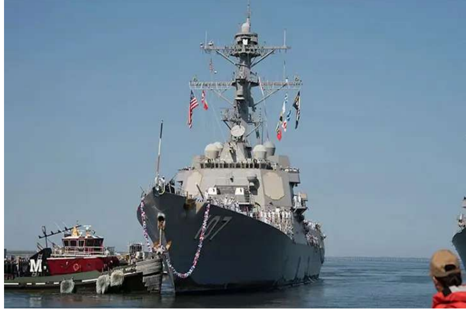
વોશિંગ્ટન (ડીસી) : પ્રમુખ ડોનાલ્ડ ટ્રમ્પે એટીક પ્રકારની ગાઈડેડ મિસાઈલ ડીસ્ટ્રોયર તેવા ત્રણ વિશાળ યુદ્ધ જહાજો, વેનેઝુએલાના જળ ક્ષેત્ર તરફ રવાના કર્યા છે. તે ઉપરાંત ૪૦૦૦ અત્યંત તાલિમબદ્ધ અને સક્ષમ સૈનિકો મરીન્સ પક્ષ મોકલવાની યોજના ઘડી રહ્યા છે. આ માહિતી આપતા એક અધિકારીએ જણાવ્યું હતું કે, પ્રમુખ ટ્રમ્પ માને છે કે વેનેઝુએલાના પ્રમુખ નિકોલસ માદુરો અમેરિકામાં થઈ રહેલી ડ્રગ તસ્કરીને સાથ આપી રહ્યા છે. પ્રમુખ માદુરો ઉપર તે કારણસર જ ટ્રમ્પના નિશાન પર હશે, તેમ પણ કેટલાકનું માનવું છે. આ મહિનાની શરૂઆતમાં તેના ઉપરનું ઈનામ બમણું કરી ૫૦ મિલિયન ડોલર કરી નખાયું છે. છેલ્લી બે વૅટ્સમાં માદુરોને મળેલી જીતને અમેરિકાએ સ્વીકાર્ય ગણી નથી. ઉપરાંત અમેરિકાએ તેમની ઉપર કાર્ટેલ-બેસ-સોલ્સ (કાર્ટેલ ઓફ થી સન્સ) નામક કોલેન-તસ્કર ગેંગનું નેતૃત્વ કરવાનો આક્ષેપ મુક્યો છે. આ તબક્કે તે પણ ઉલ્લંઘનીય છે કે, ક્યુબાના દિવંગત પ્રમુખ ફીડેલ કાસ્ત્રોની જેવા જ માદુરો પણ કઠર સામ્યવાદી અને અમેરિકા વિરોધી છે. ગયા મહિને ટ્રમ્પ વહીવટી તંત્રે તે ગેંગને આતંકવાદી ટોપી જેવું નામ આપ્યું હતું અને કહ્યું હતું કે, પ્રમુખ માદુરો તેના ગુપ્ત રીતે ખરા અર્થમાં નેતા છે. મંગળવારે વ્હાઈટ હાઉસ પ્રેસ બ્રિફિંગમાં પૂછવામાં આવ્યું ત્યારે તેના જવાબમાં કહેવામાં આવ્યું કે - ડુસની તસ્કરી રોકવા દરેક વિકલ્પો વિચારાઈ રહ્યા છે.