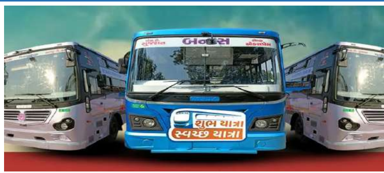
યાત્રાળુઓની સુરક્ષા અને સગવડ માટે 24x7 GPS મોનિટરિંગ, પેસેન્જર શેડ, સંચાલન કરવા માટે ૪૦૦૦ કર્મચારીઓની ટીમ ખડેપગે રહેશે. ગુજરાતના સુપ્રસિદ્ધ શક્તિપીઠ અંબાજીમાં ભાદરવી

રાખીને બસોની સંખ્યામાં વધારો કરવામાં આવ્યો છે. ૧ સપ્ટેમ્બર ૨૦૨૫થી ૭ સપ્ટેમ્બર ૨૦૨૫ સુધી આ વિશેષ બસોનું સંચાલન થશે. આ બસો મુખ્યત્વે અંબાજીથી ગબ્બર, દાંતા, પાલનપુર, અમદાવાદ, વડોદરા અને સુરત જેવા રૂટ્સ પર દોડશે, જેથી રાજ્યભરમાંથી આવતા યાત્રાળુઓ સરળતાથી અંબાજી પહોંચી શકે. આ ઉપરાંત નજીકના મુખ્ય સ્થળોથી અંબાજી આવવા સ્પેશિયલ મીની બસોની વ્યવસ્થા પણ કરાઈ છે. ગબ્બરથી અંબાજી RTO માટે ૨૦ બસો, અંબાજીથી દાંતા માટે ૧૫ લાખ યાત્રાળુઓને સેવા પૂરી પાડી હતી. આ વર્ષે યાત્રાળુઓની સુવિધાને ધ્યાનમાં