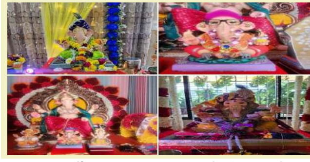
સુરતમાં આ વર્ષે પણ ૮૦ હજારથી વધુ વધુ નાની મોટી શ્રીજીની પ્રતિમાની સ્થાપના કરવામાં આવી છે. લોકોએ પોતાના ઘર, રહેણાંક સોસાયટી ઉપરાંત સંખ્યાબંધ મોટા ગણેશ આયોજકો દ્વારા ગણપતિ ઉત્સવ માટે લાખા સમયથી તૈયારી કરી હતી અને આજે ગણેશ સુરત શહેર ભક્તિ અને આનંદના ઉલ્લાસ અને ભક્તિભાવ સાથે સ્થાપના કરવામાં આવશે.

। પ્રતિનિધિ, સુરત, તા.૨૭ । મુંબઈની જેમ સુરતમાં પણ ગણેશોત્સવની પુમ જોવા મળી રહી છે અને તેની સાથે જ આજે સુરતમાં દબદબાભેર ગણેશોત્સવનો પ્રારંભ થઈ ગયો છે. આજે વહેલી સવારથી જ ઘર અને મંડપમાં શ્રીજીની પ્રતિમાની સ્થાપના શરૂ થઈ ગઈ હતી તે મોડે સુધી જોવા મળી હતી. શ્રીજીના ભક્તોએ ભારે ઉત્સાહ, ઉમંગ અને ઢોલ નગારા સાથે કરી શ્રીજીની પ્રતિમાની સ્થાપના કરી હતી અને હવે સતત દિવસ દિવસ બાપાની ભક્તિ માટે ભક્તોમાં ભારે ઉત્સાહ જોવા મળી રહ્યો છે. ગણપતિ બાપા મોરિયાના નારા સાથે ગણેશજીની સ્થાપના કરતાની સાથે જ સુરત ગણપતિ મિમય બની ગયું હોય તેવો માહોલ સર્જાયો હતો. સુરતમાં આ વર્ષે પણ ૮૦ હજારથી વધુ વધુ નાની મોટી શ્રીજીની પ્રતિમાની સ્થાપના કરવામાં આવી છે. લોકોએ પોતાના ઘર, રહેણાંક સોસાયટી ઉપરાંત સંખ્યાબંધ મોટા ગણેશ આયોજકો દ્વારા ગણપતિ ઉત્સવ માટે લાખા સમયથી તૈયારી કરી હતી અને આજે ગણેશ સુરત શહેર ભક્તિ અને આનંદના ઉલ્લાસ અને ભક્તિભાવ સાથે સ્થાપના કરી હતી. બાપાની સ્થાપના પહેલા અનેક આયોજકો અને રહેણાંક સોસાયટીમાં ઢોલ નગારા સાથે ગણેશજીના ભક્તોએ માહોલ બનાવી દીધો હતો. સુરતમાં દબદબાભેર ગણેશોત્સવનો પ્રારંભ થઈ ગયો છે બાપાના આગમન સાથે સુરત શહેર ભક્તિ અને આનંદના ઉલ્લાસ અને ભક્તિભાવ સાથે સ્થાપના કરવામાં આવી છે. લોકોએ પોતાના ઘર, રહેણાંક સોસાયટીમાં ઢોલ નગારા સાથે ગણેશજીના ભક્તોએ માહોલ બનાવી દીધો હતો. સુરતમાં દબદબાભેર ગણેશોત્સવનો પ્રારંભ થઈ ગયો છે બાપાના આગમન સાથે સુરત શહેર ભક્તિ અને આનંદના ઉલ્લાસ અને ભક્તિભાવ સાથે સ્થાપના કરવામાં આવશે.