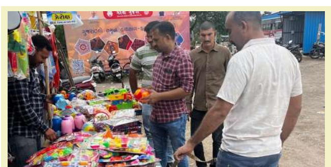
સોયબભાઈ શમાની ટીમને સાથે રાખીને શહેરના અલગ અલગ વિસ્તારોમાં ઘૂમી હતી. ખાસ કરીને ગણપતિના મોટા પાંડાલ સહિતના વિસ્તારો, તેમજ સાત રસ્તા રીક્ષા સ્ટેન્ડ, એસટી સ્ટેન્ડ, સહિતના જાહેર વિસ્તારો, ઉપરાંત કેટલાક લારી ગલ્લા સહિતના સ્થળો પર

। પ્રતિનિધિ, રાજકોટ, તા. ૨૯ । જામનગર શહેર અને જિલ્લામાં ગણપતિ મહોત્સવ ચાલી રહ્યો છે, અને શહેરના અનેક સ્થળોએ મોટી સંખ્યામાં લોકો એકત્ર થતા હોય છે, ત્યારે જામનગરના નવનિયુક્ત એસ.પી. ડો. રવિ મોહન સૈનિ કે જેઓ સુરક્ષાને લઈને સતત એકશન મોડમાં રહે છે, જેઓની રાહબરી હેઠળ એસ.ઓ.જી.ની ટીમ દ્વારા શહેરના ગણપતિ પાંડાલ, એસટી સ્ટેન્ડ, રિશ્મા સ્ટેન્ડ, સહિતના જાહેર સ્થળો ઉપર પણ ચેકિંગની કાર્યવાહી હાથ ધરવામાં આવી હતી. એસ.ઓ.જી.ના પી.આઈ. બી.એન. ચૌધરીની સૂચનાથી પીએસઆઈ એસ.પી.ગોહિલ એન તથા એ.વી.ખેર ઉપરાંત એસ.ઓ.જી.ની સમગ્ર ટુકડી ડોગ હેંગલર