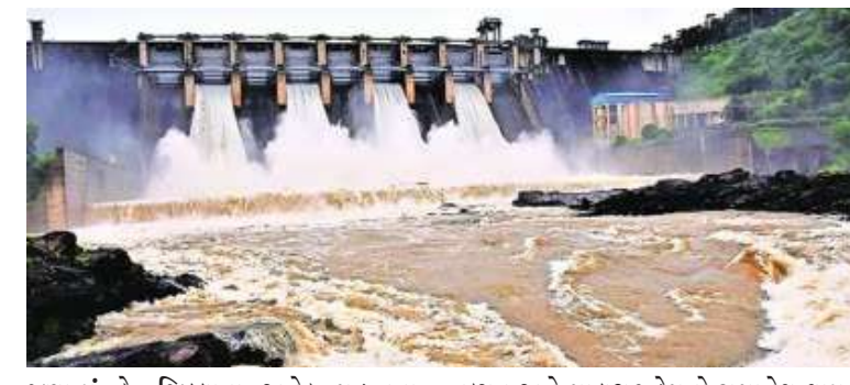
જણાવ્યું કે, જિલ્લાના અનેક મહત્વના જળાશયો ૧૦૦ ટકા ક્ષમતાએ ભરાઈ ગયા છે. આમાં મોજ ડેમ, આજી-૩ ડેમ, સોડવદર ડેમ, ન્યારી-૨ ડેમ, લાલપરી