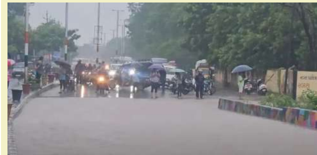
હજુ સુધી જમવાનું પણ બનાવી શક્યા નથી. છોકરાઓ પણ ભૂખ્યા છે. પાણી નીકળે તો જમવાનું બનાવી શકાય. સોસાયટીમાં રહેતા એક યુવકે જણાવ્યું કે, દર વખતે વરસાદમાં પાણી ભરાય છે. ગરીબ લોકો પોતાના ઘર છોડી ઊંચા ઘરોમાં જવા મજબૂર બને છે. જ્યારે પાણીમાં ઘરવખરી

। પ્રતિનિધિ, ગોધરા, તા.૩૦ । વહેલી સવારથી જ મધ્ય ગુજરાત અને દક્ષિણ ગુજરાતના જિલ્લાઓમાં વરસાદ પડી રહ્યો છે. જેમાં સૌથી વધુ વરસાદ પંચમહાલના હાલોલ તાલુકામાં ખાબક્યો છે. સવારે ૬ થી ૭ વાગ્યા સુધી હાલોલમાં ૮.૭૬ ઈંચ વરસાદ પડ્યો છે. જેના લીધે ચારે તરફ વરસાદી પાણી જોવા મળ્યા રહ્યા છે. ભારે વરસાદને લીધે હાલોલના લોકોને હાલોલ ભોગવવાનો વારો આવ્યો છે. કેમ કે, ઘરોમાં વરસાદી પાણી ઘૂસી જતાં ઘરવખરી અને ચીજવસ્તુઓ પાણીમાં પલળી ગઈ છે. હાલોલ-ગોધરા રોડ ઉપર આવેલી બાપુનગર સહિતની સોસાયટીમાં વરસાદી પાણી ભરાયા