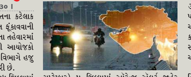
૩૦ સપ્ટેમ્બરના રોજ રાજકોટ, દેવભૂમિ દ્વારકા, પોરબંદર, જૂનાગઢ, ગીર સોમનાથ જિલ્લામાં અતિભારે વરસાદને લઈને ઓરેન્જ એલર્ટ અને કચ્છ, જામનગર, અમરેલી જિલ્લાના છુટાછવાયા સ્થળોએ ગાજવીજ સાથે ભારે વરસાદને લઈને યલો એલર્ટ જાહેર કર્યું છે. ચોમાસાની વિદાય સમયે ગુજરાતના કટેલાક વિસ્તારોમાં ગાજવીજ અને ભારે પવન ફૂંકાવાની સાથે વરસાદ વરસી રહ્યો છે.

। પ્રતિનિધિ, અમદાવાદ, તા.૩૦ । ચોમાસાની વિદાય સમયે ગુજરાતના કટેલાક વિસ્તારોમાં ગાજવીજ અને ભારે પવન ફૂંકાવાની સાથે વરસાદ વરસી રહ્યો છે. નવરાત્રિના તહેવારમાં વરસાદ થતાં ખેલેયાઓ અને ગરબી આયોજકો મુશ્કેલીમાં મૂકાયા છે, ત્યારે હવામાન વિભાગે હજુ ત્રણ દિવસ ભારે વરસાદની આગાહી કરી છે. જેમાં ત્રણ દિવસ સૌરાષ્ટ્રના દક્ષીણ અને વડોદરા, સુરત, ગાંધીનગર, જામનગર, અમરેલી જિલ્લાના છુટાછવાયા સ્થળોએ ગાજવીજ સાથે ભારે વરસાદને લઈને યલો એલર્ટ જાહેર કર્યું છે. ચોમાસાની વિદાય સમયે ગુજરાતના કટેલાક વિસ્તારોમાં ગાજવીજ અને ભારે પવન ફૂંકાવાની સાથે વરસાદ વરસી રહ્યો છે.