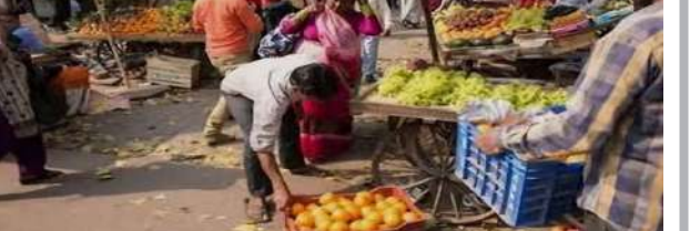
ભર્યા બાદ સરકારની અન્ય ૮ યોજનાઓના લાભ આપવામાં આવશે. આ યોજના જ્યારથી શરૂ થઈ છે, ત્યારથી ગત ડિસેમ્બર સુધીમાં વડોદરામાં કૂલ ૫૩૧૫૪ ના લક્ષ્યક સામે ૫૩૮૯૫ શેરી ફેરિયાઓની લોન બેંક દ્વારા મંજૂર કરવામાં આવી હતી. ૫ શ્રિમ તથા દક્ષિણ વિસ્તારનાં લોક કલ્યાણ મેળામાં શહેરી ફેરિયાઓ માટે પીએમ સ્વ નિધિની લોન મેળવવા રજીસ્ટ્રેશન, ડીઝીટલ ઓનબોર્ડિંગ તેમજ સરકારની અન્ય યોજનાઓને ૧૫૬૫ થી વધુ લાભાર્થીઓએ લાભ લીધેલો હતો.

। પ્રતિનિધિ, વડોદરા, તા.૩૦ । વડોદરા મ્યુનિસિપલ કોર્પોરેશન દ્વારા શહેરી ફેરિયાઓને વર્કિંગ કેપિટલ લોન આપવા માટે પીએમ સ્વ નિધિ યોજના અંતર્ગત ૫ શ્રિમ અને દક્ષિણ વિસ્તારના લોકો માટે લોક કલ્યાણ મેળો યોજવામાં આવ્યા બાદ આજે પૂર્વ અને ઉત્તર વિસ્તારના લોકો માટે લોક કલ્યાણ મેળાનું આયોજન કરાયું હતું. આ યોજના અંતર્ગત લોનની રકમનું પુર્નગઠન કરી પ્રથમ લોન ૧૫૦૦૦, બીજી લોન ૨૫૦૦૦ તથા ત્રીજી લોન પેટે ૫૦૦૦૦ અંગેના ફોર્મ તબક્કાવાર ભરાવવામાં આવશે. લોક કલ્યાણ મેળામાં શહેરી ફેરિયાઓનું પ્રોફાઈલિંગનું ફોર્મ ઓનલાઈન