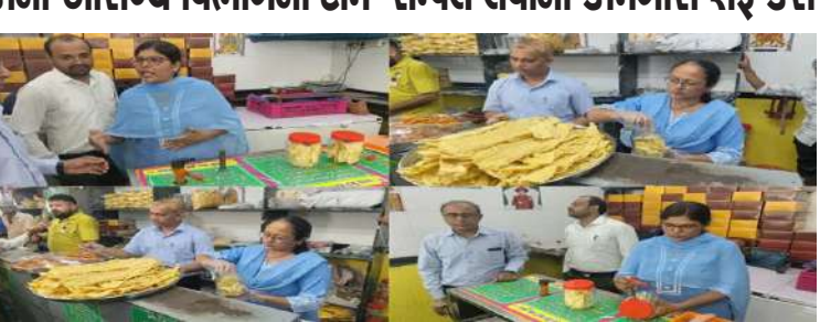
અને જલેબીની ભારે ડિમાન્ડ હોવાથી ફરસાણ વેચાણ કરનારા વેપારીઓની દુકાને લાંબી લાંબી લાઈનો જોવા મળે છે. દશેરાના દિવસે ફાફડા અને જલેબી ના વેચાણમાં તેજ હોવાથી ફરસાણ બનાવનારા સાથે-સાથે ફાફડા જલેબીનું વેચાણ કરે છે. મોટી સંખ્યામાં ફાફડા જલેબી નો ઓર્ડર હોવાથી દશેરાના આગલા દિવસથી જ વેપારીઓ ફાફડા બનાવવાની કામગીરી શરૂ કરી દે છે સુરતમાં દશેરાના દિવસે લોકો જે ફાફડા અને જલેબી ખાય છે તે આરોગ્યપ્રદ છે કે નહીં તે જાણવા માટે સુરત મહાનગરપાલિકાની આરોગ્ય વિભાગની ટીમ સેમ્પલ લેવાની કામગીરી શરૂ કરી છે. પાલિકાના ફૂડ વિભાગના જણાવ્યા પ્રમાણે આ સેમ્પલ લીધા બાદ તેની ચકાસણી લેબમાં મોકલાશે. જો કોઈ વેપારી પાસે લીધેલા સેમ્પલ તપાસમાં નિષ્ફળ જાય તો તેની સામે કાર્યવાહી કરવામાં આવશે. ફૂડ વિભાગે સેમ્પલ લેવાની કામગીરી સાથે સાથે ફરસાણની દુકાનમાં સફાઈ ની કામગીરી નું પણ નિરીક્ષણ કર્યું હતું.

। પ્રતિનિધિ, સુરત, તા.૩૦ । સુરત સહિત સમગ્ર ગુજરાતમાં દશેરાના દિવસે કરોડો રૂપિયાના ફાફડા અને જલેબીનું વેચાણ થાય છે. આ ફાફડા જલેબી લોકોના આરોગ્ય માટે સુરક્ષિત છે કે નહીં તે જાણવા માટે સુરત મહાનગરપાલિકાના આરોગ્ય વિભાગે ફાફડા-જલેબીના સેમ્પલ લેવાની કામગીરી શરૂ કરી છે. સુરત પાલિકાના ફૂડ વિભાગની ટીમે શહેરના જુદા જુદા વિસ્તારમાં ફરસાણનું વેચાણ કરતી દુકાનોમાં ચકાસણી કરી અને ફાફડા જલેબીના સેમ્પલ લીધા છે અને ચકાસણી માટે લેબોરેટરીમાં મોકલી આપવામાં આવ્યા છે. પાણીપીણીના શોષીન સુરતીઓ દશેરાના દિવસે કરોડો રૂપિયાના ફાફડા-જલેબી ખાઈ જતા હોય છે. આ દિવસે ફાફડા અને જલેબીને વેચાણમાં ભારે ઉછાળો આવે છે. દશેરાના દિવસે ફાફડા