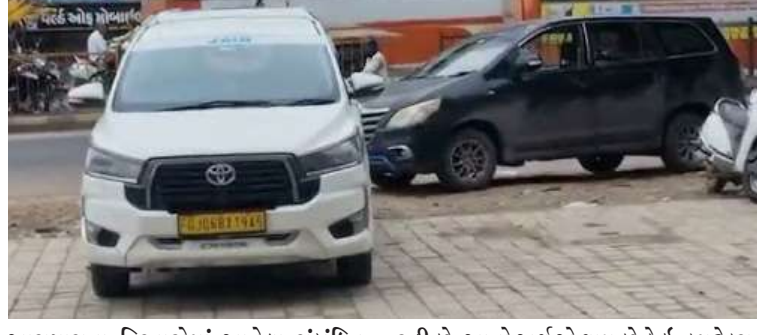
આસપાસના વિસ્તારોમાં આવેલા સંબંધિત વ્યક્તિઓની અન્ય ભાગીદારીઓ, વહીવટી કર્યો અને સંલગ્ન મિલકતો સહિત અન્ય સ્થળોએ એકસાથે આ તપાસ ચાલી રહી છે. આનો અર્થ એ થાય છે કે ઇન્કમેટેક્સ વિભાગે આ કાર્યવાહી માટે પૂર્વતેયારી કરી હતી અને એક વિશાળ નેટવર્કને આવરી લેવાનું લક્ષ્ય રાખ્યું હતું. આઈટી વિભાગની

। પ્રતિનિધિ, અરવલ્લી, તા.૩૦ । ગુજરાતમાં ફરી એક વાર ઇન્કમેટેક્સ વિભાગે દરોડા પાડ્યા છે. અરવલ્લી જિલ્લાના મુખ્ય મથક મોડાસા શહેરમાં ઇન્કમેટેક્સ વિભાગ દ્વારા વહેલી સવારથી જ સર્ચ ઓપરેશન હાથ ધરવામાં આવ્યું છે. આ કાર્યવાહી હેઠળ શહેરના ૪૫ થી વધુ અગ્રણી બિલ્ડરો, ડોક્ટરો અને વેપારીઓના નિવાસ્થાનો અને વ્યવસાયિક સ્થળો પર ઇન્કમેટેક્સ વિભાગની ટીમો દ્વારા સઘન તપાસ શરૂ કરવામાં આવી છે. આ ઓપરેશનની વ્યાપકતાનો અંદાજ એ વાત પરથી લગાવી શકાય છે કે, ઇન્કમેટેક્સ વિભાગના અધિકારીઓની ટીમો ૭૦ થી વધુ વાહનોના કાફલા સાથે મોડાસા પહોંચી હતી. વહેલી સવારથી જ શરૂ થયેલી આ કાર્યવાહીને કારણે મોડાસા શહેરમાં એક પ્રકારનો અફરાતફરીનો માહોલ સર્જાયો હતો. ઇન્કમેટેક્સ વિભાગના આ અચાનક અને મોટાપાયના સર્ચથી સ્થાનિક બિલ્ડરો, ડોક્ટરો અને વેપારીઓમાં ભારે ફફડાટ વધુ અગ્રણી બિલ્ડરો, ડોક્ટરો અને વેપારીઓ દ્વારા તમામ દસ્તાવેજો, હિસાબ-કિતાબ, અને અન્ય નાણાકીય વ્યવહારોની ઊંડાણપૂર્વક તપાસ કરવામાં આવી રહી છે. સૂત્રો દ્વારા મળતી માહિતી મુજબ, આ સર્ચ ઓપરેશન માત્ર અમુક ગણ્યાગાંઠવા સ્થળો પર મર્યાદિત નથી. મોડાસા શહેર અને તેની આસપાસના વિસ્તારોમાં આવેલા સંબંધિત વ્યક્તિઓની અન્ય ભાગીદારીઓ, વહીવટી કર્યો અને સંલગ્ન મિલકતો સહિત અન્ય સ્થળોએ એકસાથે આ તપાસ ચાલી રહી છે. આનો અર્થ એ થાય છે કે ઇન્કમેટેક્સ વિભાગે આ કાર્યવાહી માટે પૂર્વતેયારી કરી હતી અને એક વિશાળ નેટવર્કને આવરી લેવાનું લક્ષ્ય રાખ્યું હતું. આઈટી વિભાગની