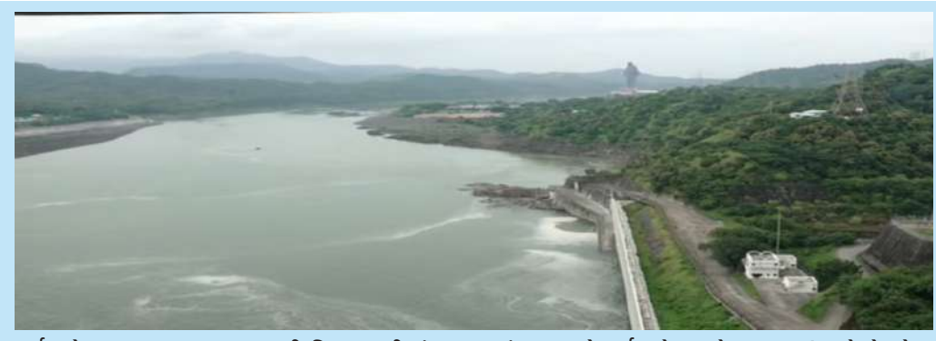
નર્મદા ડેમના તમામ દરવાજા આવતી સિઝન સુધી બંધ કરવામાં આવ્યા છે. નર્મદા ડેમ છલોછલ ભરાઈ ગયો છે. જેના કારણે ગુજરાતની પાણીની ચિંતા ટળી છે. આ બંધની શાખા અને પેટા શાખા નહેરો દ્વારા સૌરાષ્ટ્ર અને કચ્છ સહિત રાજ્યના તમામ જિલ્લાઓના અંતરિયાળ ગામો સુધી સિંચાઈનું પાણી પહોંચે છે. બાંધકામ ક્ષેત્રે આ બંધ આર.સી.સી. (સિમેન્ટ કોક્રિટ)થી બનેલા બંધોમાં દ્વિતિય ક્રમે આવતો વિશાળ બંધ છે. આ બંધમાં ઉત્પન્ન થતી જળ વિદ્યુતથી, ગુજરાત ઉપરાંત રાજસ્થાન અને મધ્યપ્રદેશ પણ લાભ મેળવે છે. ગુજરાતની ૧૭,૯૨૦ ચો.કિ.મી. જમીન, કે જે ૧૨ જિલ્લા, ૬૨ તાલુકા અને ૩૩૮૩ ગામોમાં પથરાયેલી છે (જે પૈકીની પોણા ભાગની જમીન હુકાળ ગ્રસ્ત વિસ્તારોમાં છે) અને રાજસ્થાનનાં બાંધમેર અને જાલોર જિલ્લાઓની ૭૩૦ ચો.કિ.મી. ની ઉજ્જડ જમીનને સિંચાઈનું પાણી પહોંચાડવામાં આવી રહ્યું છે.

આરબીપીએચ અને સીએચપીએચના ટર્બાઇન દ્વારા વીજ ઉત્પાદન થઈ રહ્યું છે. નર્મદા ડેમના તમામ દરવાજા આવતી સિઝન સુધી બંધ કરવામાં આવ્યા છે. નર્મદા ડેમ છલોછલ ભરાઈ ગયો છે. જેના કારણે ગુજરાતની પાણીની ચિંતા ટળી છે. આ બંધની શાખા અને પેટા શાખા નહેરો દ્વારા સૌરાષ્ટ્ર અને કચ્છ સહિત રાજ્યના તમામ જિલ્લાઓના અંતરિયાળ ગામો સુધી સિંચાઈનું પાણી પહોંચે છે. બાંધકામ ક્ષેત્રે આ બંધ આર.સી.સી. (સિમેન્ટ કોક્રિટ)થી બનેલા બંધોમાં દ્વિતિય ક્રમે આવતો વિશાળ બંધ છે. આ બંધમાં ઉત્પન્ન થતી જળ વિદ્યુતથી, ગુજરાત ઉપરાંત રાજસ્થાન અને મધ્યપ્રદેશ પણ લાભ મેળવે છે. ગુજરાતની ૧૭,૯૨૦ ચો.કિ.મી. જમીન, કે જે ૧૨ જિલ્લા, ૬૨ તાલુકા અને ૩૩૮૩ ગામોમાં પથરાયેલી છે (જે પૈકીની પોણા ભાગની જમીન પાણી નજરે પડી રહ્યું છે). હાલ ત્યાંનો કુદરતી નજરો ઘણો જ અદભૂત બન્યો છે. ઉપરવાસમાંથી પાણીની આવક ૭૮૨૮૨ ક્યુસેક છે. જેની સામે ૪૭૧૭૭ ક્યુસેક પાણી નદીમાં છોડાઈ રહ્યું છે. હાલમાં