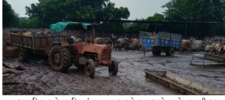
મહાનગરપાલિકા અને સ્થાનિક તંત્ર દ્વારા તપાસ બાદ કઈ કાર્યવાહી કરવામાં આવે છે એ જોવું રહ્યું. મહેસાણા જિલ્લાના થોળ ગામે આવેલી રાધાકૃષ્ણ પાંજરાપોળમાં

। પ્રતિનિધિ, મહેસાણા, તા.૩૧ । મહેસાણાના થોળ ગામે આવેલી રાધાકૃષ્ણ પાંજરાપોળમાંથી એક દુખદ ઘટના સામે આવી છે. આ પાંજરાપોળમાં મહેસાણા મહાનગરપાલિકા દ્વારા પકડવામાં આવેલી ગાયોને લાવવામાં આવે છે. મહાનગરપાલિકા તેમના નિભાવ માટે બર્ષ પછી પાંજરાપોળને ચૂકવે છે. છતાં પણ ગાયોને પૂરતો ઘાસચારો ન આપતા હોવાનો, તેમજ યોગ્ય તબીબી સારવાર કે તકેદારી ન રાખવામાં આવતી હોવાનો આક્ષેપ પાંજરાપોળના સંચાલકો પર કરવામાં આવ્યો છે. ખાનગી ટ્રસ્ટના જણાવ્યા અનુસાર ગાયોને બેધ્યાન હાલતમાં રાખવામાં આવી