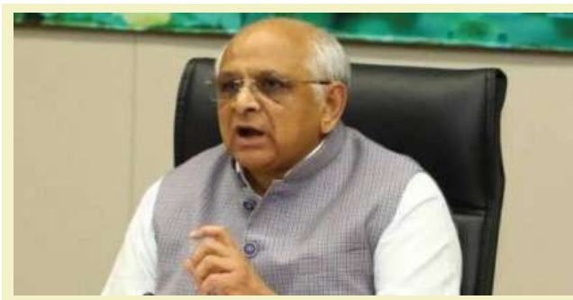
૪૮૭ માર્ગો, દક્ષિણ ગુજરાત વિસ્તારમાં ૧૫૨૮ કિલોમીટર લંબાઈના ૪૮૯ માર્ગો અને સૌરાષ્ટ્ર વિસ્તારમાં ૧૦૫૮ કિલોમીટરના ૨૭૨ ગ્રામીણ માર્ગોનો સમાવેશ થાય છે. મુખ્યમંત્રી સમક્ષ જનપ્રતિનિધિઓ અને ગ્રામીણ નાગરિકો, અગ્રણીઓ દ્વારા બારમાસી રસ્તાની સુવિધા

। પ્રતિનિધિ, ગાંધીનગર, તા.૧ । મુખ્યમંત્રી ભૂપેન્દ્ર પટેલે રાજ્યના ગ્રામ્ય વિસ્તારોને સુદૃઢ રોડ-કનેક્ટિવિટી દ્વારા સારી સપાટીવાળા અને બારમાસી રસ્તા - ઓલ વેધર રોડની સુવિધા મળી રહે તેવો જનહિતલક્ષી અભિગમ અપનાવ્યો છે.