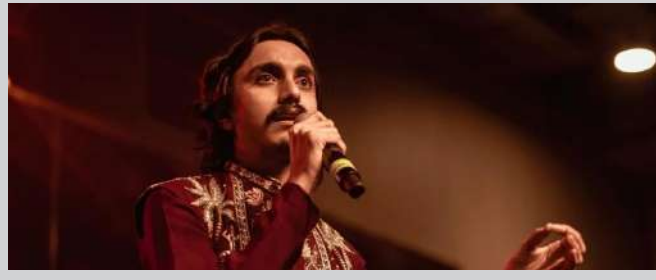
દરેક સુર અને તાલ ગામડાના મેળાઓમાંથી આવ્યો હોય એવું લાગે છે, એ જ રિધમ જેમાં અમારા પૂર્વજો ગાતા હતા આદિત્ય ગઢવીનું સંગીત ગુજરાતી લોકપરંપરાઓમાં ઊંડે સુધી વેરાએલું છે. દરેક સુર અને તાલ ગામડાના મેળાઓમાંથી આવ્યો હોય એવું લાગે છે, એ જ રિધમ જેમાં અમારા પૂર્વજો ગાતા હતા. તેમને સાંભળવું એટલે સંગીત દ્વારા પોતાની સંસ્કૃતિ ફરીથી ઊભી થાય છે. તેમના અવાજમાં સર્કલ એવું છે જે નજીકનું અને પડોશીનું લાગે છે. એ અવાજ એવો લાગે છે જે બધા - દાદા-દાદી, માતા-પિતા અને બાળકોને એક જ મંચ પર નચાવી દે. તેમના અવાજમાં ભાવ, આનંદ અને એકતા વહે છે.

અને દરેક ગરબા પ્યેલિસ્ટમાં પેહલું રહે છે. જ્યારે આદિત્ય ગઢવી ગાય છે ત્યારે કોઈ ગરબા ગાવાથી ખુદને રોકી શકે એમ નથી. તેમના સંગીતમાં એ જ રિધમ છે જે તાળી, રાસ અને ગરબા સર્કલને જીવંત બનાવી દે છે. દરેક ગીત ગરબા પ્રેમીને રાત પૂરી થાય ત્યાં સુધી ઝૂમતા રાખવા માટે જ બન્યું હોય એવું લાગે છે. જ્યારે નવરાત્રિ ગુજરાતમાં આવે છે, ત્યારે વાતાવરણ સંગીત, રંગો અને એકતાની ભાવનાથી ભરાઈ જાય છે. અને અદ્ભુત આનંદ આપનાર આદિત્ય ગઢવીનો અવાજ આ તહેવારની અનોખી મજા છે. ઉર્જાથી ભરપૂર તેમના ગીતો દરેક ગુજરાતીના હૃદયમાં ગોરવ અને આનંદથી વણાયેલા છે. આ વર્ષે ગુજરાતના પ્રિય કવિરાજ, આદિત્ય ગઢવી પોતાના દિલની નજીકના રંગો સાથે રંગ મોરલા થકી પાછા આવી રહ્યા છે - એક દમદાર નવરાત્રિ મહોત્સવ જે પહેલી વાર એક જ છત નીચે દસ રાત સુધી ઉજવાશે. ૨૨ સપ્ટેમ્બરથી ૧ ઓક્ટોબર ૨૦૨૫ દરમિયાન તેઓ પરંપરાગત ગરબા અને ફોક-ફ્યુઝન સંગીતના ઊર્જાસભર મિશ્રણ સાથે અમદાવાદના મકરબા ખાતે ગ્રીન અંદાઝ પાર્ટી લોન્માં રંગ જમાવશે. આ ઈવેન્ટ ટ્રાઈબવાઈબ એન્ટરટેઈનમેન્ટ, બુક માય શો એન્ટરપ્રાઈઝ દ્વારા પ્રોડ્યુસ અને પ્રમોટ કરવામાં આવી રહી છે.