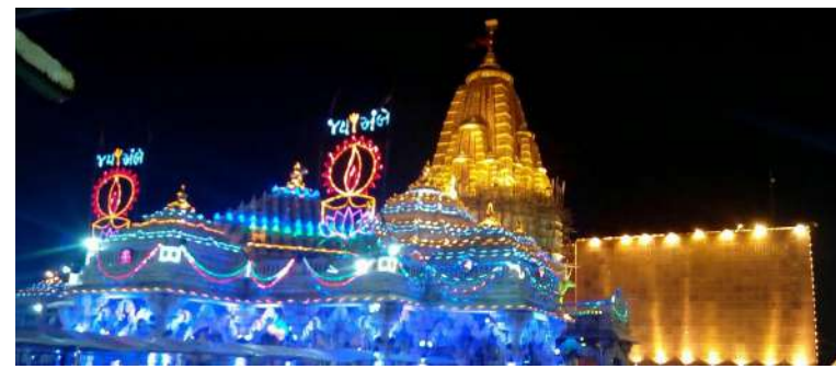
કરી છે. ડિજિટલ માધ્યમ થકી પણ પદયાત્રાળુઓને સ્વાગત સંદેશ પાઠવીને તેમને સુવિધાજનક યાત્રાનો સંદેશ આપવામાં આવ્યો છે. દર્શન માટે વિશેષ વ્યવસ્થા આ વર્ષે યાત્રાળુઓને સુગમ દર્શન મળી રહે તે માટે મંદિર પરિસરમાં વિશેષ આયોજન કરવામાં આવ્યું છે. વિશેષતાઓની વાત કરીએ તો, બસ સ્ટેન્ડથી મંદિર સુધી

રાજસ્થાન, મધ્યપ્રદેશ, મહારાષ્ટ્ર સહિત અન્ય રાજ્યોમાંથી પણ લાખો યાત્રાળુઓ પગપાળા અંબાજી પહોંચે છે. પદયાત્રાના સંકલ્પ સાથે હજારો ભક્તો પોતાના ગામથી યાત્રા શરૂ કરી મા અંબેના દર્શનાર્થે અંબાજી પહોંચ્યા છે. લાખો ભક્તોના આગમનનો અંદાજ વહીવટી તંત્રના અંદાજ પ્રમાણે, આ સાત દિવસીય મહામેળામાં ૩૦ લાખથી વધુ યાત્રિકો અંબાજી ધામ પધારશે. ખાસ કરીને પૂનમના દિવસે અંબાજી ધામે શ્રદ્ધાળુઓની ભીડ તૂટે તેવી શક્યતા છે. યાત્રાળુઓના આગમનને ધ્યાનમાં રાખીને બનાસકાંઠા જિલ્લાના વહીવટી તંત્ર અને સુરક્ષા એજન્સીઓએ સર્વગ્રાહી તૈયારીઓ