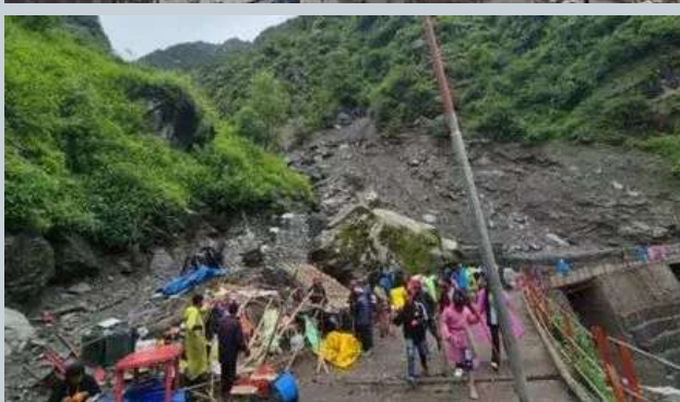
૫ સપ્ટેમ્બર સુધી ચાર ધામ યાત્રા બંધ, શ્રદ્ધાળુઓ હેમકુંડ સાહિબ ૧૬ શકશે નહીં