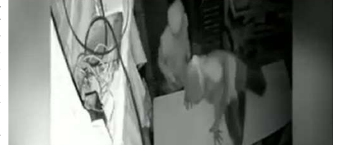
દુકાનોના તાળા તૂટેલા જોવા મળતા વેપારીઓ ભેગા થઈ ગયા હતા

પ્રતિનિધિ, અમદાવાદ, તા.૧ | અમદાવાદ શહેરના બારેજ વિસ્તારમાં ગઈકાલે મધરાતે ચોરીની મોટી ઘટના બની હતી. એક જ રાતમાં ૧૬થી વધુ દુકાનોના તાળા તોડીને ચોરોએ લાખો રૂપિયાનો માલસામાન ઉડાવી લીધો હતો. ઘટનાની જાણ થતાં વેપારીઓ અને સ્થાનિકોમાં ભારે રોષ ફેલાયો છે. માહિતી અનુસાર, ચોરોએ બારેજના મુખ્ય બજારમાં આવેલી દુકાનોને ટારગેટ બનાવી હતી. જેમાં દવાખાના સહિત અનેક કિરાણા સ્ટોર્સ, કપડાંની દુકાનો અને અન્ય વેપારી સંસ્થાઓ સામેલ છે. ચોરોએ તાળા તોડી અંદર પ્રવેશ મેળવી રોકડ રકમ અને કિંમતી માલસામાનની ચોરી કરી હતી. વેપારીઓના અંદાજ મુજબ, ચોરીમાં લાખો રૂપિયાનો નાશ થયો છે. દવાખાનામાંથી દવાઓ તથા રોકડ રકમની ચોરી કરવામાં આવી હતી. તેમજ અન્ય દુકાનોમાંથી પણ રોકડ અને માલસામાન ઉડાવી લઈ જવાયો હતો.