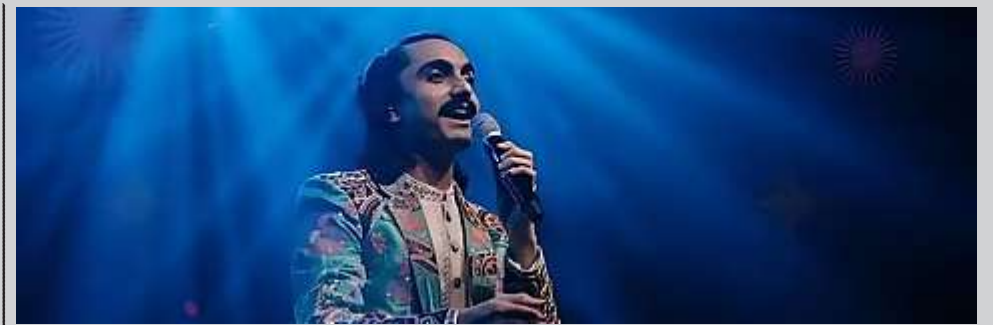
આદિત્ય ગઢવીનું સંગીત નવરાત્રિનો સ્વાભાવિક હિસ્સો બની ગયું છે આદિત્ય ગઢવી ફક્ત ગાયક નથી - તેઓ એક સાંસ્કૃતિક પ્રતિક છે. તેઓના દરેક સ્વરમાં ગુજરાતી ગોરવ અને પરંપરાનું પ્રતિબિંબિત દેખાઈ છે. તેમના ગીત માત્ર મનોરંજન નથી, પરંતુ ઉજવાણી અને એકતાનું ગીત છે. આદિત્ય ગઢવીનું સંગીત નવરાત્રિનો સ્વાભાવિક હિસ્સો બની ગયું છે. તેમના ગીતો દરેક ગરબા સર્કલને યાદોમાં ફેરવે છે અને દરેક તાલને નાચવા માટે આમંત્રણ આપે છે. તેમના અવાજ સાથે પરંપરા ઊભવત થાય છે અને સમુદાય એકતાથી જોડાય છે. આ વર્ષે, અમદાવાદ ફરી એક વાર આ જાદુનો સાક્ષી બનશે. અમદાવાદમાં આદિત્ય ગઢવીના રંગ મોરલા નવરાત્રિ મહોત્સવની ટિકિટ ફક્ત બુક માય શો પર ઉપલબ્ધ છે.

ન્યૂઝ ટ્રિફ નવરાત્રિમાં વરસાદી ખલેલથી ખેલેલા ચિંતિત, જળાશયોના સ્તર છલોછલ, ખેડૂતોમાં પુશી