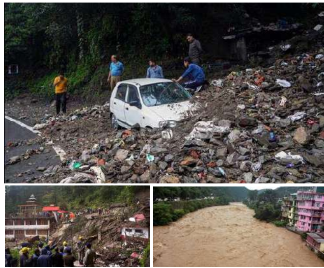
શિમલા, તા.૧ ।

શિમલામાં ખાલિની-ઝાંઝીરી રોડ તૂટી ગયો । રસ્તાનો મોટો ભાગ ધોવાઈ ગયો । રામનગરમાં ભૂસ્ખલનને કારણે ખાલિની-તુલીકાંડી બાયપાસ અવરોધિત થયો