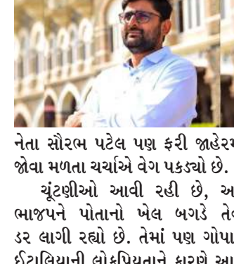
ભાજપમાં નવી આગાહી!