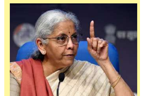
જુએસટી સુધારાઓ અર્થતંત્રને પારદર્શક બનાવશે : નિર્મલા સીતારમણ

। ઉજ્જૈન, તા.૨ । મધ્યપ્રદેશના ઉજ્જૈનના મહાનંદ નગરમાં આવેલી જીએ બેંક શાખામાં મોટી ચોરીની ઘટના સામે આવી છે. બેંક શાખામાંથી લગભગ ૨ કરોડ રૂપિયાના દાગીના અને ૮ લાખ રૂપિયાની રોકડ ચોરી કરીને બદમાશો ભાગી ગયા. આ ચોરીની માહિતી મળતાં ઉજ્જૈન પોલીસમાં દોષધામ મચી ગઈ હતી. તે જ સમયે, ચોરી કરતી વખતે બે બદમાશો સીસીટીવી ફૂટેજમાં ક્રોડોના આ સોદા માટે સુહાના ખાને પરવાનગી લીધી નહોતી. મધ્યપ્રદેશના ઉજ્જૈનના મહાનંદ નગરમાં આવેલી એસબીઆઈ બેંકમાં થયેલી ચોરીના કેસમાં, એવું સામે આવી રહ્યું છે કે બેંકના લોકર તૂટેલા નથી અને તાળાઓ ખોલવામાં આવ્યા હોઈ શકે છે. ઘટનાની માહિતી મળતાં જ ઉચ્ચ પોલીસ અધિકારીઓ ઘટનાસ્થળે પહોંચી ગયા હતા અને મામલાની તપાસ શરૂ કરી હતી. બેંકમાં ચોરાયેલા દાગીના બેંકમાં રાખેલા સોનાના લોનના દાગીના છે. હાલમાં, પોલીસે ઝડપના આધારે ચોરીનો શોધ શરૂ કરી છે. ઉજ્જૈનના મહાનંદ નગરમાં આવેલી એસબીઆઈ બેંકમાં થયેલી ચોરીના કેસમાં, એવું સામે આવી રહ્યું છે કે બેંકના લોકર તૂટેલા નથી અને તાળાઓ ખોલવામાં આવ્યા હોઈ શકે છે. ઘટનાની માહિતી મળતાં જ ઉચ્ચ પોલીસ અધિકારીઓ ઘટનાસ્થળે પહોંચી ગયા હતા અને મામલાની તપાસ શરૂ કરી હતી. બેંકમાં તાળું ખોલીને થયેલી ચોરીની ઘટનાને જોતા પોલીસને શંકા છે કે આ ચોરીમાં કોઈ અંદરની વ્યક્તિ સામેલ હોઈ શકે છે. હાલમાં પોલીસ ટીમ ઘટનાસ્થળે તપાસ કરી રહી છે અને પૂછપરછ કરી રહી છે. આ કેસમાં ઉજ્જૈનના એસપી પ્રદીપ શર્મા કહે છે કે ચોરોએ બધા તાળા ખોલીને ચોરી કરી છે. આમાં કોઈ અંદરની વ્યક્તિ પણ સામેલ હોઈ શકે છે. સવારે જ્યારે કર્મચારીઓ અને મેનેજર બેંક પહોંચ્યા ત્યારે તેમને બેંકના તાળા ખુલ્યા જોવા મળ્યા.