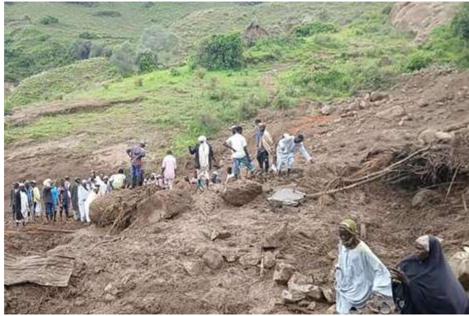
દારકુર : સુદાનના પશ્ચિમી પ્રદેશ દારકુરમાં ભૂસ્ખલનને કારણે ૧૦૦૦ લોકો મૃત્યુ પામ્યા હોવાના અહેવાલ છે. દેશ પર નિયંત્રણ રાખતા બળવાખોર જૂથ, સુદાન લિબરેશન મૂવમેન્ટ-આર્મીએ જણાવ્યું હતું કે ઘણા દિવસોના ભારે વરસાદ પછી રવિવારે તારાસિન ગામમાં ભૂસ્ખલન થયું હતું. અહેવાલો અનુસાર, આ ગામ મધ્ય દારકુરના મારાહ પર્વતો વચ્ચે આવેલું છે. તેને તાજેતરના વર્ષોની સૌથી ખરાબ કુદરતી આપત્તિ માનવામાં આવી રહી છે. સુદાન લિબરેશન મૂવમેન્ટ-આર્મીએ જણાવ્યું હતું કે પ્રારંભિક માહિતી અનુસાર, તારાસિન ગામમાં રહેતા લગભગ બધા લોકો મૃત્યુ પામ્યા છે. ફક્ત એક જ વ્યક્તિ બચી ગયો છે. અંદાજ છે કે લગભગ એક હજાર લોકો મૃત્યુ પામ્યા છે. ગામ સંપૂર્ણપણે નાશ પામ્યું છે. રાહત અને બચાવ કામગીરી હાથ ધરવા અને કાટમાળ નીચે દટાયેલા મૃતદેહોને બહાર કાઢવા માટે સંયુક્ત રાષ્ટ્ર અને અન્ય આંતરરાષ્ટ્રીય સહાય જૂથોને અપીલ કરવામાં આવી છે. સ્થાનિક મીડિયા દ્વારા એક વીડિયો શેર કરવામાં આવ્યું છે કે પર્વતો વચ્ચેનો આખો વિસ્તાર સમતલ થઈ ગયો છે અને લોકો ત્યાં કાટમાળમાં શોધ કરી રહ્યા છે. આ આપત્તિ એવા સમયે આવી છે જ્યારે સુદાન પહેલેથી જ ભયંકર ગુહયુદ્ધનો સામનો કરી રહ્યું છે. એપ્રિલ ૨૦૨૩ થી રાજધાની ખાર્ટુમ સહિત ઘણી જગ્યાએ દેશની સેના અને અર્ધલશ્કરી રેપિડ સપોર્ટ ફોર્સિસ વચ્ચે લડાઈ ચાલી રહી છે.