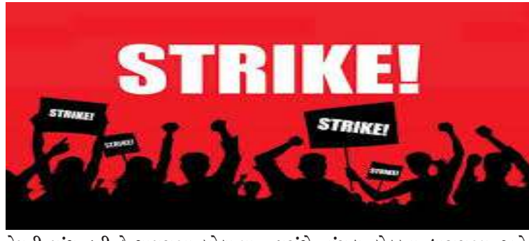
તેમની માંગ હતી કે ગ્રામસભા બોલાવવા બાદ જ આવા પ્રોજેક્ટ માટે અધિકારીઓ આવે, જેને લઈને આજની જન આક્રોશ રેલીનું આયોજન કરવામાં આવ્યું હતું. આ પ્રસંગે વાંસદા બેઠકના ધારાસભ્ય અને વ્યારાના પૂર્વ ધારાસભ્ય સહિત જિલ્લા કોંગ્રેસના અગ્રણીઓ ઉપસ્થિત રહ્યા હતા. કોંગ્રેસના નેતાઓએ આદિવાસી સમાજની

કરતા આગળ વધ્યા. રેલી દરમિયાન યુવાનો ઢોલ વગાડીને આદિવાસી સંસ્કૃતિ મુજબ નાચતા-ગાતા જોવા મળ્યા. પોલીસે યુસ્ત બંદોબસ્ત સાથે આ રેલીને કડક સુરક્ષામાં આગળ ધપાવી હતી. અગાઉ પમ્પિંગ હાઈડ્રો સ્ટોરેજ પ્રોજેક્ટના સર્વે માટે પોલીસ પ્રોટેક્શન સાથે અધિકારીઓની ટીમ સાતકાશીના આસપાસના વિસ્તારમાં ગઈ હતી. ત્યારે આદિવાસી સમાજે વિરોધ નોંધાવ્યો હતો, જેમાં પોલીસે ટીયર ગેસના ગોળા છોડ્યા અને હળવો બળપ્રયોગ કર્યો હતો. લોકોએ આક્ષેપ કર્યો હતો કે પોલીસે એક્સપાયરી ડેટવાળા ટીયર ગેસના સેલનો ઉપયોગ કર્યો હતો.