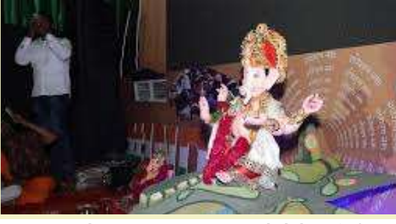
આકાશમાં જ તોડી પાડી ભારતીય સેનાએ પહેલગાવ હુમલાનો જડબાતોડ જવાબ આપ્યો હતો. ત્યારે આ વખતે ગણેશ મહોત્સવમાં પણ ઓપરેશન સિંદૂરની ખોલબાલા જોવા મળી રહી છે. યાદવ ચાલ યુવક મંડળ દ્વારા સરહદી વિસ્તારોમાં સેના કેવી રીતે

। પ્રતિનિધિ, દાહોદ, તા.૨ । ગણપતિ મહોત્સવ અંતર્ગત દાહોદમાં ઠેર ઠેર ગણેશ સ્થાપના કરવામાં આવી છે. સાથે જ મંડળો દ્વારા અલગ અલગ ઝાંખી પણ બનાવવામાં આવી છે. ત્યારે દાહોદ યાદવ ચાલ યુવક મંડળ દ્વારા ઓપરેશન સિંદૂરની જીવંત કૃતિઓ તૈયાર કરવામાં આવી છે. સેનાએ કઈ રીતે ઓપરેશન પાર પાડ્યું તેની ઝાંખી જોઈ લોકો મંત્રમુગ્ધ થાય છે. તાજેતરમાં થયેલા પહેલગાવ આતંકી હુમલાથી સમગ્ર વિશ્વમાં હાહાકાર મચ્યો હતો. આતંકવાદીઓના હુમલા બાદ ભારતીય સેનાએ ઓપરેશન સિંદૂર અંતર્ગત આતંકવાદી ઠેકાણા નેસ્તનાબુદ કર્યા હતા. તેમજ પાકિસ્તાન સેનાના જેટ અને ડ્રોનને