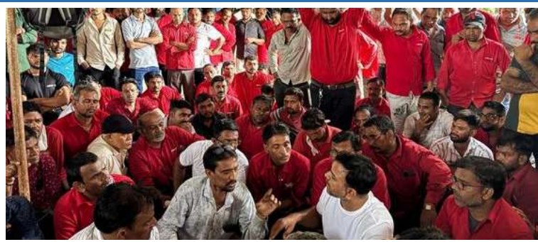
કરવાનો પ્રયાસ કર્યો. મહેસાણા-અમદાવાદ હાઇવે પર દિતાસણ પાટિયા પાસે અમન એપોલો કંપનીના કામદારો દ્વારા હડતાળ જેના કારણે વિસ્તારમાં ટ્રાફિક અને સ્થાનિક વ્યવસ્થા પર નોંધપાત્ર અસર પડી. ગરમ આ હડતાળ કામદારો અને કંપની વચ્ચે લાંબા સમયથી ચાલી રહેલા વિવાદનું પરિણામ હતું, જેમાં કામદારો વિવિધ

આરોપ છે કે કંપનીએ તેમની માંગણીઓ પર ધ્યાન આપ્યું ન હતું, જેના કારણે તેઓએ આખરે હડતાળનો આશરો લીધો. માહિતી અનુસાર, આ વિવાદ ઘણા મહિનાઓથી ચાલી રહ્યો હતો અને વારંવારની બેઠકો બાદ પણ કોઈ નક્કર ઉકેલ ન આવતા કર્મચારીઓએ આંદોલનનું આ પગલું ભર્યું. હડતાળ દરમિયાન દિતાસણ પાટિયા ખાતે મોટી સંખ્યામાં કર્મચારીઓ એકઠા થયા હતા, જેના કારણે હાઇવે પર જામ થઈ ગયો હતો. લાંબા સમયથી ચાલી રહેલા વિવાદનું પરિણામ હતું, જેમાં કામદારો વિવિધ