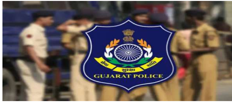
વાતમાં વિસંગતતાઓ જણાઈ અને તેના ધરની તલાશી લેતાં રૂ. ૫૨ લાખની રોકડ મળી આવી હતી. આ રોકડે ફરિયાદીના દાવાને શંકાસ્પદ બનાવ્યો અને પોલીસે

ગામના એક દલાલે પોલીસમાં ફરિયાદ નોંધાવી હતી કે, તે કલોલના એક એજન્ટ સાથે વિઝાની કામગીરી માટે આવેલા હરિયાણાના બે અજ્ઞાણ શપ્સો સાથે બેઠેલો હતો, ત્યારે આ શપ્સોએ રિવોલ્વર બતાવીને રૂ. ૬.૫૦ લાખની લૂંટ આચરી હતી. ફરિયાદીએ દાવો કર્યો હતો કે આ શપ્સોએ તેના ઘરનો કાચ તોડીને લૂંટ આચરી અને ફરાર થઈ ગયા હતા. જોકે, લાઘણજ પોલીસે ફરિયાદની ઝીણવટભરી તપાસ શરૂ કરી જેમાં સીસીટીવી ફૂટેજ, હરિયાણાના ફરાર બે શપ્સોની ધરપ કડ બાદ આ નેટવર્કના દોર ક્યાં સુધી પહોંચે છે તે જોવાનું રહેશે. લાઘણજ