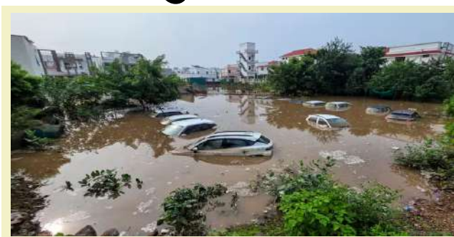
સાથે સુરક્ષિત સ્થળોએ ખસી રહ્યા છે. અમરેશ્વર ગામને જોડતા મુખ્ય માર્ગો પણ પાણીમાં ગરકાવ થઈ ગયા છે. લુણાદરા, કબીરપુરા જેવા વિસ્તારોમાં પાણી છવાઈ જતાં લોકોનો સંપર્ક તૂટી ગયો છે. એટલું જ નહીં, બંબોજ, વિરપુરા અને નારણપુરાના મુખ્ય માર્ગો પણ ૫

। પ્રતિનિધિ, વડોદરા, તા.પ । વડોદરા જિલ્લામાં ફરી એકવાર વરસાદે હાહાકાર સર્જયો છે. ડભોધ તાલુકાના અમરેશ્વર ગામમાં ઠાઠર નદીનું પાણી ફરી વળતાં આખું ગામ પાણીમાં ગરકાવ થઈ ગયું છે. ૫ રિણામે અમરેશ્વર અને આસપાસના ગામો સંપર્કવિહોણા બની ગયા છે. આ પરિસ્થિતિએ સ્થાનિક નાગરિકોમાં ભય સાથે ભારે મુશ્કેલીઓ ઊભી કરી છે. તાજેતરના વરસાદ બાદ ઠાઠર નદીમાં ભારે પાણીની આવક થઈ છે. આ સીઝનમાં ત્રીજા વાર નદીએ પોતાના કિનારા તોડતા ગામોમાં પાણી ઘૂસી ગયું છે. ખાસ કરીને અમરેશ્વરના નવીનગરી વિસ્તારમાં ૩૦ જેટલા ઘરોમાં પાણી ઘૂસી ગયું છે, જેના કારણે લોકો ઘરના સામાન