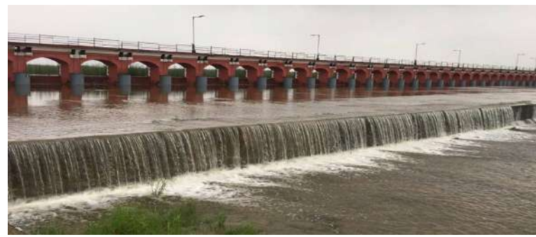
પાણી છોડવામાં આવ્યું છે. ધરોઈ ડેમના તંત્રએ મહેસાણા, સાબરકાંઠા, ગાંધીનગર, અમદાવાદ, ખેડા અને આણંદ જિલ્લા તંત્રને એલર્ટ કર્યું છે. સાબરમતી નદી કાંઠાના ગામડાના લોકોને સાવચેતી રાખવા વિનંતી કરાઈ છે. ધરોઈ ડેમની ભયજનક દરર ફૂટની સપાટી સામે હાલમાં જળ સપાટી ૬૧૮ ફૂટ પહોંચી છે. પાટરા તાલુકામાંથી

તમામ શાળાઓમાં રજા જાહેર કરાઈ છે. પરિસ્થિતિ પર તંત્રની ચાંપતી નજર છે. વડોદરામાં ભારે વરસાદના પગલે સ્કૂલોમાં આજે રજા અપાઈ છે. જિલ્લા કલેક્ટરે આજે એક દિવસ રજા જાહેર કરી છે. વડોદરા શહેર અને જિલ્લાની તમામ સ્કૂલોમાં આજે રજા જાહેર કરાઈ છે. હવામાન વિભાગે વડોદરામાં આજે ભારે વરસાદની આગાહી કરી છે. મોડી રાત્રે સાબરમતી નદીમાં ફરી પાણી છોડવામાં આવ્યું છે. ધરોઈ ડેમમાંથી રાત્રે ૧૦ વાગ્યે સાબરમતી નદીમાં પાણી છોડવામાં આવ્યું છે. ઉપરવાસમાં ભારે વરસાદના કારણે પાણીની આવક વધવાની શક્યતાએ નદીમાં ૨૫ હજાર ક્યુસેક