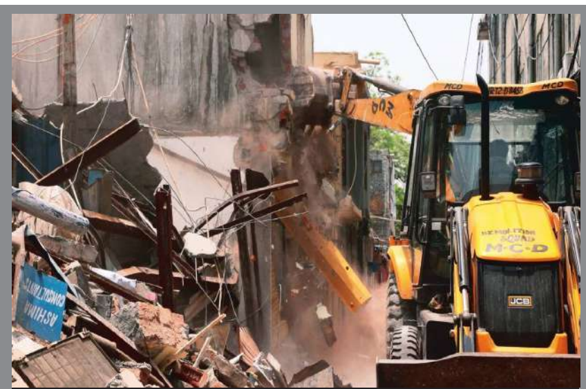
ઢાલકા તાલુકા આસરે ૧૪૦ કિ.મી. જેટલી દરિયા સીમા તેમજ ૦૮ જેટલા નાના મોટા ટાપુ ધરાવે છે

ઢાલકા તાલુકા આસરે ૧૪૦ કિ.મી. જેટલી દરિયા સીમા તેમજ ૦૮ જેટલા નાના મોટા ટાપુ ધરાવે છે. આ ટાપુઓ દરિયાઈ સુરક્ષા તેમજ પર્યાવરણીય દ્રષ્ટિએ ખુબ મહત્વના છે. મોટાભાગના ટાપુઓ પર પાછલા ઘણા વર્ષોથી ગેરકાયદેસર રીતે સરકારી જમીન પર મસ્જિદ/મંદિર બનાવી ધાર્મિક તેમજ રહેણાંકના નોંધકામ કરેલ છે. સદર ટાપુઓ પર અન્ય ધર્મની વસ્તી ધીરે ધીરે પલાયન થઈ રહી છે જે સુરક્ષાની દ્રષ્ટિએ ખુબ જ ગંભીર બાબત છે. અગાઉ તાલુકામાં ઓખા પોર્ટ પણ કાર્યરત છે. જેના કારણે વાર્ષિક ધોરણે ૪૨૯૯ જેટલી કિયાંગો નોટ આંતરરાષ્ટ્રીય સીમા સુધી ફિશીંગ માટે પરિવહન કરે છે. અગાઉ તાલુકામાં રાષ્ટ્રીય ધોરણે મહત્વની સંસ્થાના સ્ટેશન આવેલ છે. ઉપરાંત પાછલા થોડાક વર્ષોમાં દરિયાઈ સીમાથી નાકોટીક સહસ્ત્રવન ઘુસાડવાના નિષ્ફળ પ્રયાસ પણ કરવામાં આવેલ છે.