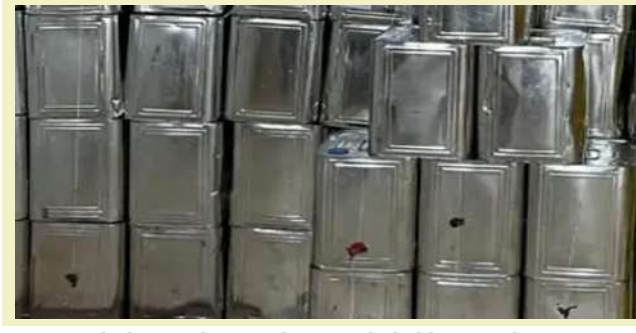
કરનારા અને તેમની દરેક કડીઓની તપાસ કરતાં તેનો છોડો ગાંધીધામ, કચ્છ ખાતેથી મળ્યો હતો. એચ.ડી.કોશિયાએ વધુમાં કહ્યું હતું કે ભારત ફૂડ્સ કો-ઓપરેટીવ વિ-ગાંધીધામ ખાતેથી ચાર નમુના અને ક્રોલ નજીક કિષ્ના ટ્રેડિંગમાંથી ચાર નમુના એમ કુલ ૬ નમુના તંત્રના દરોડામાં લઈ ચકાસણી

। પ્રતિનિધિ, જામનગર, તા.૧૩ । છેલ્લા કેટલાક સમયથી રાજ્યમાં ખોરાક અને ઔષધ નિયમ તંત્ર દ્વારા વિવિધ સ્થળ પર ઘીની રેડ કરવામાં આવી રહી છે. ત્યારે ક્રોલ નજીક કિષ્ના ટ્રેડિંગમાં તંત્ર દ્વારા તપાસણી દરમિયાન સોયાબીન-વનસ્પતિની ભેળસેળ પકડી પાડવામાં આવી હતી. જેમાં શુદ્ધ ઘીમાં ભેળસેળ કરી બનાવટી ઘી બનાવવાનો કાવ્યો માલ સમિત કુલ રૂ. ૧.૪ કરોડનો માલ જપ્ત કરાયો છે. ભેળસેળિયા તત્ત્વો દ્વારા મોટા ભાગે ઘીમાં ખાસ પ્રકારનું રિકાર્ડન પામ તેલને મુખ્ય ઘટક તરીકે વાપરતા હોવાનું ધ્યાનમાં આવ્યું છે. જેનું ટેક્સચર ધીને મળતું આવતું આવે છે. આથી તે શંકાસ્પદ જણાઈ આવતાં તેના ઉત્પાદન અંગેની માહિતી એકત્ર કરી અધિકારીઓ દ્વારા આવું ભેળસેળ