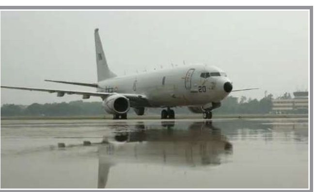
રેકગિશન એરક્રાફ્ટ પ્રોગ્રામ ઓફિસ અને ડિફેન્સ સિક્યુરિટી કોઓપરેશન એજન્સીનો સમાવેશ થાય છે. એનઆઈપીએ વૈશ્વિક મેરીટાઇમ ભાગીદારી સંભાળવા માટે જવાબદાર છે જ્યારે પીએમએ ૨૯૦ મેરીટાઇમ પેટ્રોલ એરક્રાફ્ટના સંપાદન અને સપોર્ટમાં છે. ભારત સાથે હાલમાં ૧૨ પીટઆઇવિમાન છે અને હિંદ મહાસાગર ક્ષેત્રમાં તેની દેખરેખ અને સબમરીન વિરોધી યુદ્ધ ક્ષમતાઓને મજબૂત કરવા માટે નૌકાદળને વધુ એનઆઈપીએ વૈશ્વિક મેરીટાઇમ ભાગીદારી સંભાળવા માટે જવાબદાર છે જ્યારે પીએમએ ૨૯૦ મેરીટાઇમ પેટ્રોલ એરક્રાફ્ટના સંપાદન અને સપોર્ટમાં છે. ભારત સાથે હાલમાં ૧૨ પીટઆઇવિમાન છે અને હિંદ

નવીદિલ્હી, તા.૧૩ | ભારત અને અમેરિકા વચ્ચે સંરક્ષણ સહયોગ એક નવા સ્તરે પહોંચવા જઈ રહ્યું છે. સૂત્રોના જણાવ્યાનુસાર, ભારતીય નૌકાદળ માટે ૬ વધારાના પીટઆઇ ટાઇમ પેટ્રોલ એરક્રાફ્ટની ડીલ અંગે બંને દેશો વચ્ચે વાતચીત લગભગ પૂર્ણ થઈ ગઈ છે. આ ડીલ લગભગ ૪ અબજ ડોલરની છે અને આ માટે એક અમેરિકન પ્રતિનિધિમંડળ ૧૬મી ૧૯મી સપ્ટેમ્બર દરમિયાન દિલ્હી આવશે. અહેવાલો અનુસાર, પ્રતિનિધિમંડળમાં યુએસ ડિપાર્ટમેન્ટ ઓફ ડિફેન્સ અને ઓઈગના પ્રતિનિધિઓ તેમજ અનેક મહત્વપૂર્ણ સંસ્થાઓના અધિકારીઓનો સમાવેશ થશે. આમાં અંડર સેક્રેટરી ઓફ ડિફેન્સ ફોર પોલિસી, નેવી ઈન્ટરનેશનલ પ્રોગ્રામ્સ અને ડિપાર્ટમેન્ટ ઓફ ડિફેન્સ આફિસ મેરીટાઇમ પેટ્રોલ એન્ડ