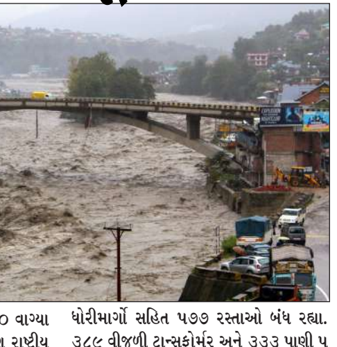
સૌથી વધુ છે. શનિવારે સવારે ૧૦:૦૦ વાગ્યા સુધી રાજ્યમાં ભૂસ્ખલનને કારણે ત્રણ રાષ્ટ્રીય ધોરીમાર્ગો સહિત ૫૭૭ રસ્તાઓ બંધ રહ્યા. ૩૮૬ વીજળી ટ્રાન્સફોર્મર અને ૩૩૩ પાણી પ