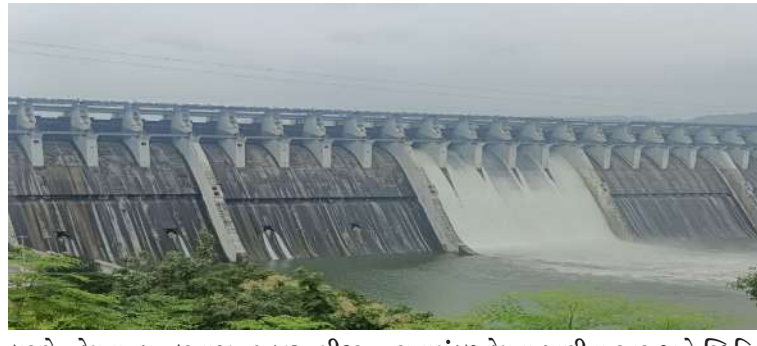
કારણે, ડેમના ૫ દરવાજા ૧.૪૨ મીટર સુધી ખોલવામાં આવ્યા છે અને દર સેકન્ડે ૧,૧૨,૫૦૨ ક્યુસેક પાણી નર્મદા નદીમાં છોડવામાં આવી રહ્યું છે. નર્મદા નિયંત્રણ

। પ્રતિનિધિ, નર્મદા, તા.૧૩ । રાજપીપળા નજીક સરદાર સરોવર નર્મદા ડેમનું પાણીનું સ્તર નોંધપાત્ર રીતે વધ્યું છે. મધ્યપ્રદેશના ઓમકારેશ્વર ડેમમાંથી પાણી છોડવાને કારણે, આ સિઝનમાં નર્મદા ડેમનું પાણીનું સ્તર બીજા વખત ૧.૩૬ મીટરને વટાવી ગયું છે. હાલમાં, ડેમનું પાણીનું સ્તર ૧૩૬.૦૮ મીટર પર પહોંચી ગયું છે અને ડેમ ૯૨ ટકા ભરાઈ ગયો છે. ત્યારે ઉપરવાસમાંથી પાણીની આવકમાં વધારો નોંધાતા વધુ ૫ ગેટ ખોલાયા છે. હાલમાં હાલમાં ૫ ગેટ ખુલ્લા હતા. ત્યારે આજે બપોરે ૧૨ કલાકથી વધુ પાંચ ગેટ ખોલવામાં આવતા કુલ ૧૦ ગેટ હાલ ખુલ્લા કરાયા છે. આપને