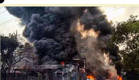
એટલી વધારે હતી કે ધુમાડાના ગાઢ વાદળ દૂરથી દેખાતા હતા, જેના કારણે આસપાસના વિસ્તારોમાં વિઝિબિલિટી ઓછી થઈ ગઈ હતી અને ઘાસ લેવામાં તકલીફની ફરિયાદો પણ આવવા લાગી હતી. ફાયર વિભાગના કર્મચારીઓ આગને કાબૂમાં લેવા માટે પાણી અને

। પ્રતિનિધિ, અંકલેશ્વર, તા.૧૪ । ભરૂચના અંકલેશ્વરની પાનોલ જુઆઇડીસી ભીષણ આગની ઘટના થઈ હતી. આ ઘટનામાં બે શ્રમિકો મોતને ભેટ્યા છે. પાનોલી જુઆઇડીસી માં આવેલી સંઘવી ઓર્ગેનિક્સ કંપનીમાં અચાનક આગ ભભૂકી ઉઠી હતી. ઘટનાની જાણ થતાજ ફાયરબ્રિગેડની ૧૦ જેટલી ગાડીઓ સ્થળ પર પહોંચી હતી અને આગ ઓલવવાની કામગીરી હાથ ધરી હતી. આ ઘટનાથી સંજલવી ગામના લોકોમાં ભય ફેલાયો હતો.