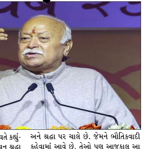
આરએસએસ વડા મોહન ભાગવતે કહ્યું- “આપણે બધા જાણીએ છીએ કે ભગવાન એક અને શ્રદ્ધા પર ચાલે છે. જેમને ભોતિકવાદી કહેવામાં આવે છે, તેઓ પણ આજકાલ આ

ઈન્ડોર, તા. ૧૫ । રાષ્ટ્રીય સ્વયંસેવક સંઘ વડા મોહન ભાગવતે એક મોટું નિવેદન બહાર પાડ્યું છે. મોહન ભાગવતે મધ્યપ્રદેશના ઈન્ડોરમાં પુસ્તક પરિક્રમાના વિમોચન દરમિયાન કહ્યું હતું કે “ઈંગલેન્ડ વિભાજનની સ્થિતિમાં આવી રહ્યું છે, આપણે વિભાજીત નહીં થઈએ, આપણે આગળ વધીશું, આપણે એક સમયે વિભાજીત હતા, આપણે તેમને ફરીથી એક કરીશું.” મોહન ભાગવતે પોતાના સંબોધનમાં કહ્યું હતું કે દુનિયામાં ઝઘડા થાય છે, ભગવાન એક છે કે અનેક? આપણા કિલોસોફરો કહે છે કે એક અને અનેકની લડાઈમાં શા માટે સામેલ થવું? ભગવાન છે, બીજું કંઈ નથી, પછી બધી ઝઘડા નકામી થઈ જાય છે.