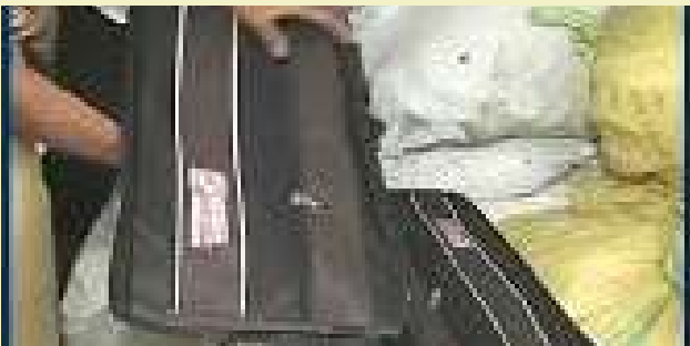
કારખાનામાંથી બ્રાન્ડેડ કંપનીઓની નકલી સ્કૂલ તથા ટ્રાવેલ બેગ બનાવવામાં આવી રહી હોવાની માહિતી પોલીસને મળી હતી. જે બાતમીના આધારે ઉધના પોલીસે દરોડા પાડતા ચોકાવનારી હકીકત સામે આવી હતી. પોલીસ તપાસ દરમિયાન કારખાનામાંથી પુમા કંપનીની ૨૭૨ સ્કૂલ બેગ, ડીઝલની

। પ્રતિનિધિ, સુરત, તા.૧૫ । હાલના સમયમાં નકલીની હારમાળા વચ્ચે શહેરમાં કુલિકેટ બ્રાન્ડેડ બેગ બનાવતું કારખાનું પકડાયું છે. આ મામલે પોલીસે રેડની કાર્યવાહી દરમિયાન પુમા, ડીઝલ અને એડવેન્ચર બ્રાન્ડની કુલ ૯૫૫ બેગ સાથે આ કુલિકેટ ટ્રાવેલિંગ બેગ બનાવનાર આરોપીઓની ધરપકડ કરી છે. પકડાયેલા આ બેગની કુલ કિંમત રૂપિયા ૪,૭૭,૦૦૦/- થાય છે, ત્યારે આ નોંધવા જેવી બાબત છે કે, આ કાર્યવાહી સુરત શહેર પોલીસ ઝોન-૦૨ એલસીબી તથા ઉધના સર્વેલન્સ ટીમે સાથે મળીને હાથ ધરી હતી. મળતી વિગતો અનુસાર, સુરત શહેરના ઉદ્યોગનગર વિસ્તારમાં આવેલા ઉમા ઈન્ડસ્ટ્રીયલ એસ્ટેટમાં ચાલતા એક