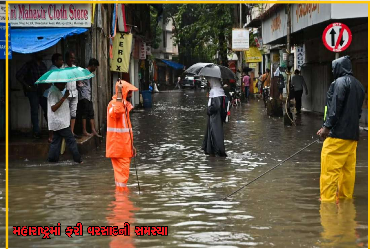
મહારાષ્ટ્રમાં ફરી વરસાદની સમસ્યા