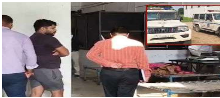
હતો. આ ટેસ્ટ રિપોર્ટ સ્પષ્ટપણે દર્શાવે છે કે આ પનીર ભેળસેળયુક્ત અને ખાદ્ય સુરક્ષાના માપદંડોનું ઉલ્લંઘન કરતું હતું. વનસ્પતિ ફેટનો ઉપયોગ કરવાથી પનીરનું ઉત્પાદન કરતું પડે છે અને વેચાણકર્તાઓ મોટો નફો કમાય છે, પરંતુ તે ગ્રાહકોના આરોગ્ય માટે અત્યંત હાનિકારક સાબિત થઈ શકે છે. લેબોરેટરી રિપોર્ટના આધારે,

માહિતી મળી હતી. આ માહિતીના આધારે, ફૂડ વિભાગની ટીમે ગત મહિને તાત્કાલિક દરોડો પાડ્યો હતો. દરોડા દરમિયાન, ટીમને મોટા પ્રમાણમાં પનીર અને તેના ઉત્પાદન માટે વપરાતા શંકાસ્પદ પદાર્થો મળી આવ્યા હતા. ફૂડ વિભાગના અધિકારીઓએ સ્થળ પરથી પનીરના નમૂના લીધા હતા અને તેમને વધુ વૈજ્ઞાનિક પરીક્ષણ માટે ગાંધીનગર ખાતેની સરકારી લેબોરેટરીમાં મોકલવામાં આવ્યા હતા. લેબોરેટરી ટેસ્ટના પરિણામોએ ચોકાવનારા ખુલાસા કર્યાં. પરીક્ષણમાં બહાર આવ્યું કે પનીરના નમૂનામાં દૂધના ફેટને બદલે વનસ્પતિ ફેટ (વેજ ફેટ)નો ઉપયોગ કરવામાં આવ્યો