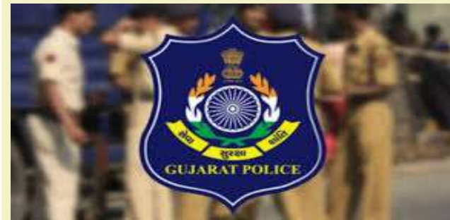
જિલ્લા પોલીસ વડાએ અલ્ટિમેટમ આપ્યું છે. રાજકોટ જિલ્લામાં પ્રથમ વખત ગુનેગારોને સુધારવા માટે જિલ્લા પોલીસ વડા વિજયસિંહ ગુજરે અનોખો અભિગમ અપનાવ્યો છે. ગોડલ એસ.આર.પી. ગ્રાઉન્ડ ખાતે જિલ્લા પોલીસ વડા વિજયસિંહ ગુજરે ગુનેગારોને સંબોધીને સુધરી જવા

રાજકોટ જિલ્લા પોલીસ વડાનું ગુનેગારોને અલ્ટિમેટમ આપ્યું છે. બે કે તેથી વધુ ગુનામાં ઝડપાયેલા અપરાધીઓને ચેતવણી આપવામાં આવી કે, હવે જો કોઈ ગુનાખોરી આચરી તો કડક કાર્યવાહી થશે. રાજકોટમાં ૪૦૦ જેટલા ગુનેગારોને જિલ્લા પોલીસ વડાએ સંબોધન કર્યું હતું. ગોડલના એસઆરપી ગ્રાઉન્ડ ખાતે કાર્યક્રમ યોજાયો હતો. મહત્વનું છે કે, આજથી શારદીય નવરાત્રીનો શુભારંભ થઈ રહ્યો છે. ત્યારે રાજકોટ જિલ્લા પોલીસ એકશનમાં આવી છે. સાથે જ ગુનાખોરી આચરતા લોકોનું એક વિસ્તૃત બનાવી. જેમાં ગંભીર ગુનામાં સંડોવાયેલા ૪૦૦ જેટલા લોકોને જિલ્લા પોલીસ વડા વિજયસિંહ ગુજરે ચેતવણી આપી અને