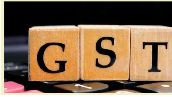
દુરુપયોગ કરીને વાસ્તવિક ટર્નઓવર ૧.૫૦ કરોડથી ઓછું દર્શાવી કંપોઝિશન સ્કીમનો ખોટી રીતે લાભ લેતા હતા. આ પ્રકારની ગેરરીતિઓ કરી તેઓ વાસ્તવિક વેચાણ ઓછું દર્શાવીને વેરાકીય જવાબદારી ટાળતા હતા. જી.એસ.ટી. અધિકારીઓએ તાજેતરમાં ફૂડરિસ્ટોરન્ટ ક્ષેત્ર હેઠળના કરદાતા દ્વારા કરચોરીના ઉદ્દેશ્યે કેવા પ્રકારની રીતરસમો અપનાવવામાં આવે છે તેની ચકાસણી કરવા અધિકારીઓ પોતે ગ્રાહક બની આવા વેપારીઓના ધંધાના સ્થળે ખાનગીરાહે ચકાસણી કરવામાં આવેલ. જેમાં કરચોરી માટે અપનાવેલ વિવિધ પ્રકારની મોડલ

। પ્રતિનિધિ, અમદાવાદ, તા.૨૮ । અમદાવાદ સહિત રાજ્યના વિવિધ શહેરોમાં ૨૫ રેસ્ટોરાંમાં સ્ટેટ જીએસટીના અધિકારીઓએ તપાસ હાથ ધરી હતી. જેમાં ૫૨.૦૭ કરોડના બિનહિસાબી વ્યવહારો શોધી કાઢીને ૪.૮૮ કરોડની કરચોરી પકડી પાડી હતી. રેસ્ટોરાંના ૧૬ વેપારીઓ દ્વારા કરચોરી કેવા પ્રકારની કરાય છે તે શોધી કાઢવા માટે અધિકારીઓ ગ્રાહક બનીને ગયા હતા અને ખાનગી રાહત તપાસ કરી હતી. તપાસ દરમિયાન ધ્યાને આવેલું કે, વેપારીઓ કરચોરી માટે જુદી જુદી મોડલ ઓપરેન્ડી અપનાવતા હતા. જેમાં પેમેન્ટ ડાયવર્ટ કરવા માટે એકની વધુ ક્યુઆર કોડનો ઉપયોગ, કાચી ચિઠ્ઠી દ્વારા વ્યવહારો, ઈ-વોઈસ વિના વેચાણ અને કંપોઝિશન સ્કીમનો