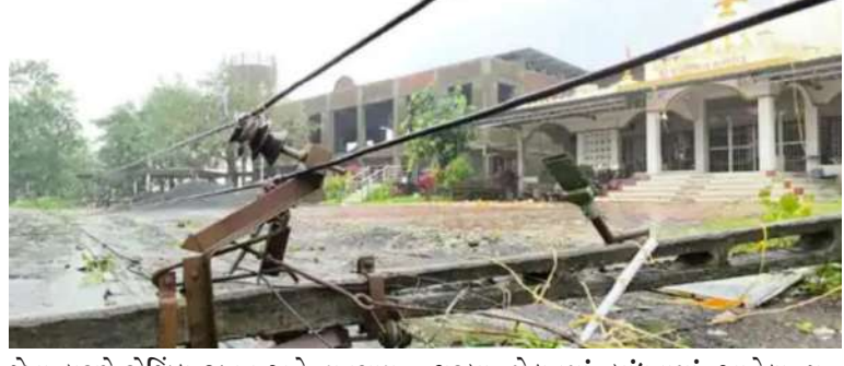
જેના કારણે રોજિંદા જીવન અને વ્યવસાય ખોરવાઈ ગયા હતા. વાવાઝોડાના કારણે નવરાત્રિ ઉત્સવની તૈયારી કરી રહેલા આયોજકોને પણ ભારે નુકસાન થયું હતું.

। પ્રતિનિધિ, નવસારી, તા.૨૮ । નવસારી જિલ્લામાં શનિવાર રાત્રે શરૂ થયેલા ભારે પવન સાથે ભારે વરસાદ વાવાઝોડામાં ફેરવાઈ ગયો, જેના કારણે ચીખલી, ગેટોર અને અન્ય તાલુકાઓમાં વ્યાપક વિનાશ થયો. આ કુદરતી આફતથી ખેતી, માળખાગત સુવિધાઓ અને નવરાત્રિ યોજનાઓને નોંધપાત્ર નુકસાન થયું છે, જ્યારે સ્થાનિક વહીવટીતંત્ર રાહત અને બચાવ કામગીરીમાં વ્યસ્ત છે. ચીખલીમાં, જોરદાર પવનને કારણે સરકારી અનાજ ગોડાઉનની ઠિવાલો અને છત તૂટી પડી, જેમાં સંગ્રહિત અનાજનો મોટો જથ્થો ભીંજાઈ ગયો. આ ઘટનાએ ખેડૂતો અને સ્થાનિક વેપારીઓમાં ચિંતા વધારી છે, કારણ કે આ અનાજ સ્થાનિક વિતરણ અને સરકારી યોજનાઓ માટે બનાવાયેલ હતું. વધુમાં, તાલુકાના અનેક ઘરોની છત ઉડી ગઈ, જેના કારણે ઘણા પરિવારોને ખુલ્લામાં રહેવાની ફરજ પડી. જોરદાર પવનને કારણે તાલુકાના અનેક રસ્તાઓ પર વૃક્ષો પછ પડી ગયા, જેના કારણે વાહનવ્યવહાર ખોરવાઈ ગયો. ગટર, ચીખલી અને આસપાસના વિસ્તારોમાં મોટા બિલબોર્ડ અને જાહેરાત બોર્ડ પણ પવનના ફૂંકાવાથી ઉડી ગયા, જેના કારણે વ્યવસાયોને આર્થિક નુકસાન થયું. રાત્રે શરૂ થયેલા વીજળી ગુલ થવાથી સમગ્ર તાલુકા અંધારામાં ડૂબી ગયો હતો,