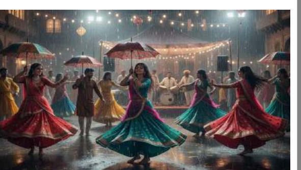
સરસ્વતી ફરી બે કાંઠે વહેતી થઈ છે, સરસ્વતી નદીમાં ધોડાપૂર આવતા પ્રાચી તીર્થમાં બિરાજમાન માધવરાયનું મંદિર ફરી સરસ્વતી નદીના પાણીમાં ગરકાવ થયું છે. બીજી તરફ જિલ્લામાં ધોધમાર વરસાદ વરસતા અનેક જગ્યાએ પાર્ટી પ્લોટમાં અને શેરી ગરબાઓના ગ્રાઉન્ડમાં પાણી ભરાતા એક દિવસ માટે ગરબા બંધ રાખવાની ફરજ પડી હતી જેના કારણે ખેલેયાઓમાં નારાજગી જોવા મળી હતી. હવામાન વિભાગ દ્વારા ગીર સોમનાથ અને કેન્દ્ર શાસિત પ્રદેશ દિવ જિલ્લામાં રેડ એલર્ટ સાથે ભારે વરસાદની આગાહી કરવામાં આવી હતી.

પ્રતિનિધિ, ગીર સોમનાથ, તા.૨૬ | છેલ્લાં ૨૪ કલાક દરમિયાન સમગ્ર રાજ્યમાં ૩૩ જિલ્લાના ૨૩૨ તાલુકાઓમાં હળવાથી ભારે વરસાદ વરસ્યો છે. જે અંતર્ગત છેલ્લાં ૨૪ કલાક દરમિયાન રાજ્યમાં સૌથી વધુ ગીર સોમનાથના સુત્રાપાડા તાલુકામાં ૮ ઇંચ વરસાદ વરસાદ તથા ગીર સોમનાથના પાટણ-વેરાવળ અને જૂનાગઢના માંગરોળમાં ૪-૪ ઇંચ કરતાં વધુ વરસાદ નોંધાયો છે. ગીર સોમનાથ જિલ્લામાં ૪૮ કલાક રવિવારથી પડી રહેલો ધીમી ધારનો વરસાદ સોમવારની સવારે ધોધમાર વરસાદ ફેરવાયો હતો. ભારે વરસાદના પગલે પ્રાચી તીર્થ માંથી પસાર થતી