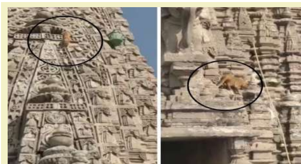
જતાં હાજર રહેલા શ્રદ્ધાળુઓ અને પ્રવાસીઓમાં ભારે કુતુહલ સર્જાયું હતું. આ ઘટના ખાસ કરીને જ્યારે ધજાજી બદલવાનો સમય હતો, ત્યારે જ ખતના ધાર્મિક વાતાવરણમાં એક અનોખી યર્ચા શરૂ થઈ ગઈ હતી. બિલાડીને ઊંચાઈ પર પહોંચીને, વિશેષ ટીમે સંપૂર્ણ સાવધાની અને વ્યવસ્થા સાથે સુરક્ષા માટે ચિંતિત બન્યા હતા. સ્થિતિની ગંભીરતા અને પશુની સુરક્ષાને ધ્યાનમાં રાખીને, મંદિર પ્રશાસન દ્વારા તુરંત જ એક હાઈ-પ્રોફાઇલ રેસ્ક્યુ ઓપરેશન હાથ ધરવામાં આવ્યું હતું. આટલી જોખમી ઊંચાઈ પર પહોંચીને, વિશેષ ટીમે સંપૂર્ણ સાવધાની અને વ્યવસ્થા સાથે

। પ્રતિનિધિ, દ્વારકા, તા.૨૯ । ગુજરાતના સૌથી ઊંચા અને પવિત્ર સ્થળ, દ્વારકાના સુપ્રસિદ્ધ જગત મંદિરના ગગનચુંબી શિખર પર એક બિલાડી ચડી ગઈ હતી. સમગ્ર ઘટનાના વીડિયો સોશયલ મીડિયામાં વાયરલ થયો છે. ધજાજી બદલવાના સમયે લોકોને નજરે પડતાં જ તાત્કાલિક બિલાડીનું રેસ્ક્યુ ઓપરેશન હાથ ધરાવ્યું હતું. ઊંચાઈ પર પહોંચેલી બિલાડીને સુરક્ષિત રીતે નીચે ઉતારવામાં આવી છે. ગુજરાતના પવિત્ર યાત્રાધામ દ્વારકા સ્થિત સુપ્રસિદ્ધ જગત મંદિરના ગગનચુંબી શિખર પર એક અવિશ્વસનીય અને અસામાન્ય ઘટના જોવા મળી. મંદિરના સૌથી ઊંચા ભાગે, જ્યાં ધજાજી (ધજ) ફરકે છે, ત્યાં એક બિલાડી ચઢી