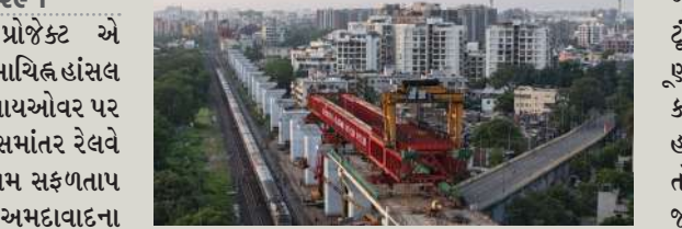
દૈનિક અવરજવરને ધ્યાનમાં રાખીને, જાહેર જનતાને ઓછી અસુવિધા થાય તે માટે આ લોન્ચિંગનું કામ પૂર્ણ કરવા માટે, સ્પાન-બાય-સ્પાન પદ્ધતિનો ઉપયોગ કરીને ૪૫ મીટર લાંબો બ્રિજ લોન્ચ કરવામાં આવ્યો હતો. મુખ્ય ટેકનિકલ વિશેષતાઓની જો વાત કરીએ તો, બ્રિજના સ્પાનની લંબાઈ ૪૫ મીટર છે. જ્યારે જમીનથી રેલ લેવલ સુધી વિઆડક્ટની ઊંચાઈ ૧૯.૫ મીટર છે. કુલ ૧૯ સેગમેન્ટ લોન્ચ કરવામાં આવ્યા છે. અને સ્પાનનું કુલ વજન ૧૨૦૦ મેટ્રિક ટન છે.

પ્રતિનિધિ, અમદાવાદ, તા. ૨૬ | મુંબઈ-અમદાવાદ બુલેટ ટ્રેન પ્રોજેક્ટ એ અમદાવાદ જિલ્લામાં એક મહત્વપૂર્ણ સીમાચિહ્ન હાંસલ કર્યું છે. પ્રોજેક્ટની ટીમે ગિરધરનગર ફ્લાયઓવર પર દિલ્હી-અમદાવાદ મુખ્ય રેલવે લાઈનને સમાંતર રેલવે ઓવર બ્રિજની વિઆડક્ટ લોન્ચિંગનું કામ સફળતાપૂર્વક પૂર્ણ કર્યું છે. ગિરધરનગર બ્રિજ અમદાવાદના સૌથી વ્યસ્ત ફ્લાયઓવરમાં એક છે, જે શાહીબાગ, અસાવર અને કાલુપુરને જોડે છે. હજારો નાગરિકોની