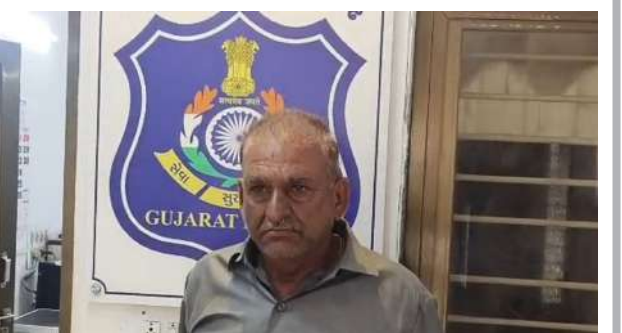
નોંધાવી છે. જેમાં મંડળીના પ્રમુખ અને મંત્રી દ્વારા તા. ૧ એપ્રિલ ૨૦૨૩થી તા ૩૧ જાન્યુઆરી ૨૦૨૪ દરમિયાન ખરીદ વેચાણ સંઘ પાસેથી રાસાયણિક ખાતર સહિતની વસ્તુઓ મંગાવી હતી. જે ખાતર ખેડૂતોને વેચી તેના ઉપજેલા નાણા વસુલી તે નાણા મંડળીના ખાતે જમાવી લીધા હતા. બાદમાં બંને આરોપીઓએ પોતાની સહી ચેકમાં કરીને રૂ. ૧૯.૪૫ લાખ મંડળીના મંત્રીના બેંક ખાતામાં ટ્રાન્સફર કરી અંગત હિત માટે વાપરી ઉંચાપત કર્યાની ફરિયાદ નોંધાવામાં આવી છે.