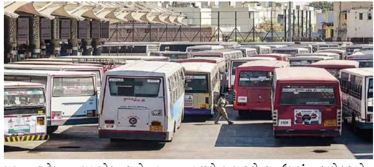
સુરત શહેરના રામચોક અને માતા વરાછાથી એસટી બસ મળશે. જ્યારે ઉત્તર ગુજરાત અને અમદાવાદ માટે મુસાફરોને સુરત સેન્ટ્રલ બસ સ્ટેશનથી બસ સુવિધા મળશે. આ ઉપરાંત, દાહોદ અને પંચમહાલના મજૂરો માટે સુરત સેન્ટ્રલ બસ સ્ટેશનની સામે સુરત સિટી બસ સેવા છે. સુરત સેન્ટ્રલ બસ સ્ટેશનથી બસ સુવિધા

બસો ઉપલબ્ધ થશે. દિવાળીના તહેવારો દરમિયાન, કોર્પોરેશનના સુરત વિભાગ ઉપરાંત, અમદાવાદ, વડોદરા, રાજકોટ, જૂનાગઢ, મહેસાણા, પાલનપુર અને અન્ય વિભાગોને મુસાફરોના ટ્રાફિકને પહોંચી વળવા માટે અંદાજે રૂ. ૧,૦૦૦ વધારાના ભંડોળ મળ્યા હતા. બસો ચલાવવામાં આવશે. અહીં ઉલ્લેખનીય છે કે પેસેન્જર બસ સ્ટેશન ઉપરાંત, એસટી દ્વારા નિયુક્ત બુકિંગ એજન્ટ, મોબાઇલ એપ અને કોપ રિશનની વેબસાઇટ દ્વારા પણ ઓનલાઇન બુકિંગ શક્ય કરાવી શકાય છે. "એસ.ટી. આપના દ્વારા" યોજના હેઠળ જે મુસાફરોએ આખી બસનું ટ્રુપ બુકિંગ કરાવ્યું છે.