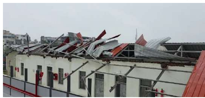
પ્રતિનિધિ, નવસારી, તા. ૨૬ | વાવાઝોડાની ઝપેટમાં ચીખલી અને વાંસદા તાલુકાની શાળાઓમાં નુકસાન થયું છે. વાંસદા અને ચીખલી તાલુકામાં કુલ ૧૧ શાળાઓના પતરા ઉડ્યા છે. તાલુકામાં અનેક જગ્યાએ વૃક્ષો ધરાશય અને લોકોના ઘરના પતરા ઉડવાની ઘટના સામે આવી છે. જેને લઈ ગરીબ મધ્યમ વર્ગના લોકોની હાલત કફોડી થઈ છે, અને તેઓ ધરવિહોણા બન્યા છે. વિદ્યાર્થીઓને અન્ય વર્ગમાં ભેરાઈ રાખેલા મુજબ શિક્ષણ કાર્ય ચાલુ રાખવામાં આવશે. છેલ્લા ૨ દિવસ અગાઉ રાત્રી દરમિયાન નવસારી જિલ્લાના ચીખલી અને વાંસદા તાલુકામાં ભારે વરસાદ સાથે વાવાઝોડું ગ્રાટક્યું હતું. વાવાઝોડાના કારણે ચીખલી તાલુકામાં અનેક જગ્યાએ વૃક્ષો ધરાશય થતા લોકોના ઘરના પતરા ઉડવાની ઘટના સામે આવી હતી. જેને લઈ ગરીબ મધ્યમ વર્ગના લોકોની હાલત કફોડી થઈ હતી, અને તેઓ ધરવિહોણા બન્યા હતા. ગરબાના આયોજનને વેરવિખેર કરી નાખ્યું હતું. જેને લઈ ગરબાના આયોજકને નુકસાની તેમજ ખેલેયાઓના થનગનાટ પર બ્રેક